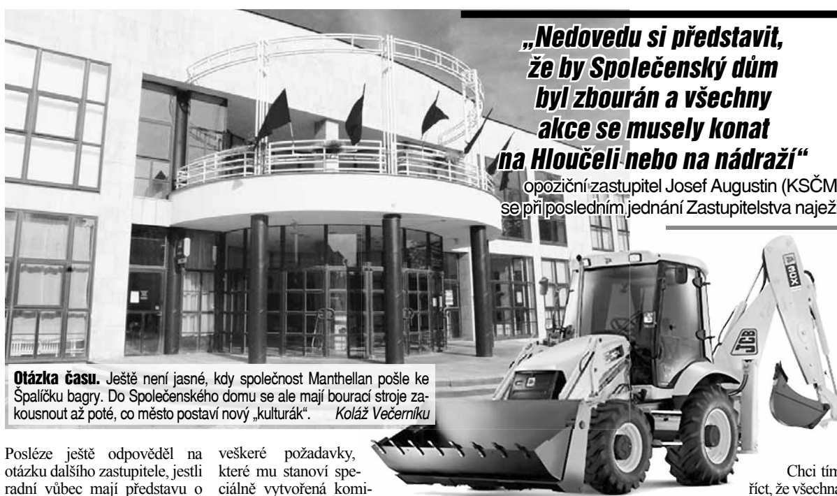
Otázka času. Ještě není jasné, kdy společnost Manthellan pošle ke Spálíčku bagry. Do Společenského domu se ale mají bourací stroje zakousnout až poté, co město postaví nový „kulturák“.