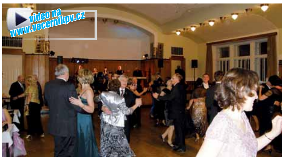
Všichni na parketu! Své taneční umění na parketu předvedli gentlemani a dámy v elegantních róbach za hudebního doprovodu skupiny ROMANTICA.

Abyste vyhovělo hudebnímu vkusu všech návštěvníků, bylo plesové veselí rozděleno na čtyři stanoviště: v přednáškovém sále hrála