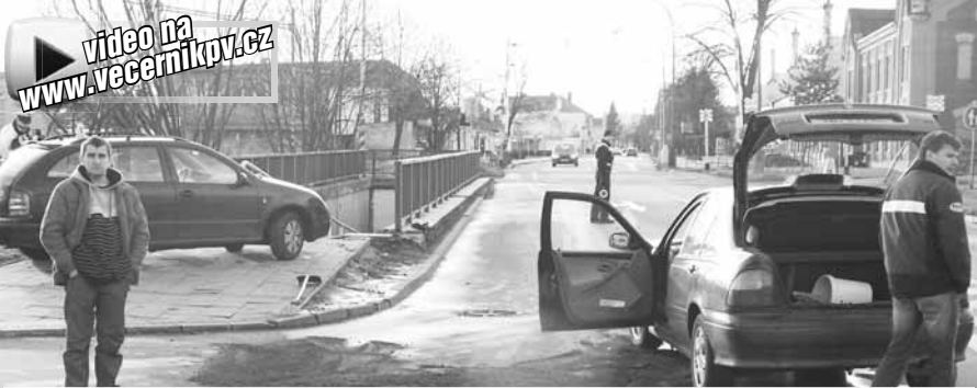
Rána jako z děla. Řidič Roveru sestřelil zezadu škodovku, která byla nárazem odmrštěna až na chodník za benzínkou. Obě auta byla tvrdou srážkou značně poznamenána, osádkám se našťástí nic nestalo.