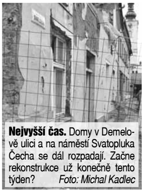
Nejvyšší čas. Domy v Demelově ulici a na náměstí Svatopluka Čecha se dál rozpadají. Začne rekonstrukce už konečně tento týden?

závažné chyby v projektu. Zatímco minulý týden mělo proběhnout nové stavební řízení s opraveným projektem, z čelních štítů obou budov začíná masivně opadat omítka. „Vím o tomto problému, ale jsem optimista. Stavební řízení podle mého názoru proběhlo úspěšně a pokud příští týden obdržíme písemné stavební povolení, okamžitě zahájíme rekonstrukční práce,“ informovala v pátek Večerník Lenka Skácelová. Doufáme tedy, že všechno potřebné klapne a stavbaři se skutečně ihned pustí do rozsáhlých oprav. Je opravdu nejvyšší čas!