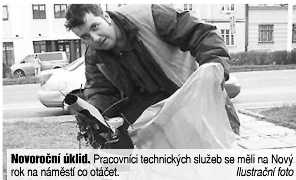
Novoroční úklid. Pracovníci technických služeb se měli na Nový rok na náměstí co otáčet. Ilustrační foto