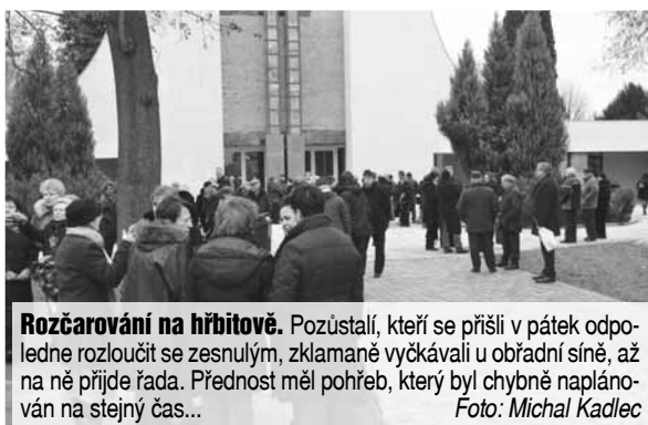
Rozčarování na hřbitově. Pozůstalí, kteří se přišli v pátek odpoledne rozloučit se zesnulým, zklamaně vyčkávali u obřadní síně, až na ně přijde řada. Přednost měl pohřeb, který byl chybně naplánován na stejný čas...

mo na místě, takže nemám zatím žádné zprávy. Podle všeho ale naštěstí nedošlo k žádným konfliktům. Zda budou nějaké stížnosti, to se dozvíme až příští týden, kdy budu hovořit s rodinou zemřelého,“ uvedl pro Večerník Pavel Makový. Přítomní pozůstalí ale naštvání byli. „Kdyby se to stalo v léte, tak neřeknu ani popel. Ale já jsem se přijel rozloučit s kamarádem až z Vyškova a půl hodiny tedy mrznu jako pes. Přitom nám nikdo nic neřekl. Čekali jsme před obřadní síní, pouze vyšel chlapík v montérkách a jen řekl, že pohřeb má nějaká paní. Žádné vysvětlení, žádná omluva na místě. My prostě máme čekat! No vidíte, počkat musí i ten mrtvý!“, neskrýval před Večerníkem rozčarování muž středního věku za