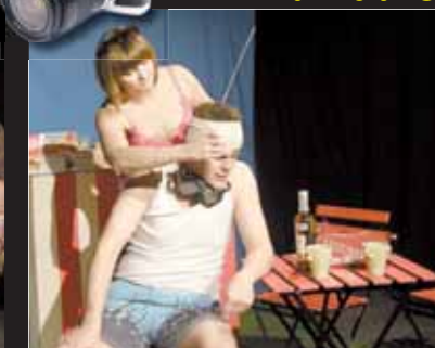
Herci se vytáhli. Při repríze komedie Koupačka publikum nikdo nemusel ke smíchu nutit...