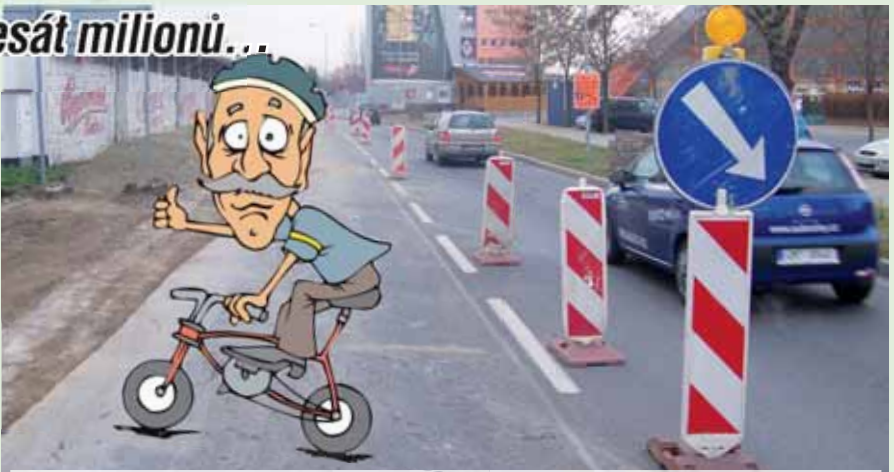
Další spojnice. V roce 2011 se zrealizovala stavba dvousetmetrové části cyklostezky v ulici U Stadionu. Dnes se už po ní prohánějí stovky cyklistů denně.

Zhruba před třemi roky se radnice dostala do palby kritiky za to, že cyklostezky jsou v Prostějově stavěny bezmyšlenkovitě, nejsou propojené a vedou vlastně odnikud nikam. „To už ale dnes až tak pravda není... V mnoha případech se podařilo vyřešit majetkové vztahy, potřebné pozemky vykoupit a propojit tak některé části cyklostezek. Navíc se podařilo stezkami vybavit i prostějovská předměstí a cyklisté po nich mohou vyjet směrem na Bedihošť či Kostelec na Hané. Co nám však pořád chybí, je cyklostezka do Vrahovic. Odtud i tam jezdí strašně moc cyklistů a v poslední době tady došlo k několika tragickým nehodám. Jenom proto, že tady cyklisté nedávali pozor na silnici nebo jeli po chodníku,“ konstatovala Alena Rašková. Náměstkyně primátora si vzá-