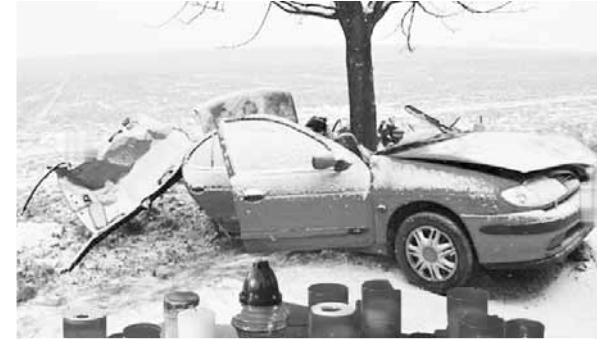
Nečekaná tragédie. Automobil s devětáctiletým magistrzem narazil do stromu. Před lékárnou Dr. Max v Plumlovské ulici se bezprostředně po nehodě objevily svíčky...

Jak se později rozkřiklo, oběti tragédie se stal známý magistr z lékárny Dr. Max, která se nachází v Plumlovské ulici v objektu prodejny Billa. Vždy usměvavého, laskavého, inteligentního a ochotného lékárníka z jeho zaměstnání, ve kterém trávil spoustu času, znalo velké množství lidí. V osudný den vezl svoji čtyřletou dceru na logopedii. S manželkou měl ještě další dceru. Právě je zasáhla nečekaná tragédie nejobleštější. Nezbyvá než vyslovit upřímnou soustrast celé rodině.