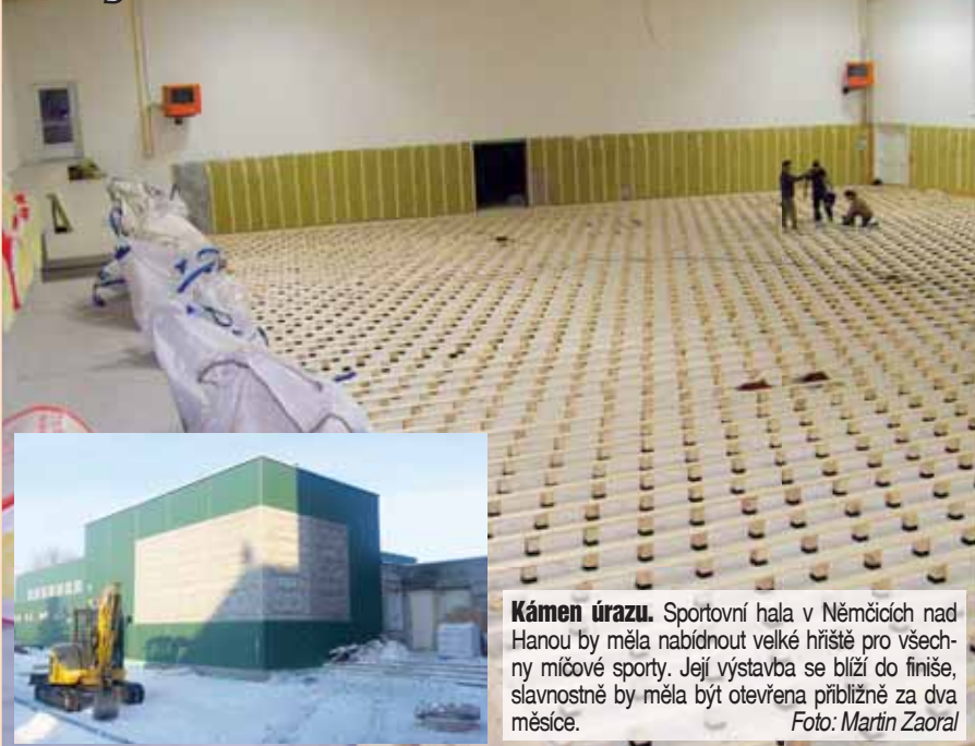
Kámen úrazu. Sportovní hala v Némčicích nad Hanou by měla nabídnout velké hřiště pro všechny míčové sporty. Její výstavba se blíží do finále, slavnostně by měla být otevřena příibližně za dva měsíce.