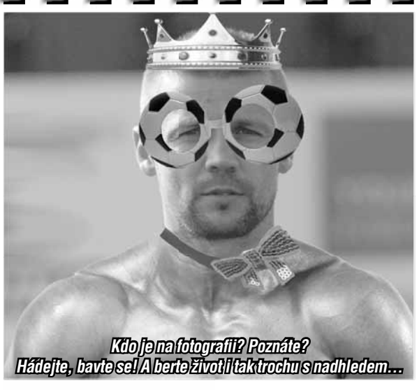
Kdo je na fotografii? Poznáte? Hádejte, bavte se! A berte život i tak trochu s nadhledem...