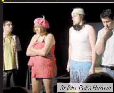
Co na dovolené bez bazénu? Na „koupačku“ to moc nevypadá, ale zato se nasmějete!