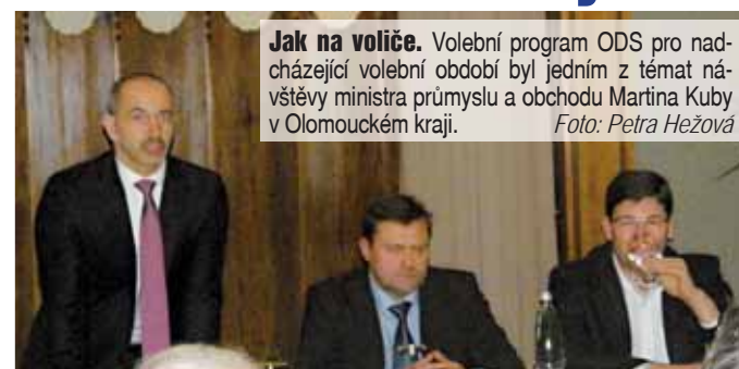
Jak na voliče. Volební program ODS pro nadcházející volební období byl jedním z témat návštěvy ministra průmyslu a obchodu Martina Kubu v Olomouckém kraji.

Olomoucký region je prvním, do kterého se ministr Kuba hned na počátku roku vydal. V následné debatě se nevyhýbal ani komentářům k předvánoční vládní krizi, ani otázkám současně, ne příliš optimální pozice Občanské demokratické strany. „Jsme silnou pravicovou stranou, schopnou vyhrávat volby a to, že teď nejsme úplně v optimální kondici, což je dobré si přiznat, by nás mělo motivovat k tomu, abychom si znovu hledali cestu k pravicovému voličům. Volební program ale nemůže vzniknout odtrženě někde v Praze bez konzultací s pověřenými zástupci, kteří vědí o konkrétních problémech právě té dané oblasti,“ zdůvodnil ministr účel úterního setkání, kterého se zúčastnili