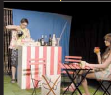
Zápletka. Letní idylka se změnil v drama, když ruf teploměru se snaží trhnout rekord a v bazénu za domem chybí voda