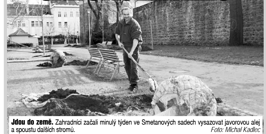
Jdou do země. Zahradníci začali minulý týden ve Smetanových sadech vysazovat javorovou alej a spoustu dalších stromů.

Prostějov/mik - Velmi příznivého počasí využila zahradnická firma k výsadbě avizované javorové aleje ve Smetanových sadech. Jak už dříve Večerník informoval, prostějovští radní odmítli alej lipovou, a to z důvodu hrozičích alergenů.