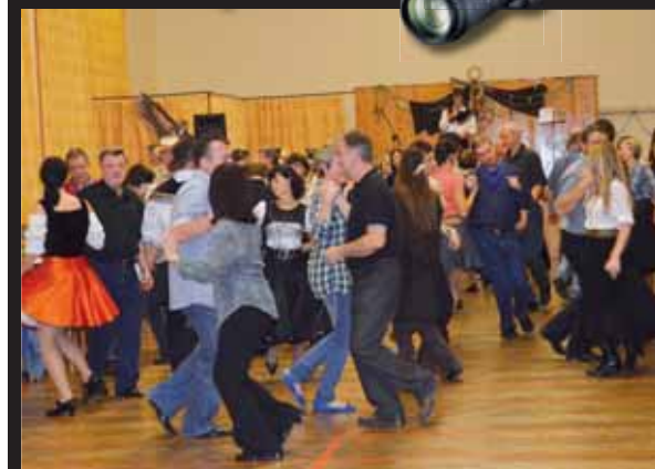
Vydařil se. Do Ohrozimí si našly cestu přibližně dvě stovky lidí, kteří se celý večer dobře bavili.