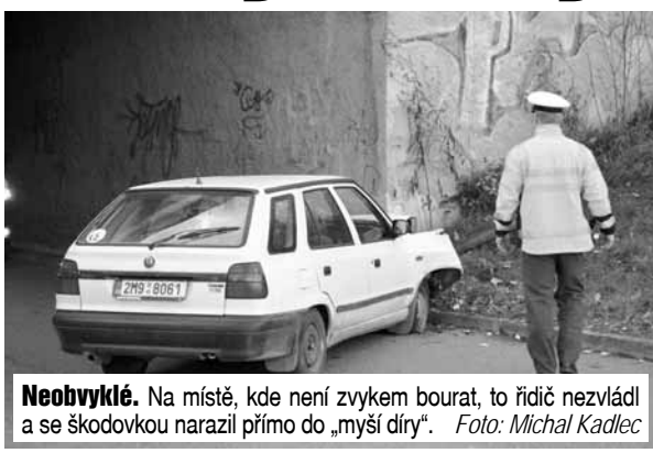
Neobvyklé. Na místě, kde není zvykem bourat, to řidič nezvládl a se škodovkou narazil přímo do „myší díry“.

dem zastavila hlídka policie. „Stala se tu dopravní nehoda“, vysvětlila Večerníku sympatická policistka. Vydali jsme se na místo po svých a spatřili, jak je bílá škodovka zapíchnutá do rohu dálničního podjezdu. Šofér se zjevně do „myší díry“ netrefil! „Sanitka už lehce zraněného řidiče odvezla do nemocnice, jednalo se o mladého čtyřiatřicetiletého muže. Nebyl pod vlivem alkoholu, podle všeho stojí za nehodou náhlá zdravotní indispozice a ztráta kontroly nad řízením“, dověděl se Večerník přímo na místě od zasahujícího policisty.