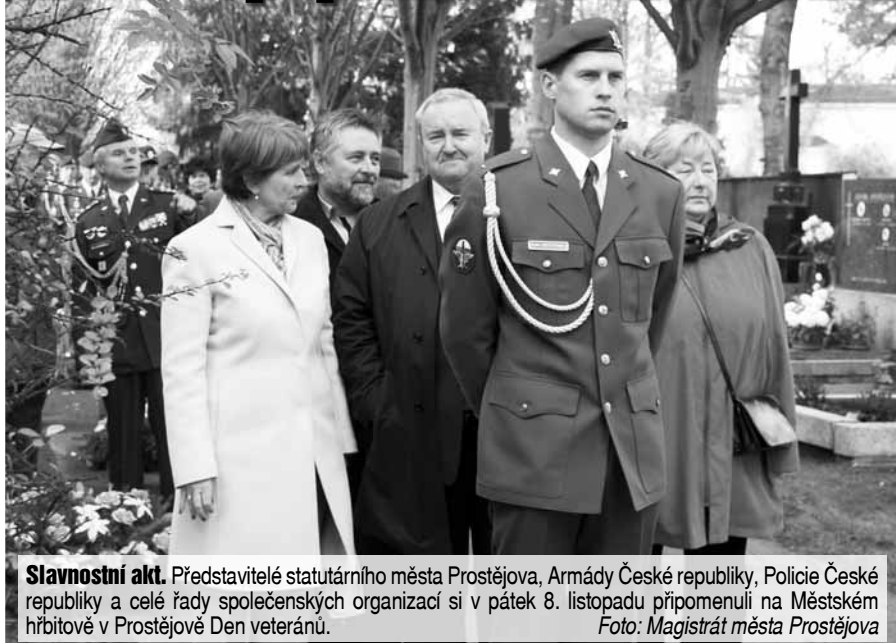
Slavnostní akt. Představitelé statutárního města Prostějova, Armády České republiky, Policie České republiky a celé řady společenských organizací si v pátek 8. listopadu připomenuli na Městském hřbitově v Prostějově Den veteránů.