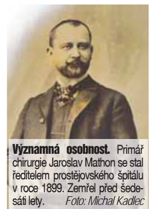
Významná osobnost. Primář chirurgie Jaroslav Mathon se stal ředitelem prostějovského špitálu v roce 1899. Zemřel před šedesáti lety.