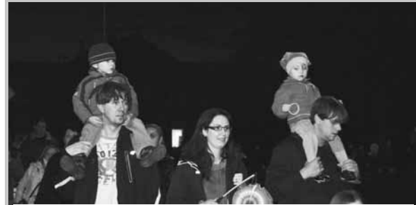
Dlouhý průvod. Vrahovicemi se v pátek v podvečer prohnala smrt mask a lampionů. Odhadem se akce zúčastnilo na šest stovek občanů.

Vrahovice/mik - Páteční podvečer uplynulého týdne patřil ve Vrahovicích oslavám Halloweenu. Neskutečně pestrý průvod zlejších dětí s rodiči má už v této části Prostějova svoji letitou tradici, ale letošní akce předčila účasti ty předchozí. Samotný průvod, kterému vědly roztočivé masky a roz-