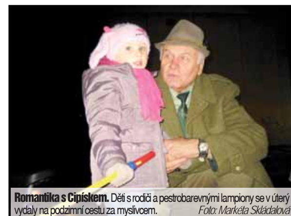
Romantika s Cipískem. Děti s rodiči a pestrobarevnými lampiony se v úterý vydaly na podzimní cestu za myslivcem.

ordinátora Mateřského centra Cipísek v Prostějově. Děti s rodiči pak čekalo zpívání s kytarou, promítání pohádky i malá odměna. „Ale hlavně spousta zážitků ze setkání s panem myslivcem, z množství svítících lampionů a také z dobrého pocitu, že mohli pomoci lesním zvířátkům,“ připomněla Markéta Skládalová.