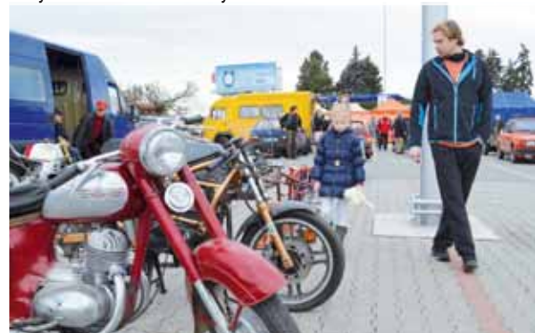
také letos sem dorazili i z Polska a Slovenska,“ liboval si. Nutno podotknout, že atmosféra celé akce byla příjemně nostalgická a dokázala vás vtáhnout ko pář desítek let zpět...