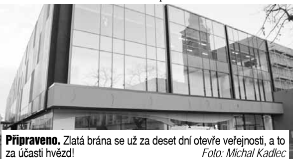
Připraveno. Zlatá brána se už za deset dní otevře veřejnosti, a to za účasti hvězd!

Podrobný program slavnostního otevření Zlaté brány přineseme již v příštím čísle!