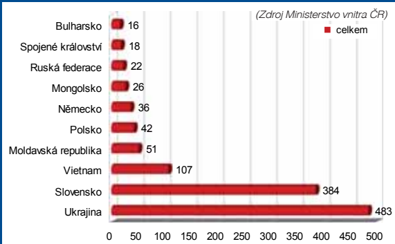
Počet cizinců v Prostějově – jednotlivé národnosti (deset nejpočetnějších)

šem městě, pochopitelně kromě Slováků, zaujímá také vietnamská menšina, která se vyznačuje velkými kulturními a jazykovými rozdíly, které jsou jednou z hlavních příčin uzavřenosti této menšiny. Je dobře, že naši lidé vnímají Vietnamce převážně jako zdivočelá a pracovití. I když tu a tam prosáknou z této komunity nějaká aféra s pěstováním marihuany, Vietnamci se v drtivé většině přizpůsobili tuzemským zákonům.