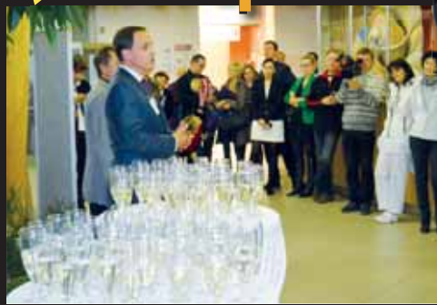
S hublinkami. U zahájení výstavy k oslavám výročí založení nemocnice pochopitelně nemohlo chybět ani šampaňské pro všechny hosty.