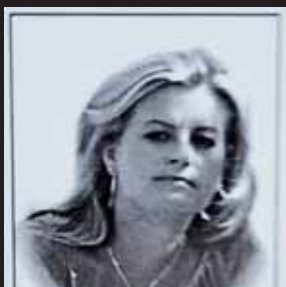
Zdroj: čtenář Večerníku

Nyní už totiž Večerník může jistě rozptýlit dohady a fámy, které se v uplynulých dnech okamžitě rozletěly po celém městě. Není pravda, že šlo o nešťastnou náhodu nebo naopak o případ, kdy někdo druhý měl podíl na tragédii. Z úst samotné maminky nešťastnice totiž bylo potvrzeno, že šlo o sebevraždu! Stejně pravdivá se ukázala informace, že se jednalo o zdravotní sestru z Prostějova. Matka sedmatřicetileté ženy se redakci Večerníku telefonicky ozvala poprvé ještě před zveřejněním reportáže předminulou nedělí večer se žádostí o citlivé osvětlení celé události. Podruhé se tak stalo v uplynulém týdnu s prosbou o kondolenci a poděkování.