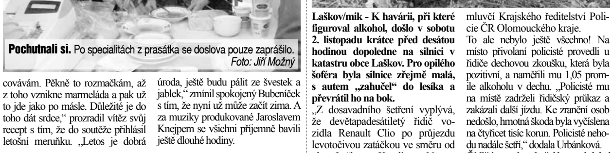
Pochutnali si. Po speciálních z prasátka se doslova pouze zaprášilo.

Němčice nad Hanou/mik - Ze spáchaní přechodu krádeže je podezřelý zatím neznámý pachatel, který se v přesně nezjištěnou dobu na začátku listopadu vstoupil do neobyvaného rodinného domu v Hradčanech. Ukradl z něho radiopřehrávačku a nepohlal ani slivovici a dvěma lahvičkami griotky. Celková škoda odcezením a poškozením byla vyčíslena na jeden tisíc devět set korun. „Ze spáchaní přechodu krádeže je podezřelý zatím neznámý pachatel, který se v přesně nezjištěnou dobu na začátku listopadu vstoupil do neobyvaného rodinného domu v Hradčanech. Ukradl z něho radiopřehrávačku a nepohlal ani slivovici a dvěma lahvičkami griotky. Celková škoda odcezením a poškozením byla vyčíslena na jeden tisíc devět set korun.“