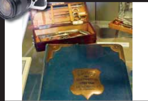
Nejcennější relikvie. Výstava ve vestibulu prostějovského špitálu obsahuje i staré lékařské nástroje a hlavně unikátní návštěvní knihu nemocnice princezny Stefanie z roku 1888.