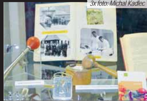
Kus historie. Výstava ve vestibulu prostějovského špitálu obsahuje i staré lékařské nástroje a hlavně unikátní návštěvní knihu nemocnice princezny Stefanie z roku 1888.