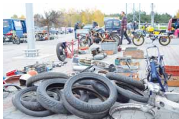
Nostalgie. Na sobotní burze byly na prodej i staré motorky. Daly se tady ale sehnat i náhradní díly všeho druhu.