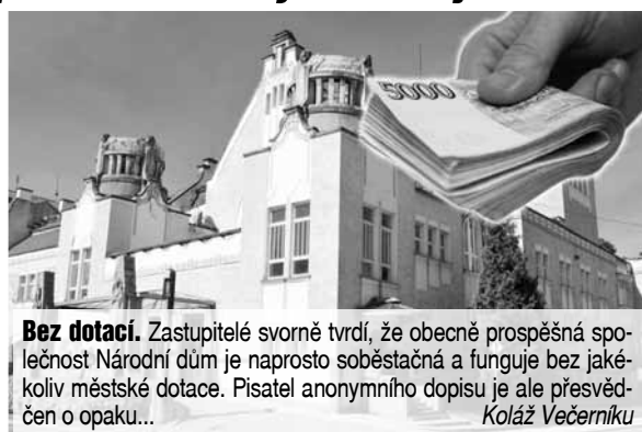
Bez dotací. Zastupitelé svorně tvrdí, že obecně prospěšná společnost Národní dům je naprosto soběstačná a funguje bez jakékoliv městské dotace. Pisatel anonymního dopisu je ale přesvědčen o opaku... Kolář Večerníku

Už při založení obecně prospěšné společnosti Národní dům jsme byli často obviňováni z jakéhosi komunálního socialismu a z toho, že restaurace je jakousi socialistickou hospodou drženou nad vodou jen díky penězům proudícím odkněd shora. Jsem rád, že