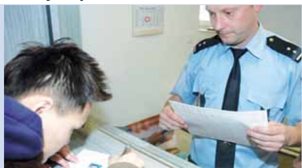
Přibývá jich. V posledních letech se v Prostějově přihlásil k trvalému či dlouhodobému pobytu dvacet až třicet nových cizinců. Ilustrační foto

„Je to nesmysl, i když na první pohled to může vypadat, že cizinci opravdu Prostějovanům berou práci. Jenomže ono je to trochu jinak. Vezměte si například Ukrajince, ti přijmou práci, nad kterou našinec ohmje nos. Navíc všichni cizinci jsou ochotni pracovat rozhodně déle než osm hodin, prostě jak zaměstnavatel potřebuje. A nemyslete si, v případě Ukrajinců jde také o lidi, kteří i přes stredoškolské či dokonce vysokoškolské vzdělání pracují v Prostějově 'u lopaty', jenom proto, aby užívali rodinu. U nás makají a domů posílají peníze. Mnohdy jsou navíc placeni podprůměrně, jsou totiž levnou pracovní silou. Ale i tak si tady vydělají víc, než doma na Ukrajině,“ podotkla náměstkyně prostějovského primátora. Na závěr je zapotřebí dodat, že v Prostějově žijí i cizinci, kteří neopustili svoji rodnou zemi z důvodu čistě ekonomických či neděje Bože politických. „Registrujeme u nás také občany z vyspělých zemí, jako například