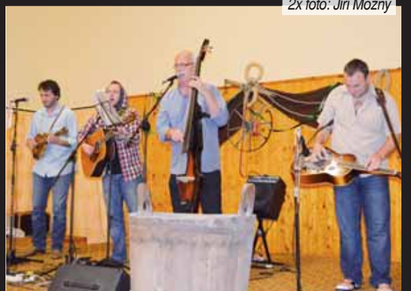
Legends. I letošní ročník country plesu ozdobila svou účastí skupina Poutníci.