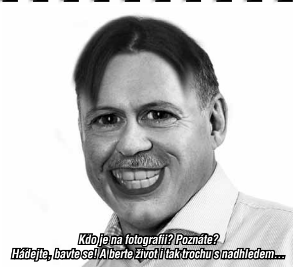
Kdo je na fotografii? Poznáte? Hádejte, bavte se! Alberte životě ti tak trochu s nadhledem...