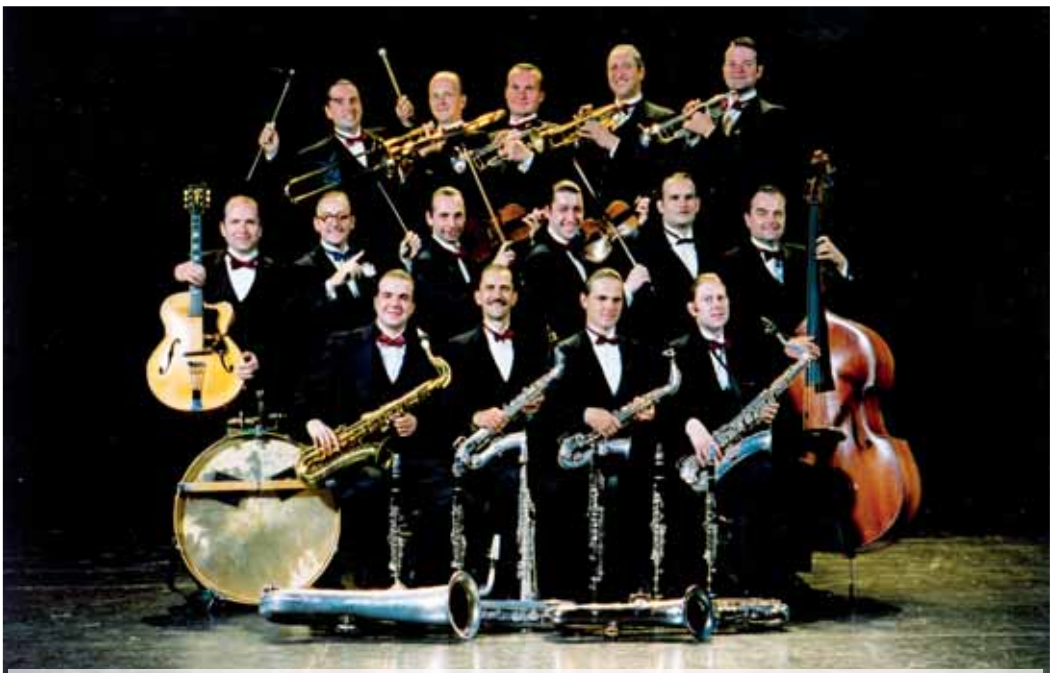
To jsou oni. Skupina Melody Makers v plné parádě.

„Byl bych moc rád, kdyby to klaplo i příští rok, protože publikum bylo úžasné. Tím samozřejmě všechny zdravím a přeji jim rok plný krásných zážitků, nejen těch hudebních (úsměv)“.