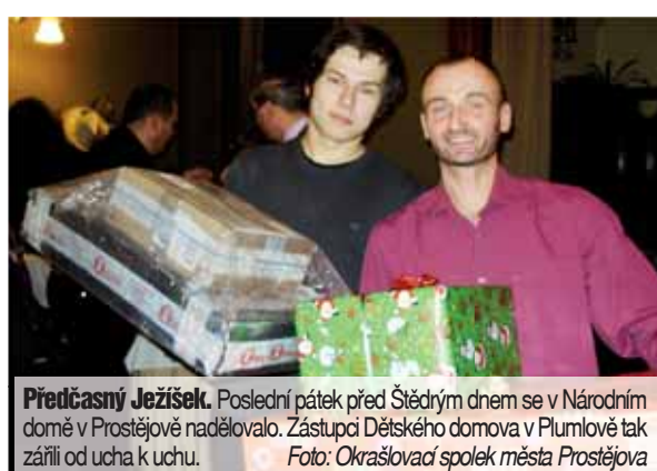
Předčasný Ježíšek. Poslední pátek před Štědrým dnem se v Národním domě v Prostějově nadělovalo. Zástupci Dětského domova v Plumlově tak zářili od ucha k uchu.

Na večírku pak spolu s autorem fotografem Jiřím Pekou pokřtila nový kalendář na rok 2014, který ke 100. výročí prostějovské radnice vydal Okrašlovací spolek. „Rekla mi manželka - když pořádat fotíš, zkus vyfotit Prostějov trochu jinak. Tak jsem jí to splnil. A Prostějov - trochu jinak je i název kalendáře.“ pozname-