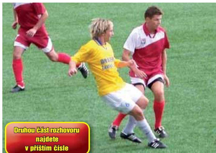
Druhou část rozhovoru najdete v příštím čísle

„Ano, každé zkouškové bylo krizové (úsměv). V mém případě to bylo o trochu složitější, protože skončila podzimní část fotbalové sezóny, prosinec byl volný, ale první nebo druhý týden v lednu začala zimní příprava. Spolužáci měli čas na