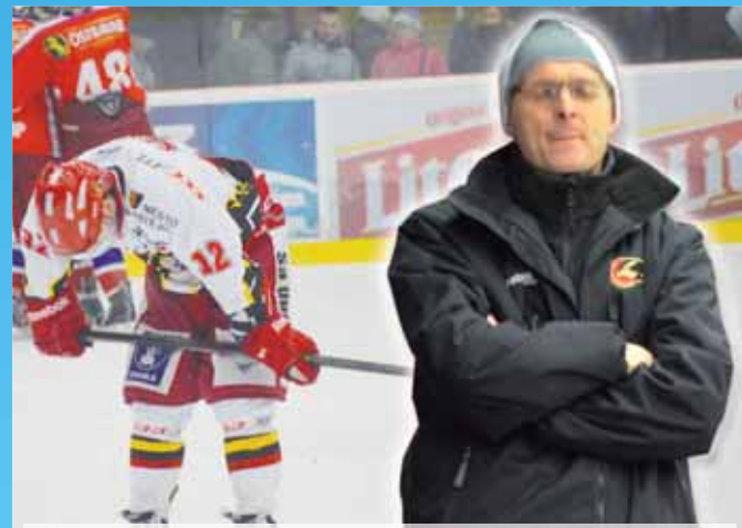
Krise. Dojde po třetí porážce v řadě na výměnu trenéra?