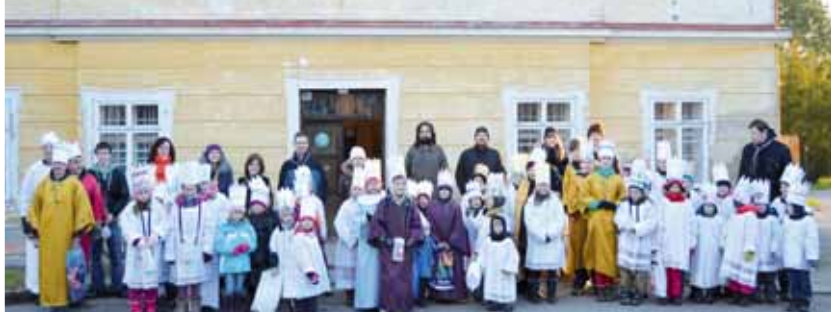
Šedesát králů. Rekordní počet koledníků se letos sešel v Nezamyslicích. Většinu tvořily děti z místní mateřinky, nejmladším byly tři roky a některé měly i hudební nástroje.

Prostějov/mls - Tříkrálová sbírka byla letos velmi úspěšná. V prostějovském děkanátu se do 14. ledna vybralo celkem 795 033 korun, což je o osmdesát tisíc korun více než loni. Peníze putovaly na konto prostějovské Charity, která je využije při službě starším a postiženým občanům.