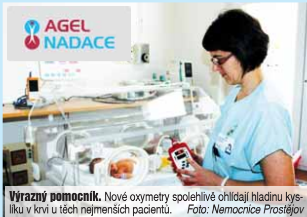
Výrazný pomocník. Nové oxymetry spolehlivě ohlídají hladinu kyslíku v krvi u těch nejmenších pacientů.

„Jedná se o přístroje, které neinvazivně monitorují hladinu kyslíku v krvi. Jsou určeny pro děti všech věkových kategorií a slouží především v případě, kdy je pacient ohrožen dechovou nedostatečností. Jedná se tedy hlavně o nedonošené děti, pacienty s různými respiračními diagnózami jako jsou bronchitidy, pneumonie, laryngitidy, epiglottitidy,