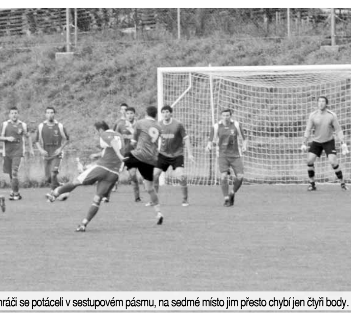
Posoune se výš? Koničtí hráči se potáceli v sestupovém pásmu, na sedmé místo jim přesto chybí jen čtyři body.