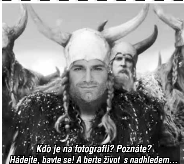
Kdo je na fotografii? Poznáte? Hádejte, bavte se! A berte život s nadhledem...