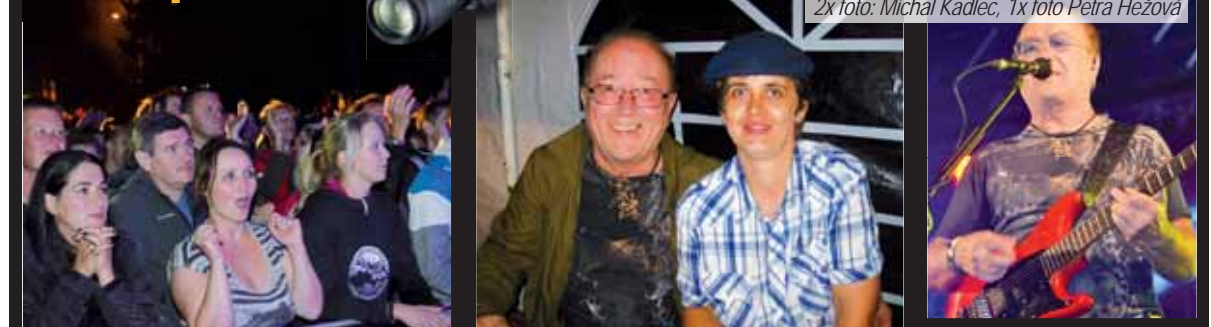
Bylo plno. Na Olympic dorazila v sobotu na přehradu spousta fanoušků všech generací.