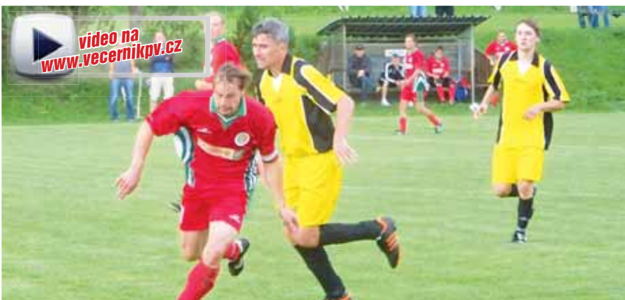
Souboj zkušeností. Oba týmy poslaly do hry po šesti hráčích, jimž už bylo alespoň třicet let. Lépe z tohoto srovnání vyšla domácí ekipa.

Zápasy Vrchoslavic byly v uplynulé sezoně zárukou vysokého počtu branek i několikanásobně více tůvových šancí a toto pravidlo uchovalo svou platnost i do aktuálního ročníku. V utkání na půdě Plumlova tak došlo nejen k souboji dvou nejlepších regionálních celků, které si nevybojovaly právo postupu do vyšší soutěže, či mužstev účinně kombinujících nedávné dorostence s vyzrálými třicátníky i čtyřicátníky, ale také na ofenzivní podívanou, jež mohla přinést i dvojciferný počet branek. A Večerník byl u toho!