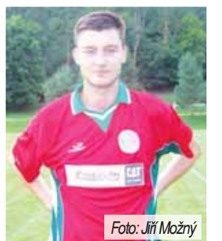
Přišel jste s vizečkou nejlepšího střelce třetí třídy, co očekáváte v I.B třídě Olomouckého KFS? „Ze budu dávat góly i nadále, byt' počítám s tím, že jich už tolik nebude. Takže snažit se střilet a věřit, že se bude dařit. Soutěž je o hodně rychlejší, techničtější, v tom jsou hlavní rozdíly. A také gólmáni jsou daleko lepší.“