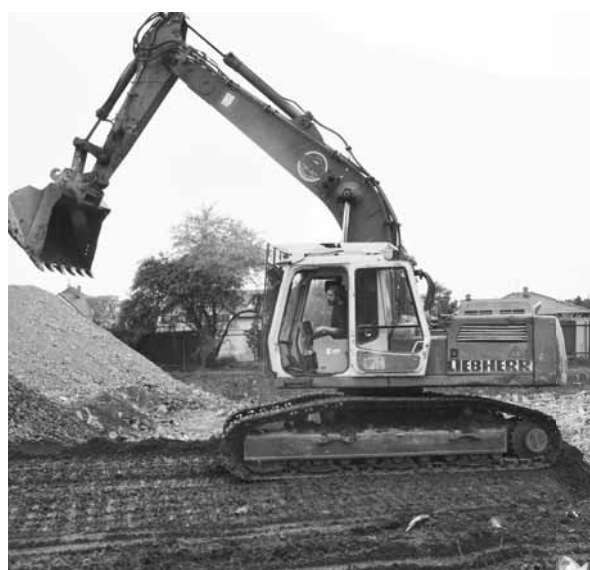
Stará a nová doba! Současný pohled už vůbec nepřipomíná dříve tolik oblíbené a navštěvované koupaliště za velodromem. Nahradit jej má nové vyprojektované plavecké areály.

Všichni současní radní zároveň zdůrazňují, že bez kýžené státní dotace se do projektu nepustí. S tímto jdou Prostějovem současně i fámy, že pozemek pro zdemolované koupaliště za velodromem „zaberou“ tenisové. „Také jsem tyto řeči slyšel. V tuto chvíli je ale prioritou města zachovat původní plány a držet se projektu nového plaveckého areálu. Pro tuto část Prostějova a jeho občany je koupaliště oprávněně požadavkem,“ dodal náměstek prostějovského primátora.