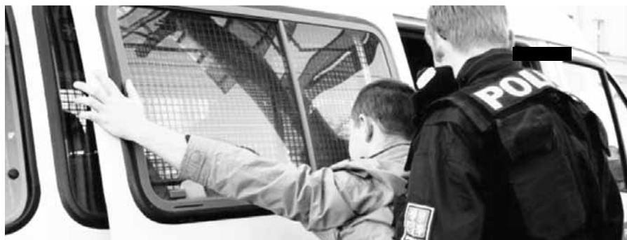
Na hrubý pytel hrubá záplata. Policisté měli napilno, ale násilníka zpacifikovali i přesto, že jednoho z nich zranil. ilustrační foto

Neurvalý chlapík ale stále neměl dost a dal průchod další vlně své agresivity. Jednoho z policistů dokonce kopl do ko-