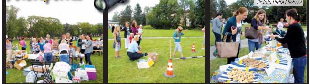
Letní rodinný piknik. Setkání pod širým nebem se spoustou vynikajících lahůdek. Co víc si přát?