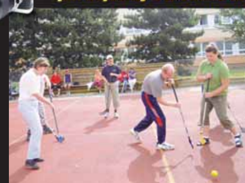
Hokejoví mistři. V Soči na Čechy hokejové zlato nezbýlo, v LIPCE se ale s hokejkou utkali ti nejlepší.