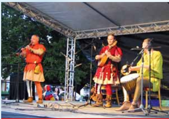
Dávno zapomenuté tóny minulosti. Potulní trubadúři ze skupiny Bakchus předvedli pravý středověký hudební nářez na loutnu.

Urozené dámy, vznešení páno- vé, prostějovské měšťanstvo i lid prostý, který se uplynulý čtvrtek v podvečer dostavil na náměstí T. G. Masaryka, mohl okusit něco málo z dob renesance. O zábavu se urozenému panstvu v publiku postarali středověcí pěvci, hu- debníci a herci, kteří předvedli ukázky šermu, tehdejšího stylu boje, výzbroje, renesančního tan- ce, oděvu slavnostního i prostého a nechyběla pochopitelně ani hudba. Tu měli na starost potulní