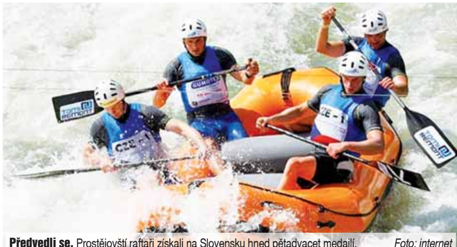
Předvedli se. Prostějovští raftaři získali na Slovensku hned pětadvacet medailí.

Čunovo (Slovensko), Prostějov/jim - Ve velkou dominanci všech mužských posádek Tomi-Remont Prostějov se změnilo nedávné raftařské kontinentální mistrovství ve slovenském Čunovu. Muži, junioři a veteráni si vyjeli celkově tři zlata, stříbro a bronz v celkovém hodnocení a dalších šestnáct cenných kovů v jednotlivých disciplínách, příliš pozadu ne-