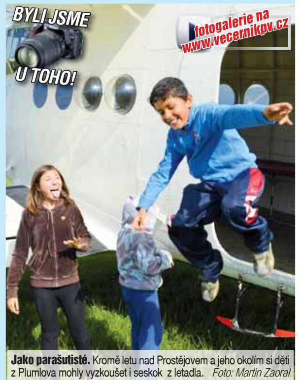
Jako parašutisté. Kromě letu nad Prostějovem a jeho okolím si děti z Plumlova mohly vyzkoušet i seskok z letadla.