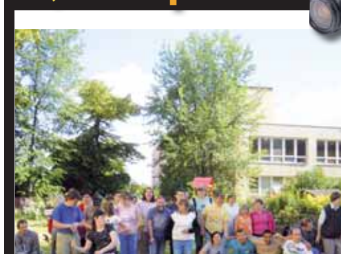
Mladí olympionici. Po sněhu a ledu nebylo ani památky, zato nechyběla dobrá nálada.