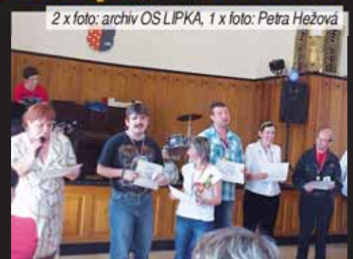
Sláva vítězům. Ani tahle olympiáda se neobešla bez slavnostního předávání medailí vítězům.