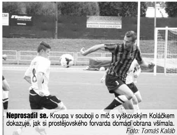
Nepronadil se. Kroupa v souboji o míč s vyškovským Koláčkem dokazuje, jak si prostějovského forvarda domácí obrana všimla.

3. kolo, sobota 23. srpna, 16:30 hodin: Kroměříž – Slovácko „B“, (pátek 22. 8., 18:00); Zlín „B“ – Opava „B“ (10:30), Líšeň – Zábřeh, Uničov – Orlová (neděle 24. 8., 10:15); Třebíč – Hulín, Břeclav – Sigma Olomouc „B“, 1. SK Prostějov – 1. HFK Olomouc, Hlučín – Vyškov, Zábřeh – Zlín B (17.8., 16:30)