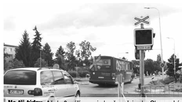
Na tři týdny. Až do 8. září neprojde přes přejezd v Olomoucké ulici ani kolo!

Večerník bude situaci okolo uzavřené Olomoucké ulice po celé tři týdny pečlivě sledovat.