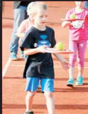
Dokážu to! Jedna z možných budoucích nadějí při práci s raketou.