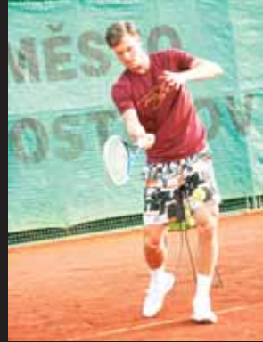
Nešetřili jej. Tomáš Berdych s vervou vracel míčky přes síť.