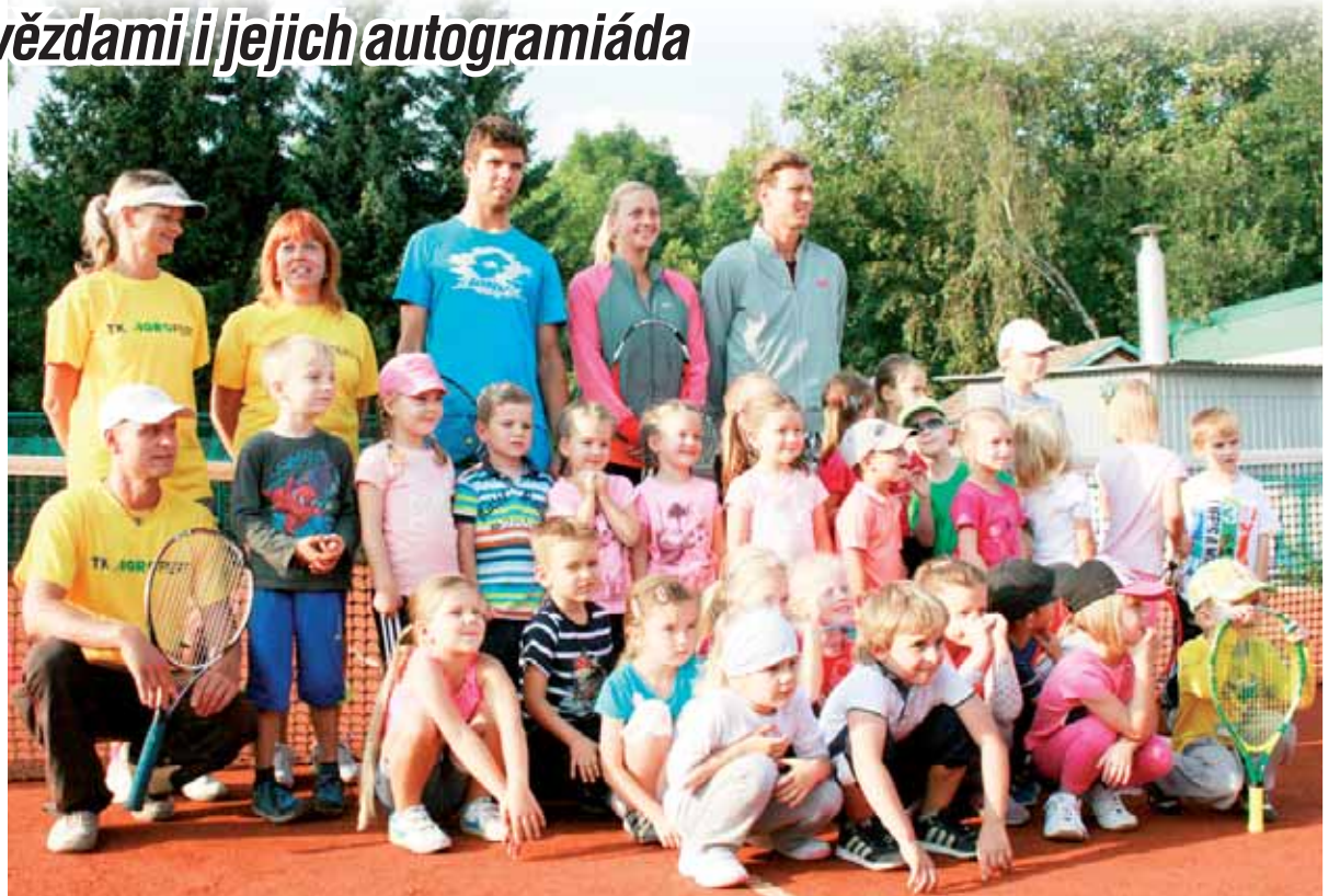
Spolu to dokážeme! Nejmladší naděje prostějovského tenisu na společném snímku s trenéry tenisové školy (ve žlutém zcela vlevo) a třemi hvězdami TK Agrofert Prostějov Jirkou Veselým, Petrou Kvitovou a Tomášem Berdychem (uprostřed zleva).

Letošní zájem o zápis pětiletých a mladších dětí proběhl až nad očekávání, od října tu začne s tenismem hned dvaatřicet předškolá-