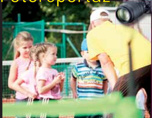
Pokyny. Nejmladší zájemci o tenisovou kariéru hlídají rady od jednoho z trenérů.