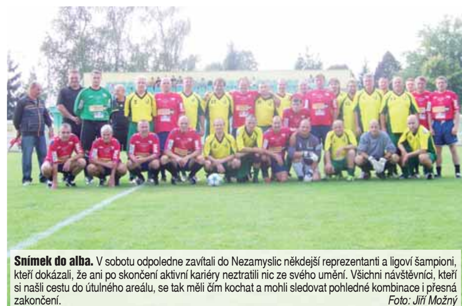
Snímek do alba. V sobotu odpoledne zavítali do Nezamyslic někdejší reprezentanti a ligoví šampioni, kteří dokázali, že ani po skončení aktivní kariéry neztratili nic ze svého umění. Všichni návštěvníci, kteří si našli cestu do útulného areálu, se tak měli čím kochat a mohli sledovat pohledně kombinace i přesná zakončení.

Pátou branku přidal čtvrt hodiny před koncem Veselý (0:5), stejný hráč vzápětí bombou z více než třiceti metrů téměř vymetl šibenici, proti ovšem byla pravá tyč. A brankovou konstrukci orazítkovali i domácí, Pavelkovo dalekosmou ránu vytáhl Bobok alespoň na břevno, s následnou dorážkou Moravce si už poradil. Šesté branky tak dosáhli opět internacionálové, Mičinec udělal klíčku gólmánovi a zleva zametl do odkryté brány. Mamá byla snaha klouzajícího beka na čáře - 0:6.