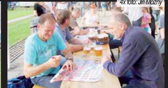
Autogramiáda. Po skončení zápasu a při doplňování živin se někdejší fotbalové hvězdy s radostí podepisovaly.