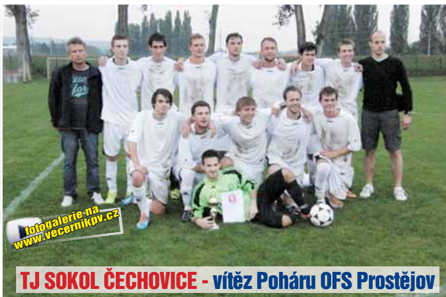
TJ SOKOL ČECHOVICE - vítěz Poháru OFS Prostějov