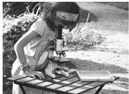
Rostliny pod mikroskopem. Návštěvníci „Zahradní slavnosti“ mohli rostliny prozkoumat skutečně zblízka. A to i ti nejmenší...