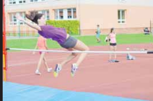
Ženská krása. Když se spojí púvab s pohybem, je to vždy okulahodící podívaná. Přesně tak tomu bylo i při ženské výšce.