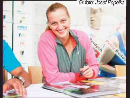
Stále s úsměvem. Petra Kvitová po krátké tenisové exhibici měla stále důvod k radosti i při autogramiádě.