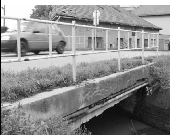
Je v provozu, ale... Most přes mlýnský náhon v Čechovicích je sice v provozu, ale s velkými výhradami.