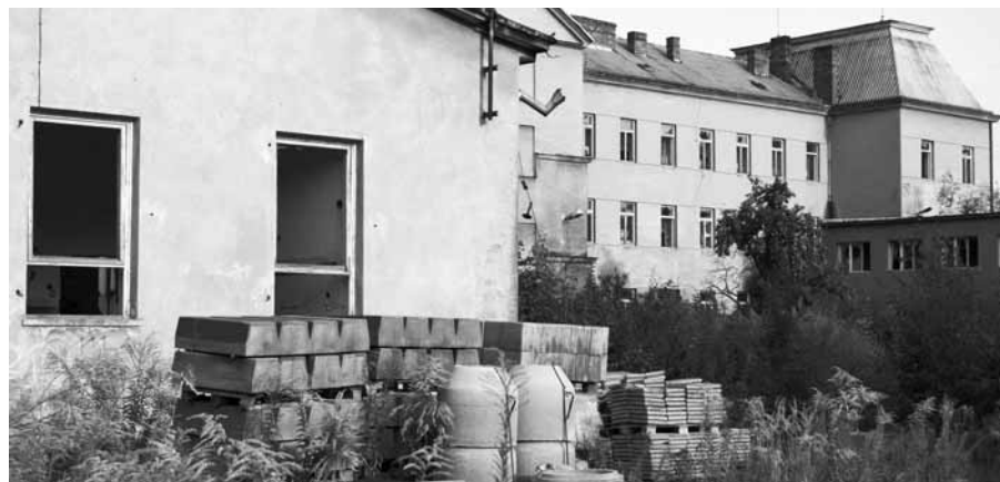
Stále nejasné. Podle radních došlo v prezentaci termínu bourání jezdeckých kasáren k nedorozumění. O osudu chátrající ruiny rozhodne až nové zastupitelstvo.

ještě nějakou dobu hyzditi jižní část Prostějova. Dá se ale předpokládat, že pokud v říjnových komunálních volbách dostanou důvěru současní zástupci vedení města, bude se pokračovat v nastolených plánech. V praxi to znamená, že jezdecká kasárna půjdou k zemi a místo nich s největší pravděpodobností vyroste nové multifunkční centrum jako náhrada za současný Společenský dům. „S tou náhradou bych byl ještě opatrný. Dosud nejsou vyjasněny záměry společnosti Manthellan a tím není jasné ani to, zda se bude bourat starý 'kulturák'. Jak říkám, o tom všem budou rozhodovat až nově zvolení zastupitelé,“ upozornil náměstek primátora. K celé záležitosti se na tiskové konferenci rady města vyjádřil i sám první muž prostějovského magistrátu. „V usnesení rady města je jasné stanoveno, že výběrové řízení bylo vyhlášeno na případnou demolici jezdeckých kasáren. Zdůrazňuji právě slovo případnou! V žádném pří-