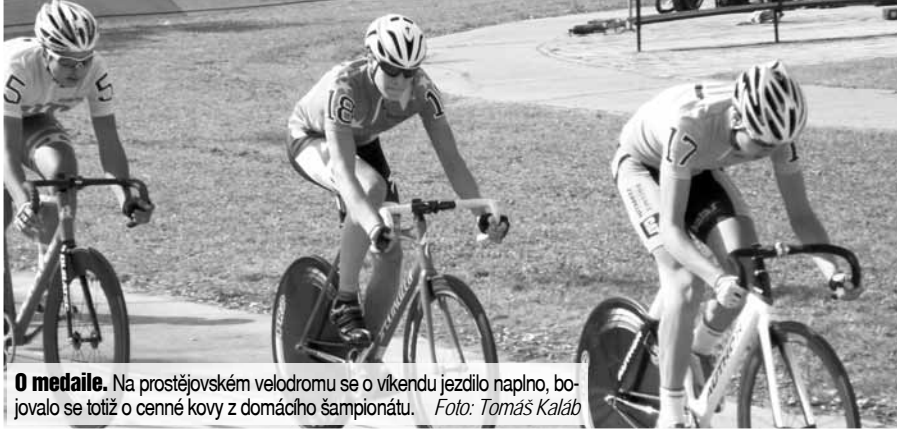
O medaile. Na prostějovském velodromu se o víkendu jezdilo naplno, bojovalo se totiž o cenné kovy z domácího šampionátu.

Prostějov/tok - Předposlední závody této sezóny pořádal místní klub SKC TUFO o minulém víkendu. Jednalo se o republikové mistrovství v takzvaném Madisonu pro kadety, juniory a muže Elite+ „U23“. Madison je poměrně stará cyklistická disciplína, pocházející z USA, její počátky sahají do konce devatenáctého století. Jezdila se v Madison Square Garden, odtud také pochází samotný název. Soutěží v ní dvoučlenné, případně tříčlenné týmy, v letech 2000 až 2008 se jednalo dokonce o olympijskou disciplínu. Doplňme, že kadeti (dorostenci) absolvovali 80 kol, junioři 120 a muži 160. Pořadatelé slibovali napínavou podívanou, hlavní soubor je očekávaný mezi závodníky domácího SKC Tufo a pražskou Duklou. Většinu přihlížejících tvořili rodinní příslušníci závodníků. „Právě v tomto okamžiku probíhá závod juniorů, naši jsou ve vedení,“ sdělil při návštěvě Večerníku vedoucí trenér SCM a zároveň manažer SKC Tufo Michal Mráček. „V závodě kade-