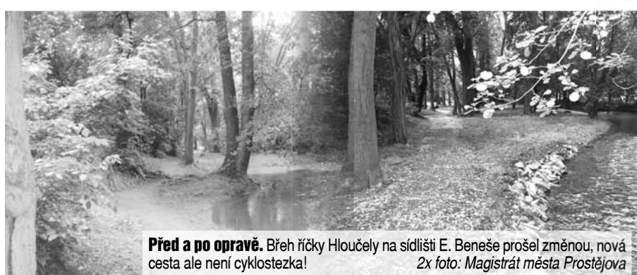
Před a po opravě. Břeh říčky Hloučely na sídlišti E. Beneše prošel změnou, nová cesta ale není cyklostezka!

Prostějov/mik - Před něko- lika týdny skončila úspěšně rekonstrukce březního sý- stému koryta říčky Hlou- čely včetně sousední cesty v prostoru sídliště E. Beneše. A právě tato cesta se sta- la terčem kritiky několika zdejších obyvatel. Město ale namítá, že oprava dříve rozbahněné cesty se nikdy