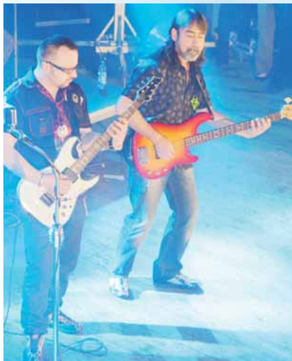
Poprocková legenda. Kapela Turbo zahrála v Lipové za dobu své existence již počtvrté. I tentokrát to byl nářez.