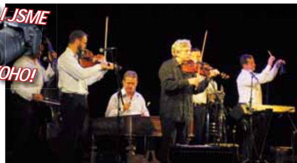
Neskutečně příjemný zážitek. Kapela Hradišťan potěšila známými songy a představila i horké novinky, které diváci ocenili uznalým potleskem.

Kokánek. A že jich nebylo právě málo,“ poděkovala vedoucí prostějovského Fondu ohrožených dětí Regina Šverdíková, která neskrývala dojetí nad štědrostí Prostějovanů, kteří na dostavbu Klokánku přispěli celkem 146 586 korun.