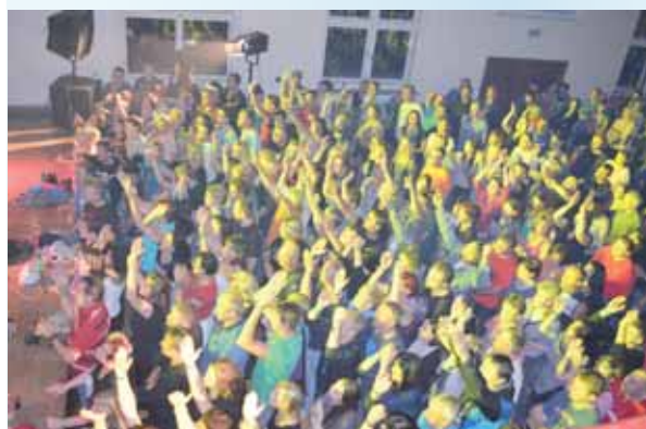
Všichni zpívali. V nabitě sokolovně snad nebyl nikdo, koho by skvělá atmosféra nestrhla a kdo by nezačal zpívat.