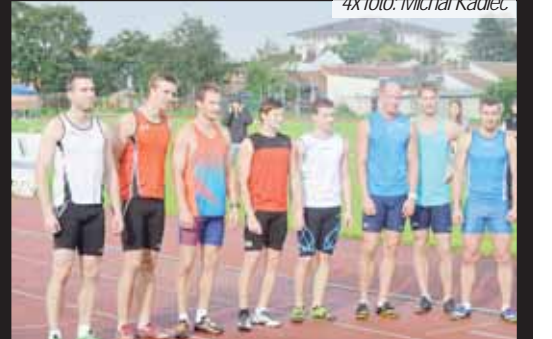
První v historii. Ještě nikdy se při hlavním závodě Velké ceny města Prostějova nenaplnilo osm drah. Až letos.