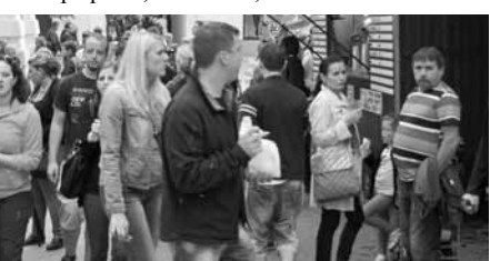
Dost plno. I přes nepřízeň počasí bylo v průběhu hodů na prostějovském náměstí velmi živo, byť se sluníčkem by zřejmě lidí přišlo ještě více.