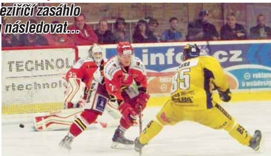
Rozhodnuto. Jestřábi právě inkasují z hole Vávry čtvrtou branku, což jejich snahu o bodování značně otupilo.

Druhý týden ostré sezony a celkem pět prvoligových kol je za námi, situace Jestřábů se ale oproti úvodnímu vstupu příliš nezměnila. Svěřenci trenérů Sršně a Zachara sice odmazali ze svého konta nulu mezi získanými body i počtem výher, stále se však nemohou příliš chytout v koncovce a po porážce v krajském derby zůstávají na chvostu tabulky. Ve středu tak sice v bitvě dvou zatím nejslabších mužstev přetlačili Havlíčkův Brod, proti Šumperku ovšem dvakrát přišli o vedení a nakonec z toho byla již čtvrtá porážka.