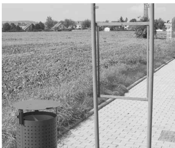
Zastávka u pole. Snad nebude trvat dlouho, a tato očesaná zastávka městské hromadné dopravy bude konečně k užítku.