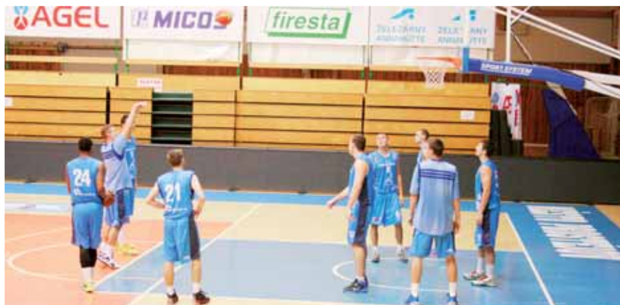
Finišují. Prostějovským basketbalistům vrcholí fáze přípravy a nastává ostrý start do nové sezony basketbalové Mattoni NBL.

Připomeňme, že systém NBL zůstal zachován, hraje se tedy podle stejných notiček jako v minulém ročníku. Základní část čtyřkolově s tím, že Nymburk absolvuje pouze polovinu utkání. Po základní části následuje přímo play-off,