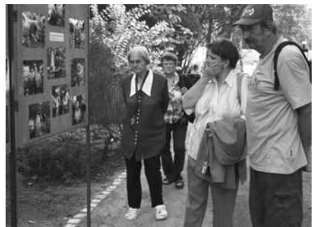
Zajímavá expozice. Na velkých informačních tabulích byly vystaveny například fotografie z činnosti Ekocentra Iris.

Botanickou zahradu Petra Albrechta můžete v tomto období navštívit ve všední dny kromě pondělí od osmi do šesti hodin a v sobotu od deseti do čtyř. Od října pak bude provoz omezen na všední dny od čtvrt na osm do tři čtvrtě na čtyři.