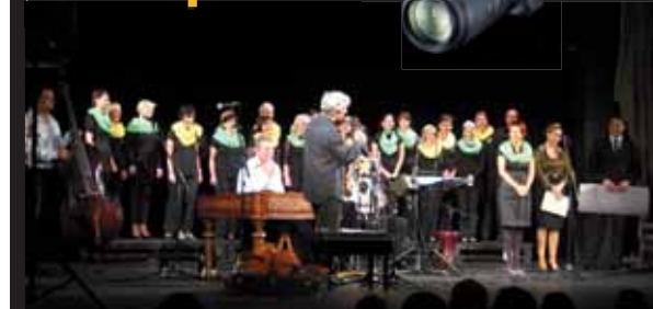
Na pomoc dětem. Úctyhodná částka, kterou se díky štědrým divákům v průběhu koncertu podařilo vybrat, příjemně překvapila účinkující i organizátory akce.