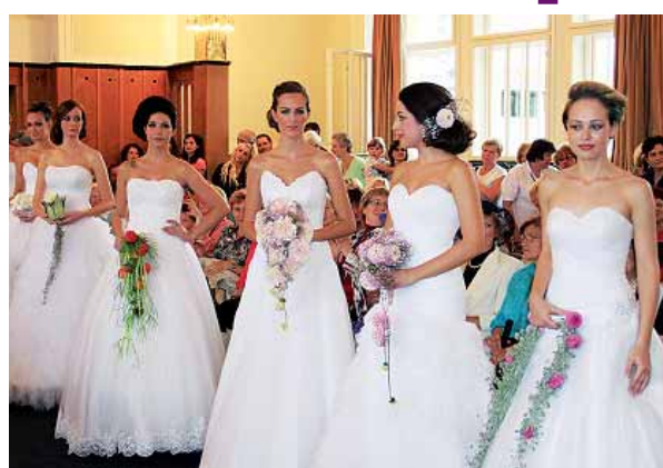
Nevěsty v akci. Již tradiční akcí v Národním domě ozářily i ženy v bílém. Nechcete se při pohledu na ně vdávat?