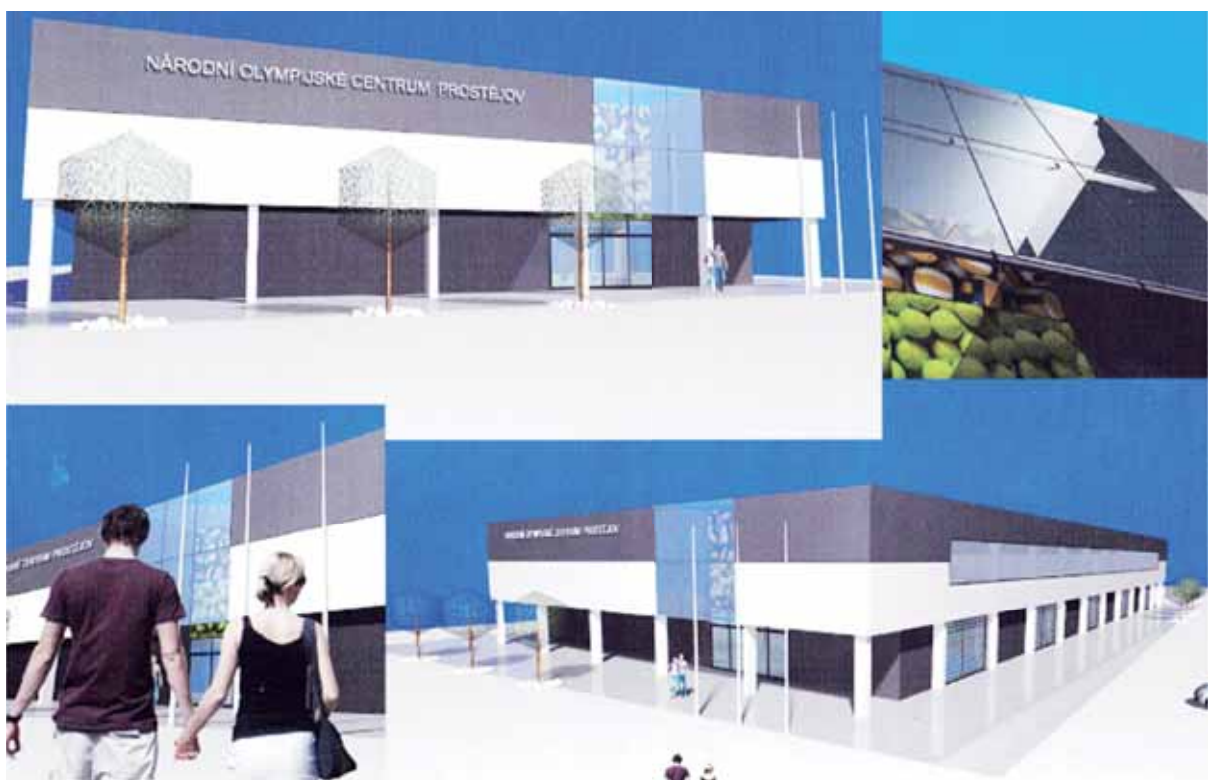
Skvělá zpráva! Čtyři úhly pohledu na vizualizaci nové haly, která vyroste v areálu Za Kosteleckou ulicí. Drtivá většina finančních nákladů bude zajištěna ze státních dotací.