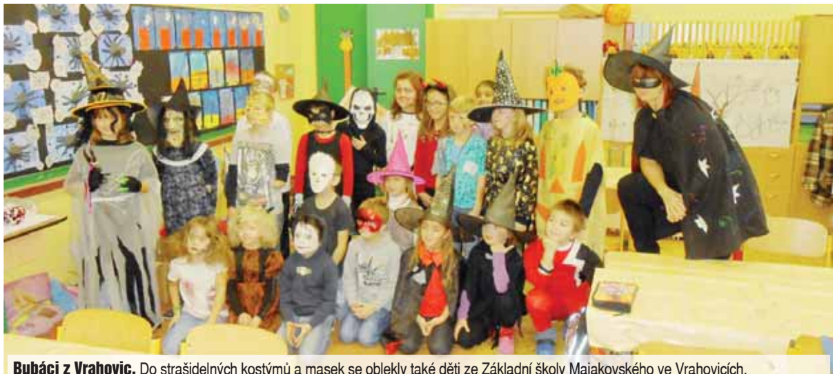
Bubáci z Vrahovic. Do strašidelných kostýmů a masek se oblekly také děti ze Základní školy Majakovského ve Vrahovicích.

tematické dopoledne plné tvořivých činností. Studenti společně s dětmi připravili podzimně-strašidelnou výzdobu tříd i celé školy a při tom si popovídali o starých i nových zvycích, které se poji s tímto obdobím. Na dopolední program navázal podvečerní lampionový průvod rodičů s dětmi v maskách. Vrcholem celé akce pak byla prohlídka strašidelné, dýňami osvětlené školy.