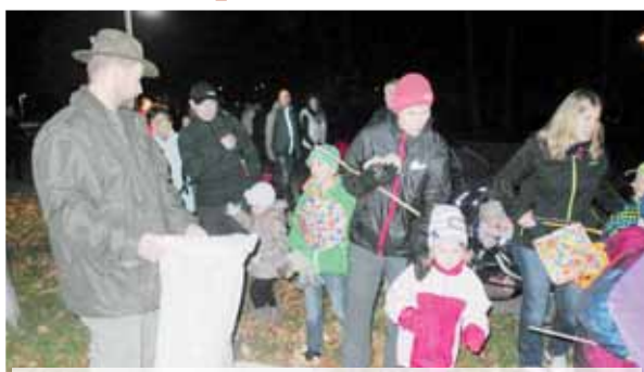
Zima je nepřekvapí. Lesní zvěř si díky lidské dobročinnosti přijde opravdu na své a smlsne si na několika dobrotách.