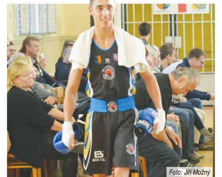
„Jsem v Prostějově spokojen a také atmosféra je zde super. Přišlo hodně lidí, fandí a žijí boxem.“

„Už jim dozráli jejich boxeři a já mám svůj oddíl v Galantě, kde mě připravuje mistr světa i Evropy, s ním se mi velmi dobře spolupracuje.“ •• Když jste loni dobyl titul s Nitrou, je to cílem i nyní na Hané? „Máme na to. První zápas jsme venku vyhráli, teď ve druhém také a navíc hodně vysoko. Uvidíme ale, musíme jít postupně zápas od zápasu. Nicméně je to ale naše práce, musíme makat a udělat pro to maximum. Věřím, že se nám to podaří.“ •• Další extraligový duel máte až v prosinci. Co vás čeká do té doby? „Dostal jsem nabídku z Prahy do německé Bundesligy. Ještě není jisté, že tam půjdu, ale chtěl bych. Byly by to další cenné zkušenosti a těžké zápasy. Očekávám tvrdé souboje, budou tam nejlepší boxeři z celé země, které jsem potkal třeba na Evropských hrách v Baku nebo na mistrovství Evropy. Ale věřím tomu, že to bude úspěšné angažmá.“