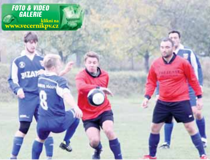
Hosté (v modrém), měli sice míč většinou na svých kopačkách, ale dotěrná černočerná obrana jim dělala značné potíže.

Rozhodovat tak musely pokutové kopy, které jsou vždy velkou loterií. Jako první šli kopat hosté a první tři střelci na obou stranách nezaváhali