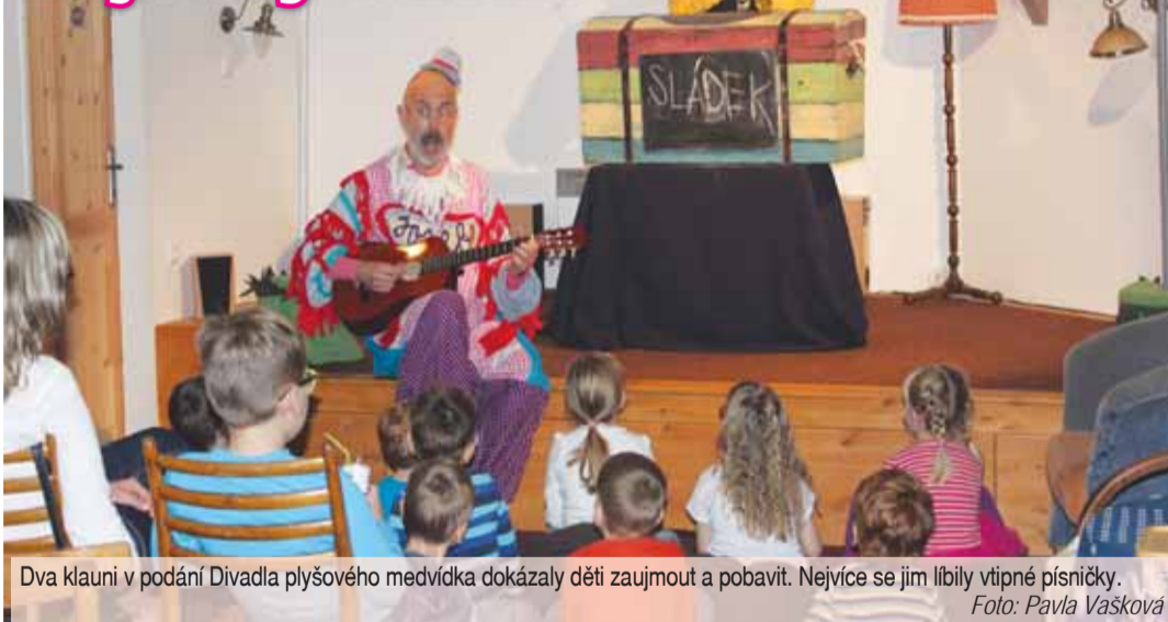
Dva klauni v podání Divadla plyšového medvídky dokázaly děti zaujmout a pobavit. Nejvíce se jim líbily vtipné písničky.

PROSTĚJOV Zábavná podívaná pro děti se včera konala v Čajovně pod pokličkou. Divadlo plyšového medvídky sehrálo v Krasicích poetické pásmo plné básniček a písniček z pera jednoho z nejlepších autorů dětské literatury v české historii Josefa Václava Sládka. Křišťálovou studánku aneb Cirkus Sládek dětské osazenstvo ocenilo hurónským smíchem a velkým potleskem.