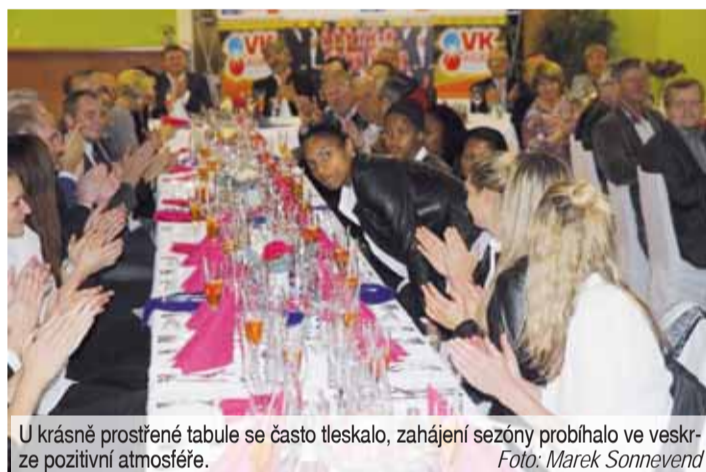
U krásně prostřené tabule se často tleskalo, zahájení sezóny probíhalo ve veskrze pozitivní atmosféře.

Poté už mohli všichni přistoupit ke slavnostnímu přípitku a konzumaci kuchařova kulinařského umění, aby celé setkání uzavřely neformální debaty nejen o nadcházející sezóně ve všeobecně přátelské atmosféře.