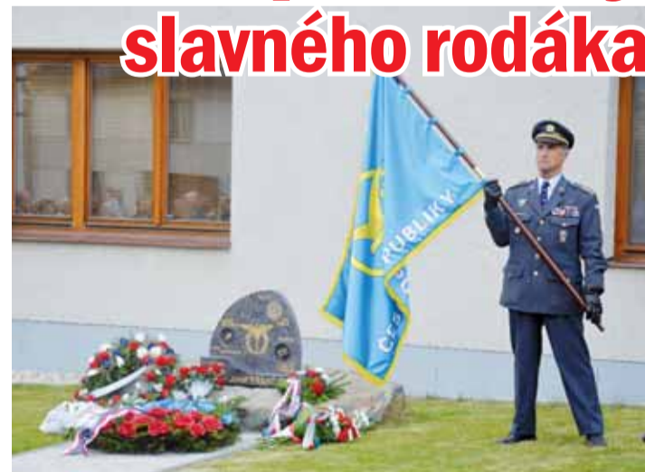
Pietní akt se uskutečnil u pomníku před rodným domem Josefa Františka.

OTASLAVICE Významní rodáci jsou neoddelitelnou částí paměti každé obce. Proto je důležité si je při významných výročních opětovně připomínat. Do dějin Otaslavic se velkým písmem zapsal letec a podle vojenských odborníků nejlepší stíhač druhé světové války Josef František. Oslavy k uctění památky 101. výročí narození a 75. výročí úmrtí otaslavického rodáka odstartovali již v pondělí 5. října dopoledne ukázkovými seskoky parašutisté, příslušníci 102. průzkumného praporu z Prostějova. Jejich bravurní výkony s obdivem sledovali žáci základní školy, která nese jméno právě Josefa Františka.