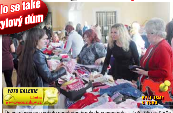
Do sokolovny se v sobotu dopoledne hrnuly davy maminek.

PŮVODNÍ REPORTÁŽ pro Večerník Pavla VAŠKOVÁ