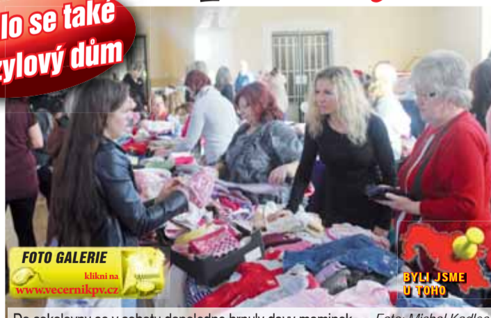
Do sokolovny se v sobotu dopoledne hrnuly davy maminek.

PŮVODNÍ REPORTÁŽ pro Večerník Pavla VAŠKOVÁ