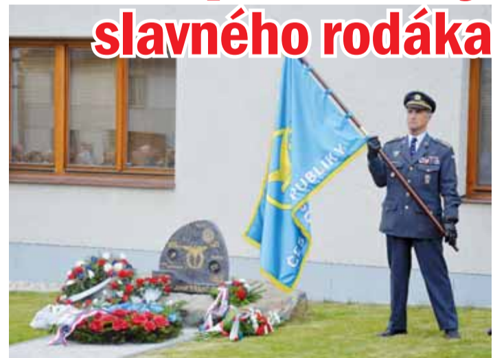
Pietní akt se uskutečnil u pomníku před rodným domem Josefa Františka.

OTASLAVICE Významní rodáci jsou neoddelitelnou částí paměti každé obce. Proto je důležité si je při významných výročních opětovně připomínat. Do dějin Otaslavic se velkým písmem zapsal letec a podle vojenských odborníků nejlepší stíhač druhé světové války Josef František. Oslavy k uctění památky 101. výročí narození a 75. výročí úmrtí otaslavického rodáka odstartovali již v pondělí 5. října dopoledne ukázkovými seskoky parašutisté, příslušníci 102. průzkumného praporu z Prostějova. Jejich bravurní výkony s obdivem sledovali žáci základní školy, která nese jméno právě Josefa Františka.