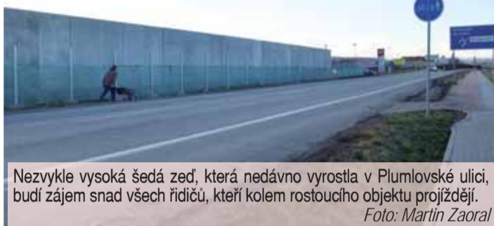
Nezvykle vysoká šedá zeď, která nedávno vyrostla v Plumlovské ulici, budí zájem snad všech řidičů, kteří kolem rostoucího objektu projíždějí.

šedá zeď jednomu z místních podnikatelů i problémy. „Jak byla postavena, okamžitě jsem se rozhodl, že tady po pěti letech končím. Na můj podnik není kvůli zdi ze silnice takřka vůbec vidět, myslím, že by si k nám hledali zákazníci cestu těžko,“ svěřil se Pavel Borovec, který v Plumlovské ulici prodával dřevěné altány, zahradní domky či dětská pískoviště. On sám byl