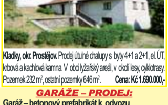
Kladky, okr. Prostějov. Prodej útulné chalupy s byty 4+1 a 2+1, el. UT, krbová a kachlová kamna. V obci lyžařský areál, v okolí lesy, okřídlený. Pozemek 232 m 2 , ostatní pozemky 646 m 2 . Cena: Kč 1.690.000,-

GARÁŽE - PRODEJ: Garáž - betonový prefabrikát k odvozu Kč 32.000,- bez pozemku a bez dopravy BYTY - PRONÁJEM: 1+1, P.v. Síd. Svobody Kč 5.500,-/měsíc vč. inkasa 2+kk, P.v. Plumlovská ul. Kč 7.000/měsíc + ink. (2.000,-) Kompletní nabídku najdete na: www.jhreality.cz