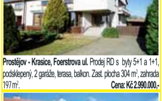
Prostějov - Krasice, Foerstrova ul. Prodej RD s byty 5+1 a 1+1, podskeperný, 2 garáže, terasa, balkon. Zast. plocha 304 m 2 , zahrada 197m 2 . Cena: Kč 2.990.000,-