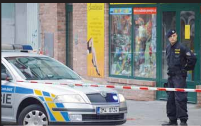
Policisté místo neštěstí v ulici Újezd prověřovali několik hodin, vraždu nyní zcela vyloučili.

Sedmadvacetiletý mladík zemřel v sanítce při převozu do nemocnice na následky mnohačetných poranění. „Než vypadl z okna, slyšela jsem v jeho bytě strašný křik. S někým se tam hádal, zřejmě s mužem, který s ním bydlel. Nahlásila jsem to policii,“ prozradila Večerníku jedna ze sousedek nešťastníka.