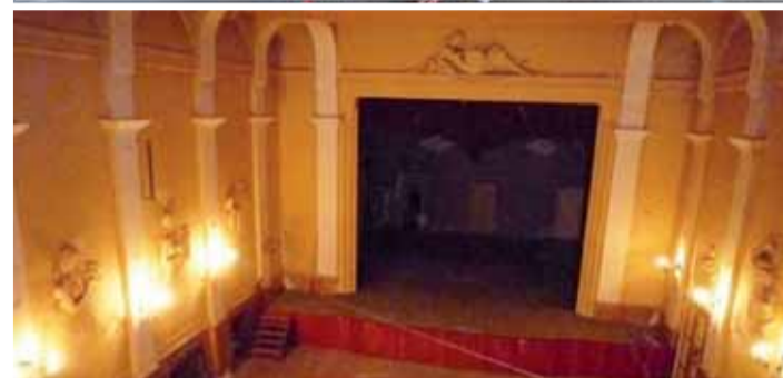
Takto nyní vypadá interiér bývalého závodního klubu OP Prostějov, kde svého času fungoval taneční sál i kino.

V každém případě prostějovský magistrát už o objekt zájem nemá. „V současné době ani v blízké budoucnosti neplánujeme, že bychom dům mohli po koupi a rekonstrukci využívat ke kulturním i společenským účelům,“ potvrdil Večerníkovi Jiří Pospíšil, náměstek primátorky Statutárního města Prostějov.