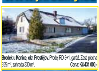
Brodek u Konice, okr. Prostějov. Prodej RD 3+1, garáž. Zast. plocha 355m 2 , zahrada 330m 2 . Cena: Kč 431.000,-