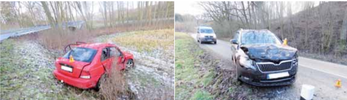
Dvakrát na stejné místo během krátkého časového období jeli policisté vyšetřovat k Laškovu různé dopravní nehody na zledovatělé vozovce.