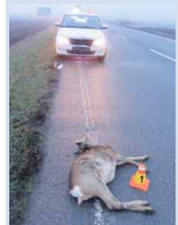
Policistům po příjezdu na místo nehody nezbylo nic jiného, než zavolat mýslivce, aby si pro uhynulou srnu přijeli.