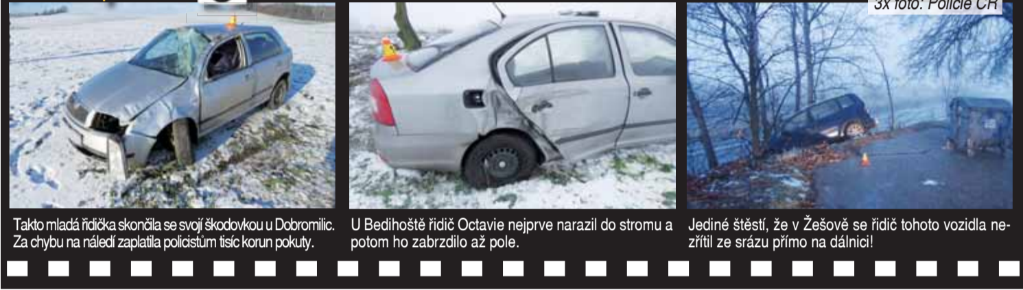
Takto mladá řidička skončila se svojí Škodou v Dobromilicích. Za chybu na náledí zaplatila policistům tisíc korun pokuty. U Bedihošti řidič Octavie nejprve narazil do stromu a potom ho zabrzdlilo až pole. Jediné štěstí, že v Žešově se řidič tohoto vozidla nezříttil ze srážky přímo na dálnici!