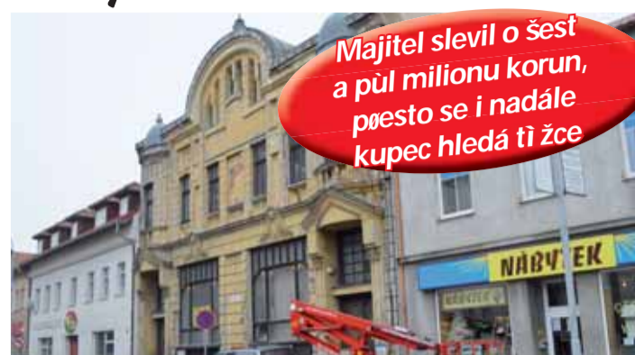
Na „Blešárně“ před nedávem došlo k potřebné opravě střechy, kvůli čemuž byl omezen provoz na Vápenici.