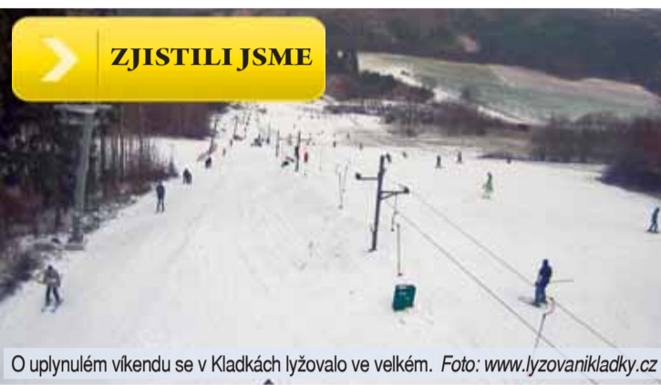
O uplynulém víkendu se v Kladkách lyžovalo ve velkém.