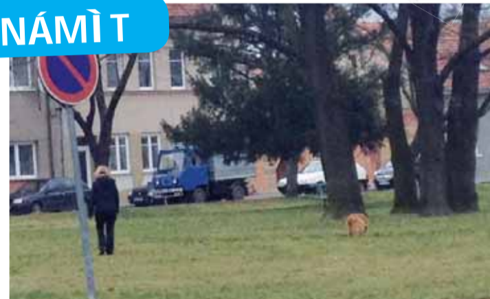
Fotografie zatím neznámé paničky, jejíž vlčák je černou mýrou pro všechny slušné pejskaře na Husově náměstí.

„Když jsem si ve Večerníku přečetla reportáž o napadení velšteriera vlčákem, rozhodla jsem se vám napsat. Celý případ je mi hodně povědomý, před časem se mi totiž stalo to samé na Husově náměstí s mým mopslíkem! Byla to paní středního věku s rezavým vlčákem. Neměla ho vůbec uvázaného a její pes pobíhal po parku na náměstí, pak přiběhl na chodník a vletl na mého mopslíka. Málem jsem svého pejska uškrtla, jak jsem ho bránila. Ten vlčák byl ale