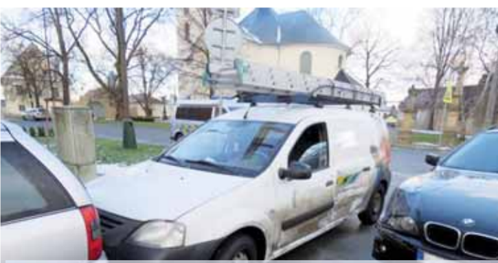
Vůdce havárie při řidiči černého BMW, jehož chyba zapříčinila postupný štouchanec dalších vozidel.

OLŠANY U PROSTĚJOVA Čtyřnásobný „štouchanec” viděli svědci u budovy základní školy v Olšanech. Do kolize se tady dostala čtyři vozidla, z toho dvě byla zaparkovaná a bez řidičů. Kuriozní nehoda se bohužel neobešla bez zranění... „V úterý dvanáctého ledna v osm hodin ráno došlo v blízkosti základní školy v Olšanech u Prostějova k dopravní nehodě s účastí čtyř vozidel. Devětatřicetiletý řidič automobilu značky BMW při jízdě směrem z centra obce předjížděl vozidlo značky Dacia. „Hmotná škoda na vozidlech BMW, Dacia a Opel byla předběžně vyčíslena na sto sedmdesát tisíc korun. Vozidlo Kia poškozeno nebylo.