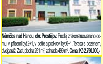
Němčice nad Hanou, okr. Prostějov. Prodej zrekonstruovaného domu, v přízemí byt 2+1, v patře a podkrovní byt 6+1. Terasa s bazénem, dvůrgaráž. Zast. plocha 251 m 2 , zahrada 498 m 2 . Cena: Kč 2.790.000,-