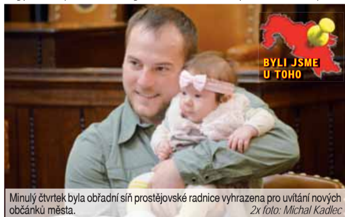
Minulý čtvrtek byla obřadní síň prostějovské radnice vyhrazena pro uvítání nových občánků města.

Další vítání občánků Prostějova je v obřadní síni radnice naplánováno na první únorový týden.