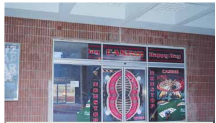
Dvě bývalé kasina na hlavním nádraží v Prostějově zůstávají stále uzavřené. A podle všeho to tak ještě dlouho zůstane...

Jak se tedy zdá, je pouze otázkou času, kdy dojde k tolik obávanému spojení veřejné dopravy s hazardem... (mik)