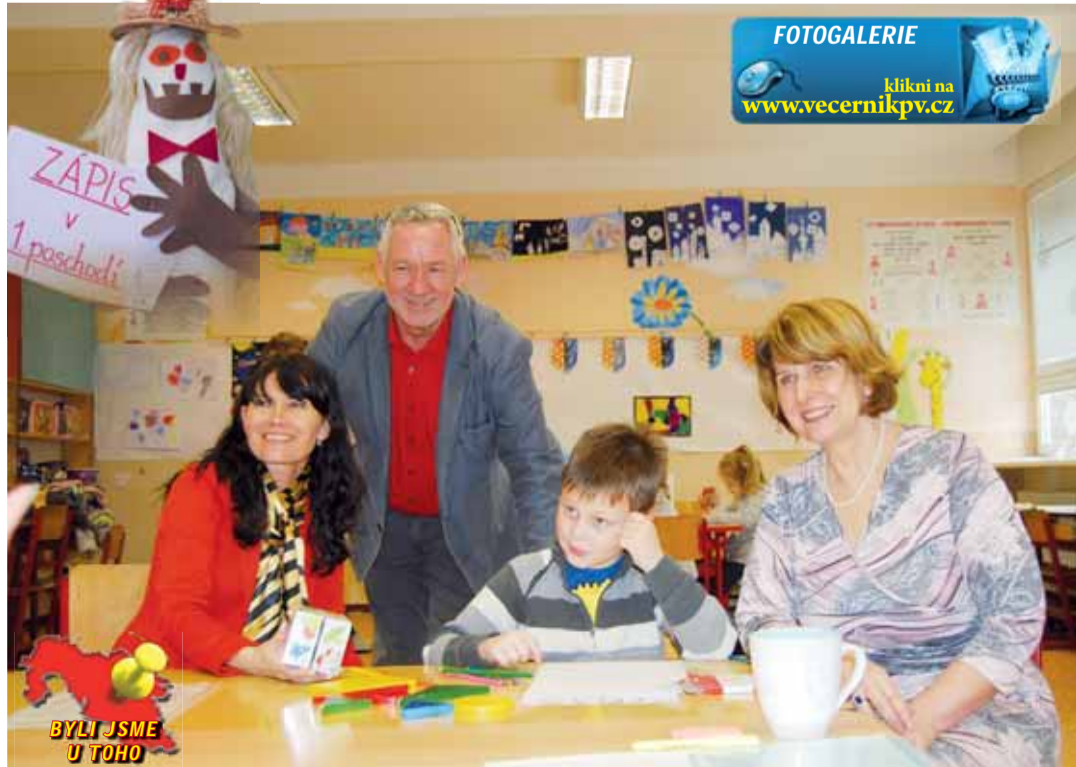
Páteční zápisy budoucích prvňáčků do základních škol v Prostějově potvrdily, že populační boom je dávno pryč. Letos se přišlo zapsat méně malých školáků než vloni, nicméně i tak bude v prvňáckých třídách od září dětí jako smetí. Více si přečtete na straně 8