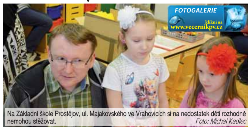
Na Základní škole Prostějov, ul. Majakovského ve Vrahovicích si na nedostatek dětí rozhodně nemohou stěžovat.

VRAHOVICE Roztomilá atmosféra panovala uplynulý pátek na Základní škole Prostějov, ul. Majakovského ve Vrahovicích. Také tady pro své budoucí prvňáčky připravili při zápisích doslova pohádkové prostředí.