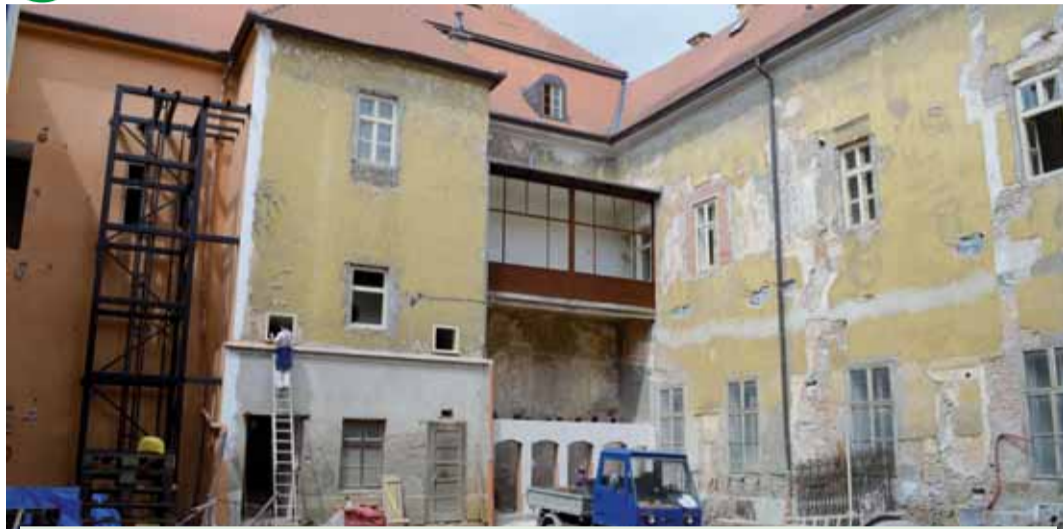
Za posledních sedm let se do prostějovského zámku investovalo už přes sto milionů korun. Další investice ze strany magistrátu budou pokračovat.

PROSTĚJOV V roce 1996 dostala prostějovská radnice nečekaný „dáreček“, když stát převedl do vlastnictví města chátrající zámek na Pernštýnském náměstí. Už tehdy se mluvilo o takzvaném „danajském daru“.