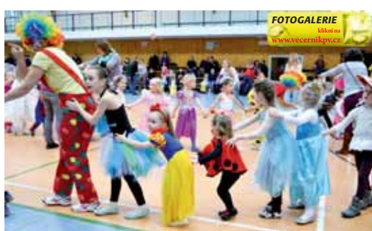
Děti se v Kostelci rozhodně nenudíly.

Velký prostor sváděly děti ke sportovním aktivitám. V rámci soutěží prošly překážkovou dráhu, házely míči i létajícími talíři nebo skákaly v pytlích. S klauny pak tancovaly, stavěly komíny z kostek nebo házely drátěnkami. Karneval obohatilo i vystoupení dětí z mateřské školky v Kostelci na Hané „Hody hody doprovody“ a rozleškávaček z Prostějova s názvem „The cheers“. O zábavu nepřišli ani rodiče, kteří se také zapojili do soutěží. V rodinném klání bylo možné vyhrát živé morčátko, zákusky či ovocné balíčky. Nechyběla ani velká tombola, ve které bylo přes dvě stovky cen. A ani ti, kteří přece jen neměli štěstí v tombole, neodcházeli s prázdnou. „Rozdávala se spousta sladkostí i drobných odměn. Hudbou provázal Petr Petřík. Všem pořadatelům a sponzorům moc děkujeme,“ vzkázal za pořadatele Petr Kudláček. (zv)