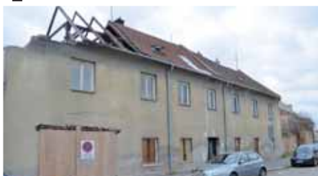
Dům na Vodní ulici i dva roky po svém prodeji zůstává v katastrofálním stavu. Čím dříve půjde k zemi, tím lépe pro celou oblast nacházející se nedaleko centra města.

Nový majitel se od samotného počátku netajil svým záměrem objekt zbourat. Zavázal se, že tak učiní nepozději do čtyřiceti měsíců. Více jak polovina