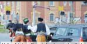
VEČERNÍK BYL U VELIKONOČNÍHO PŘEPADENÍ V PŘÍMÉM PŘENOSU. ČLENOVÉ SOUBORU KLAS VYMRSKALI VŠE, CO MĚLO SUKNI. I ZA VOLANTEM...

PROSTĚJOV Od podlahy vzali velikonoční mrškačku členové folklorního souboru Klas z Kralic na Hané, kteří se vydali do Prostějova na zebříňáku taženém dvěma nádhernými valachy. Večerník je nachytil ve Vrahovicích, kde u železničního přejezdu krojovali mrškači zpisobíli pozdvižení... Poklidnou jízdu napříč Vrahovicemi přerušili „klásci“ přímo na kolejkách. Za bujarého veselí vyskočili čtyři krojovali mládenci z zebříňáku. Za nimi se totiž objevila krásná řidička, která u přejezdu zastavila. A to neměla dělat! Členové souboru Klas ženu doslova zaskočili, když otevřeli přední dveře a mladé slečny za volantem naložili, co se do ní vešlo.