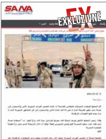
Zpráva agentury SANA v arabštině.

Připomeňme, že symbolicky na Velikonoční neděli bylo po necelému roce toto historické město zapsané na seznamu památek UNESCO osvobozeno vládními silami od teroristů z takzvaného Islámského státu, kteří stáli napáchat na světovém kulturním dědictví značné škody. Na jejich zmínění bude spolupracovat UNESCO, syrská vláda a Rusko.