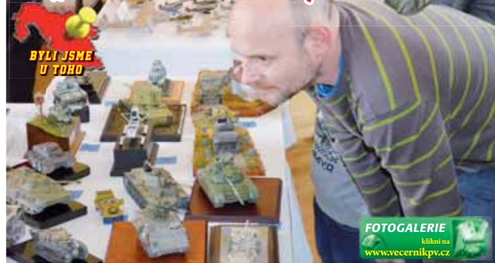
Pečlivě poskládané modely letadel, tanků, lodí i motorek si se zájmem prohlédli početní návštěvníci.

PROSTĚJOV Na Velký pátek bylo pořádně živo ve velkém přednáškovém sále Národního domu. Do Prostějova se seje desítky modelářů z celé České republiky. Hanácký klub plastických modelářů totiž uspořádal v pořadí již 41. ročník výstavy modelů s bodovací soutěží. Akce měla přílehlavý název Velikonoční Prostějov. (mik)