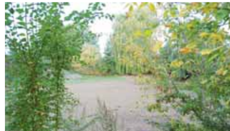
Doposud připomíná rybník v Žešově jámu plnou páchnoucího bahna. Brzy se to má ale změnit.

Když pak Večerník na prostějovské radnici sondařoval, zda magis-