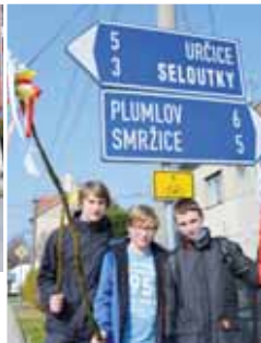
MLADÍ CHLAPCI V DOMAMYSLÍČÍCH JAKOBY SE ZROVNA ROZMYŠLELI, KUDY SE VYDAJÍ ZA VELIKONOČNÍ POMLÁZKU...