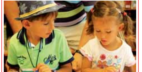
Vyrábět motýly šlo dětem od ruky.

o prázdninách děláva Cuentacuentos (předčítání pohádek - pozvrad), to se děláva velmi často,“ prozradil Večerníku Roman, jeden z tatínků, který pochází z maleho městečka ve Španělsku. Vě čtvrtek v poledne se opět soutěžilo v rámci Pizza kvz, na který tentokrát zavítalo deset dětí, aby předvedly své znalosti a dovednosti a vysloužily si za ně skvělou pizzu. Přesně v pravé poledne se otevřely dveře a všichni se netrpělivě nahmuli domů. Hned, co děti obdržely zadání, pustily se do řešení. Kvíz byl inspirován olympijskými hrami a děti se v tajence dozvěděly, odkud pochází a podle čeho dostaly svůj název. Pravidlo nejrychlejší vyhrává tentokrát neplatilo. Dokonce i ten poslední si odnesl chutnou výhru. „Mně se to moc líbí. Já už dvakrát vyhrála, ale chodím dál, protože mě to baví. Jen je škoda, že už prázdniny končí,“ rekla jedna ze soutěžících.