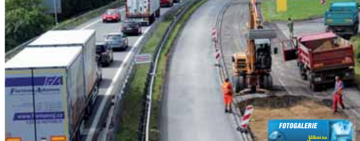
FOTOGALERIE Líbá se na www.vecernikpv.cz