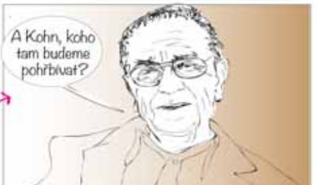
Rehabilitaci hřbitova si máš každý vykládat po svém.