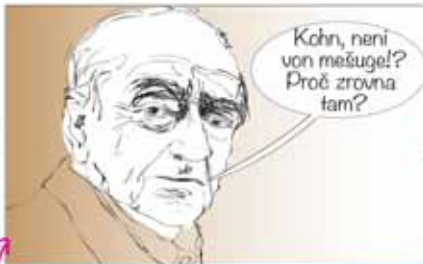
„Kterým židům nápad na obnovu dávno zrušeného hřbitova nepříjde úplně kofer.“