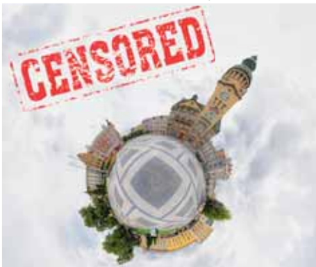
Facebooková komunita „Drby Prostějova“ přinášela „zaručené zprávy“ z planety Prostějov. Nyní tomu má být útrniti!

Za jednu jízdu se stále platí dvacet korun, zájemci ji však musí ohlásit den předem. „Senior taxi je v rámci města Prostějova může zavést do nemocnice, k lékaři, na úřad, na hřbitov, na hlavní náměstí, na poštu