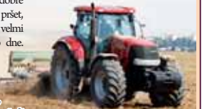
Na polích v těsné blízkosti města Státek Prostějov hnojí jednou do roka. Okamžitě po hnojení zde začaly jezdit traktory, které hnojivo zapravovaly do půdy.