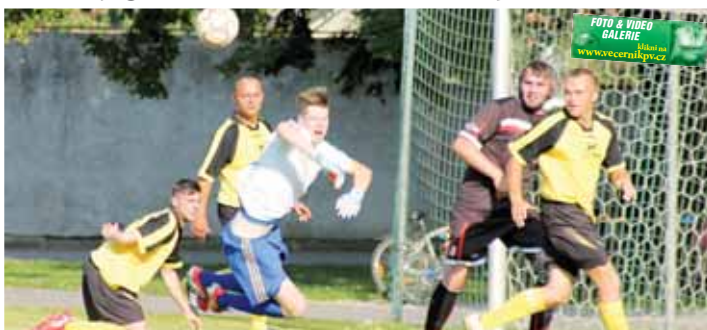
Na rozdíl od hráčů Otaslavic (ve žlutém) se domácí borci nebáli jít do předbrankové mýlnice.