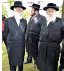
Ortodoxním Židům z USA nestačí současný památník v parku ve Studentské ulici, chtějí mnohem víc...

došlo ohledně bývalého židovského hřbitova ve Studentské ulici k nečekanému souznění. Nedávna společná diskuze totiž přinesla první shodu! Podle předsedy Večerníku primátorka Alena Rašková tak trošku couvla a přistoupila na některé židovské návrhy... Proč?