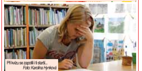
Při kvízové soutěži se zapojili i ti starší.