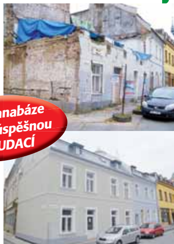
Staré židovské domy na konci roku 2010 a dnes. Rozdíly je viditelný na první pohled.

Podařilo se, práce byly zahájeny a dobrých šestatřicet měsíců se makalo ostošete. I když někdy to nešlo tak rychle, jak by si leckdo představoval. Stavbaři totiž museli sebestenší