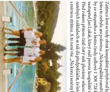
O bezproblémový provoz na koupališti se starali také dva plováci a dvě vedoucí směn.

STRÁŽISKO Pod belem, „zchlad se“ vstoupilo do letošní sezony koupaliště ve Stražištku. Počasí se však bylo staralo o ochlazení a předložem rekordem ročníkem zanífilia na plavárnu jen zhruba