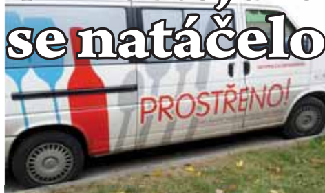
Dotávka s typickým logem oblíbeného pořadu o vaření parkovala uplynulou středu v České ulici.