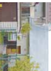
o tomto nenápadně vylíženém domě ve Lhotě pod Kosířem došlo minulý úterý k vraždě.