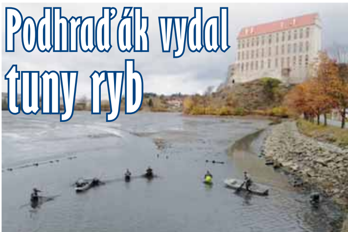
Tradiční panorama Podhradského rybníka ozivilo během středy a čtvrtky rybaři na loďkách.