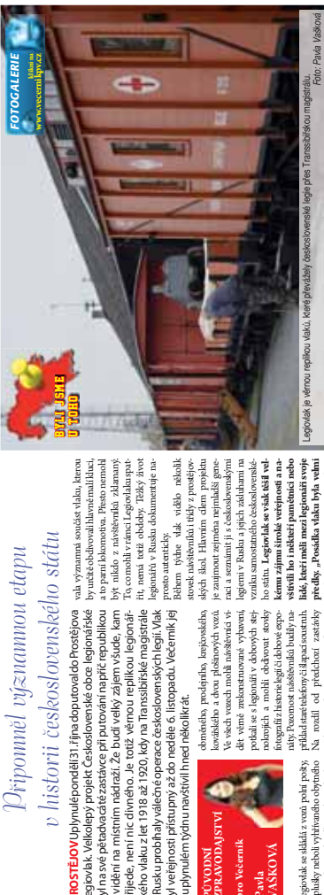
Legiovlak je věrnou replikou vlaku, který převáživě destitovaných legnů přes Transborder migraci. Foto: Pavel Jabloňák

Připomněl významnou etapu v historii československého státu PROSTĚJOV. Uplynulý pondělí 31. října doputoval do Prostějova legiovlak. Velikolepý projekt Československé obce legionářské byl na své páté zastávce při putování napříč republikou v rámci místního nadraží. Ze budí velkým zájmem, kam přijede, není nic divného. Je totiž věrnou replikou legionářského vlaku z let 1918 až 1920, kdy na Transborder migraci v Rusku probíhalo velké evakuace československých legií. Vlak byl v letech 2015 až do neděle 6. listopadu. Večerem jej vypulím týdnůrnávisťmi několikrát. Legiovlak je věrnou replikou vlaku, který převáživě destitovaných legnů přes Transborder migraci. Foto: Pavel Jabloňák Legiovlak je věrnou replikou vlaku, který převáživě destitovaných legnů přes Transborder migraci. Foto: Pavel Jabloňák