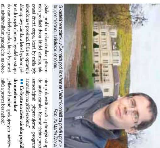
Skasířelém zámku v Čechách pod Kosířem se Vestechniky ohlídel za právě uplynulou premiérovou turistickou sezónou...

areal navštívilo několik tisíc lidí. Poč je sem se balí, pesť si k nám lidé najdou cestu také po zbytek roku. Asiák at už to bylo propagaci, novými expozicemi, akcemi v zámeckém parku, nebo shodou okolností, lidé přišli mnohem více, než se čekalo. Takže rozhodně převládá spokojenost.“ ●● Koflík lidí zámek v Čechách celkově navštívilo? ●● Kam pojedete v zimě? ●● Co byste na závěr zámku popřál do nového mlá? ●● Hlavně hodně spokojených návštěvníků a provoz bez nehod.“