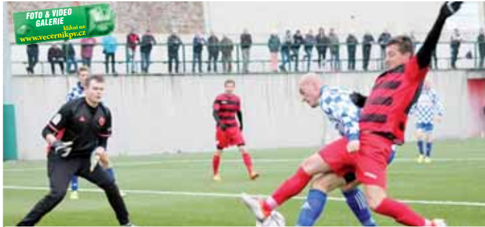
Domáci (v červeném) se snažili aktivitou rozvrátit defenzivní val soupeře, ale ten odolal.