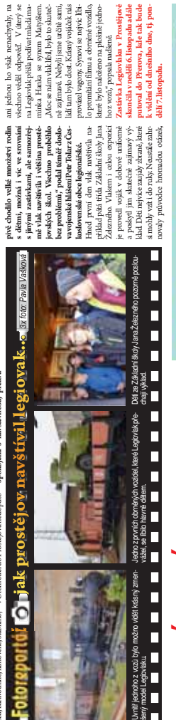
Legiovlak je věrnou replikou vlaku, který převáživě destitovaných legnů přes Transborder migraci. Foto: Pavel Jabloňák

Připomněl významnou etapu v historii československého státu PROSTĚJOV. Uplynulý pondělí 31. října doputoval do Prostějova legiovlak. Velikolepý projekt Československé obce legionářské byl na své páté zastávce při putování napříč republikou v rámci místního nadraží. Ze budí velkým zájmem, kam přijede, není nic divného. Je totiž věrnou replikou legionářského vlaku z let 1918 až 1920, kdy na Transborder migraci v Rusku probíhalo velké evakuace československých legií. Vlak byl v letech 2015 až do neděle 6. listopadu. Večerem jej vypulím týdnůrnávisťmi několikrát. Legiovlak je věrnou replikou vlaku, který převáživě destitovaných legnů přes Transborder migraci. Foto: Pavel Jabloňák Legiovlak je věrnou replikou vlaku, který převáživě destitovaných legnů přes Transborder migraci. Foto: Pavel Jabloňák