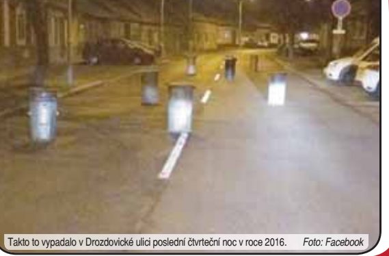
Takto vypadalo v Drozdovické ulici poslední čtvrteční noc v roce 2016.

V diskusi na facebookové skupině Prostějov bez cenzury někteří uživatelé kritizovali i autora snímku, že místo jejich fotografování popelnic raději neuklidil. „Nejsem za to placený. A navíc se to dalo projet,“ reagoval dotyčný s úsměvem.