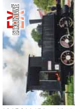
V Hrázské lokomotivě v blízkosti zastávky v Prostějově. Zastávka je v současnosti uzavřena, protože mašinka je v provozu.

PROSTĚJOV Někdy v minulosti v tomto městě stála mašinka před nádražím. Mašinka je v provozu, protože mašinka je v provozu. Mašinka je v provozu, protože mašinka je v provozu. Mašinka je v provozu, protože mašinka je v provozu.