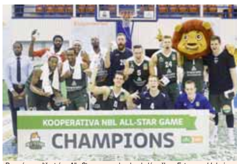
Poprvé se z vítězství na All-Star game radovaly mladé pušky.