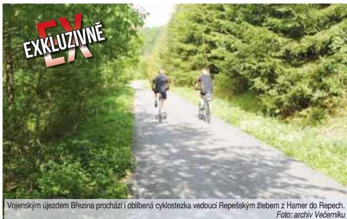
Vojenským újezdem Březina prochází i oblíbená cyklostezka vedoucí Repešským žlebem z Hamer do Repech.

Armáda přistoupila k úplnému uzavření Vojenského újezdu Březina pro civilisty poté, co byl zrušen Vojenský újezd v Brdech. „Jde nám především o bezpečnost občanů a ostatně i cvičících vojáků. V současné době také dochází k zvýšenému náboru nových vojáků z povolání a aktivních záloh a s tím je také spojen intenzivnější výcvik. Navíc se přistupuje k postupnému zmen-