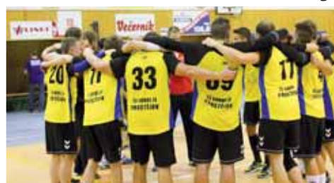
Pomyslným králem regionu se stali házenkáři Prostějova, kteří takhle slavili po derby v Kostelci na Haně.