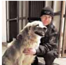
Strážníci odchytili huňáče až na druhý pokus. Majitel dostal pokutu, snad se konečně poučí.

autem v Olomoucké ulici. Stačila jsem ale včas zabrzdit a zvíře odběhlo zpátky na chodník“, sdělila nám svědkyně. „Za porušení zákona na ochranu zvířat proti týrání byla majiteli psa udělena bloková pokuta. Ta může dosáhnout částky až pět tisíc korun“, zareagovala Jana Adámková. Bude to ale stačit? (mik)