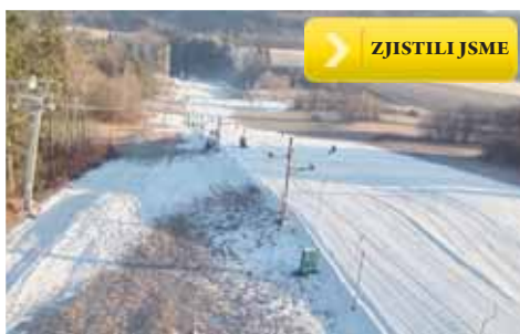
Přestože uplynulý pátek v Kladkách panovalo krásné chladné a slunečné počasí, lyžaři ve frontě nestáli déle jak pět minut.