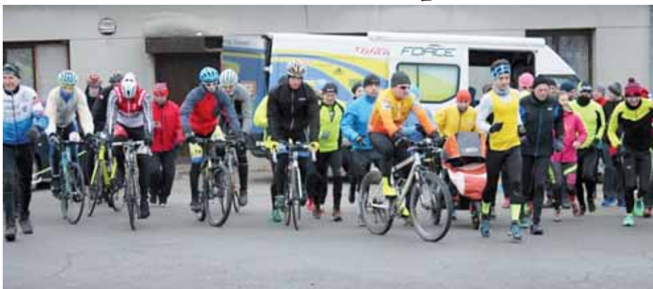
Společný start všech kategorií je tradicí.

Vstříc vrcholu se patron podniky vydal společně se světovým šampionem Vladimírem Vač-