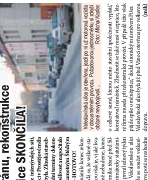
Postavte slavnobránu, rekonstrukce Veselavské ulice SKONČILA! Rekonstrukce ulice je v plném proudu.

PROSTĚJOV Velikým nočním střešním požárem v noci z 29. prosince 2016, v prostoru bývalé továrny, se zranilo tři lidé, včetně policisty. Požár vznikl v prostoru bývalé továrny, se zranilo tři lidé, včetně policisty. Požár vznikl v prostoru bývalé továrny, se zranilo tři lidé, včetně policisty.