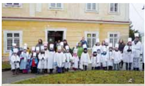
Malí koledníci budou opět vybírat peníze pro dobrou věc.

Iv prostějovském děkanátu se bude koleдовать zejména v sobotu 7. ledna, požehnání koledníků dostanou po dopolední mši svaté v prostějovském hlavním kostele a to jak v pátek, tak i v sobotu.