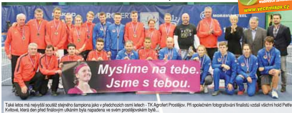
Také letos má nejvyšší soutěž stejného šampiona jako v předchozích osmi letech - TK Agrofert Prostějov. Při společném fotografování finalistů vzdali všichni hold Petře Kvitové, která den před finálovým utkáním byla napadena ve svém prostějovském bytě...

Obhajobou trenéři, kapitáni i hráči naplnili cíl klubového vedení. To se netajilo, že jediné další zlato bude považovat za úspěch. „Předchozí úspěchy zavazují. Chtěli jsme dostat jména, které u nás máme a to se povedlo,” těší bývalou tenistku, která také s klubem slavila extraligové úspěchy.