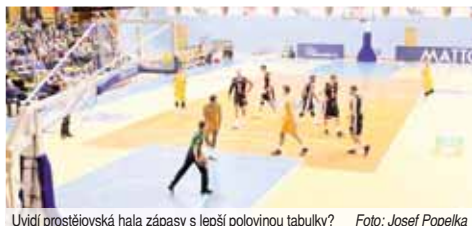
Uvidí prostějovská hala zápasy s lepší polovinou tabulky?

PROSTĚJOV Pět kol před koncem základní části nejvyšší basketbalové soutěže se ještě více dramatičtěji situace v polovině tabulky Kooperativa NBL. Čtyři týmy bojují o dvě volné místa v nadstavbové skupině A1, do které míří Nymburk, Pardubice, Děčín a Kolín. „Už to tak bude. Tato čtveřice si už postup nenechá vzít. Rozdáme si to s Opavou, USK Praha a Ústím nad Labem,“ uznává reálnou situaci Petr Frdrich, generální manažer prostějovských Orůlů.