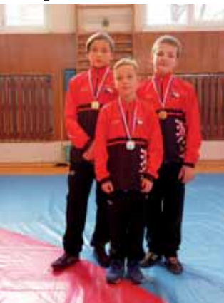
V Ostravě čechovičtí trio kralovalo, dále šlo i lejíjem parťákům v Kránské Lípě.