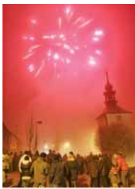
Zhruba desetiminutový silvestrovský ohňostroj u zvoníků v Lešanech byl doprovázen reprodukcí hudbou.

Tradiční silvestrovských ohňostrojů založili v Lešanech před rokem. Pořádá ji obec a tak nebylo divu, že punč zdarma místním rozlévali zdejší zastupitelé. K zakousnutí pak byly připraveny klobásky. Celé přibližně hodinové setkání zakončil v šest hodin asi desetiminutový ohňostroj, na který dohlíželi místní hasiči. „Bylo to příjemné, bude-li to jen trochu možné, příští rok rádi přijdeme zase,“ okomentoval akci jeden z místních. (mls)