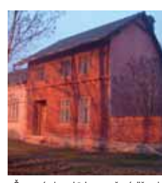
„Červený domek“ je uzavřený již od roku 2005 a podle toho také vypadá...

KOSTELEČ NA HANÉ Je to již více jak deset let, co byl pro veřejnost uzavřen červený domek v Kostelci na Hané. Do roku 2005 zde fungoval Památník Petra Bezruče. Autor Slezských písní zde totiž strávil poslední roky svého života. To však nebyl pádný důvod, aby se sem hrnuly davы. Červený domek nakonec zůstal opuštěný stejně, jako býval jeho dávný obyvatel. Zatímco některým lidem samota vyhovuje, domům určitě nesvědčí.