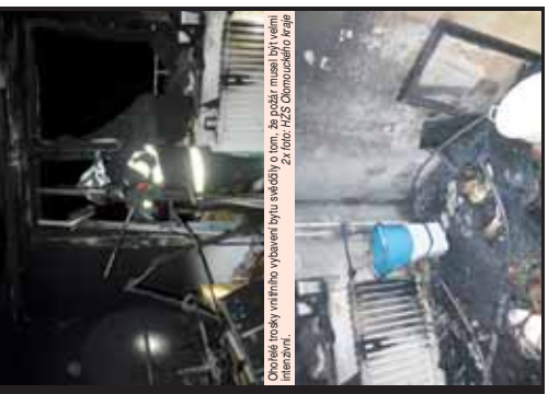
Ohrožené trosky vnitřního výtahu byly zvedány do výšky. Za požár musel být velmi intenzivně.

PROSTĚJOV Velikým nočním střešním požárem v noci z 29. prosince 2016, v prostoru bývalé továrny, se zranilo tři lidé, včetně policisty. Požár vznikl v prostoru bývalé továrny, se zranilo tři lidé, včetně policisty. Požár vznikl v prostoru bývalé továrny, se zranilo tři lidé, včetně policisty.