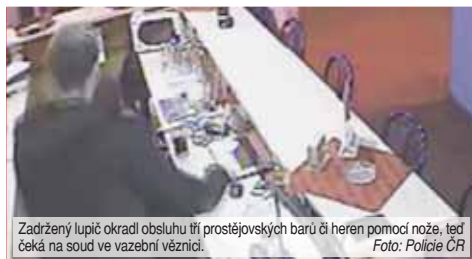
Zadržení lupiči okradl obsluhu tří prostějovských barů či heren pomocí nože, teď čeká na soud ve vazební věznici.

směrem k ulici Újezd pronásledovaný pachatel peněženku i s hotovostí z hodil, ale podařilo se mu utéct“, uvedl tiskový mluvčí prostějovské policie. O dvě hodiny později se lupič zastavil v Plumlovské ulici. „Také zde servírka pod pohrůzkou nožem ze strachu vydala finanční hotovost. V tomto případě šlo o částku přesahující osm tisíc korun. Pachatel z místa činu opět utekl“, konstatoval Kořínek. Připadem se již od prvního skutku zabývali prostějovští kriminalisté. „Pachatele se policištům za vydatné pomoci pracovníka ostrahy baru podařilo zadržet v baru v Krasické ulici v Prostějově, nedlouho po poslední loupeži. Provedeným šetřením a na základě zajištěných stop a zjištěných poznatků se kriminalistům ještě týž den podařilo prokázat, že zadržený jedenadvacetiletý muž se dopustil všech tří uvedených loupežných