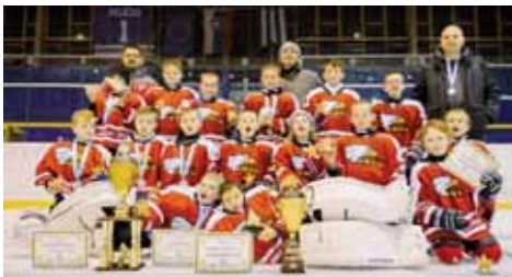
Veleúspěšná výprava hokejistů SK Prostějov 1913 v Dubnici nad Váhom.