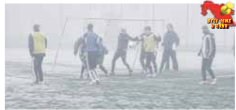
V závěru zápasu bylo před branou hodně rušno.