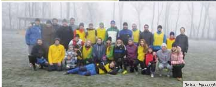
3x foto: Facebook