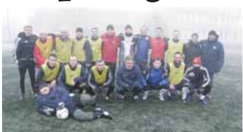
Dvacítka spokojených akterů.