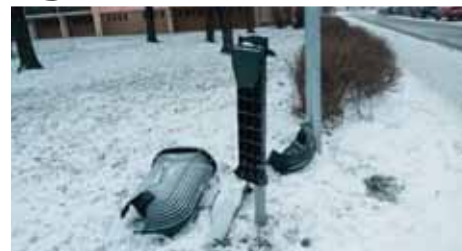
Také letos město počítalo škody po novoročních oslavách. Nejvíce to opět odnesly odpadkové koše.

Vandalové řádí v Prostějově během celého roku, ovšem nikdy v historii města nebyli jejich „nájezdy“ tak ničivé jako v prvních hodinách nového roku 2016. „Zdá se to neuvěřitelné, a věřit jsem tomu nechci ani já. Když jsem ale viděl všechny fotografie, nechápavě jsem kroutil hlavou. Během několika málo hodin vandalové rozkopali nebo jinak zničili pětadesát odpadkových košů z umělé hmoty. A to v nejrušnějších lokalitách města. Škoda přesáhla sto padesát tisíc korun,“ spočítal koncem ledna loňského roku škody napáchané během silvestrovských a novoročních oslav