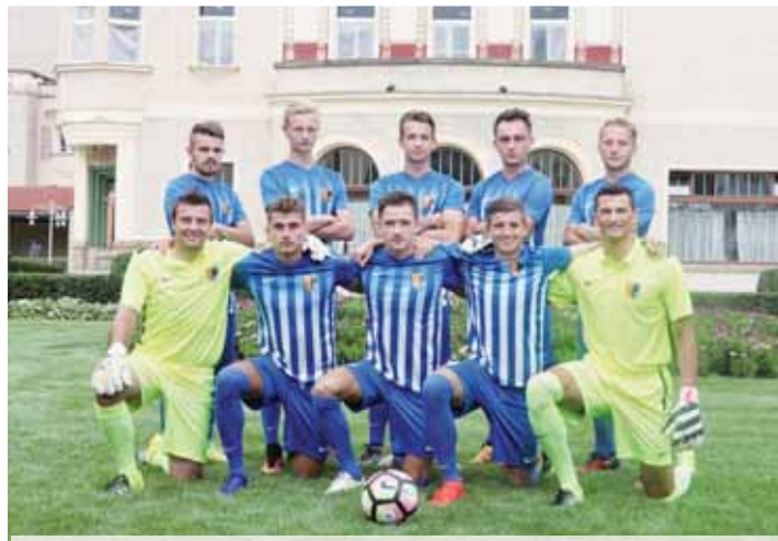
Druholigový kádr fotbalistů 1.SK Prostějov se odchovanci jen hemží.

Kádr až do loňského ročníku pravidelného účastníka Ligy mistrů se skládá převážně ze zahraničních hráček a ostrilých českých reprezentantek. V takové konkurenci se vlastní odchovankyně při aktuálním stavu českého volejbalu mohou jen těžko prosadit. V posledních sezónách však sbíraly mladé Agelky medaile mezi juniorkami a kadetkami, takže se zdá, že o budouc-