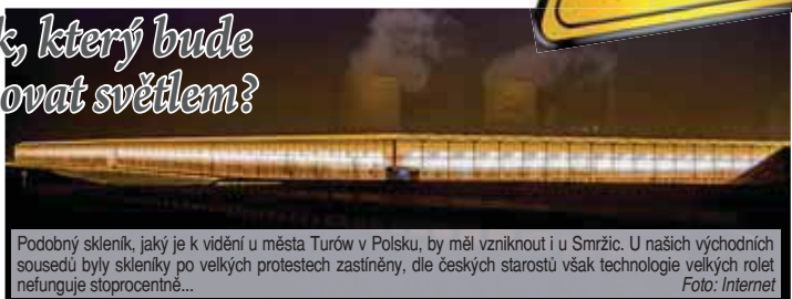
Podobný skleník, jaký je k vidění u města Turów v Polsku, by měl vzniknout i u Smržic. U našich východních sousedů byly skleníky po velkých protestech zastíněny, dle českých starostů však technologie velkých rolet nefunguje sto procentně...