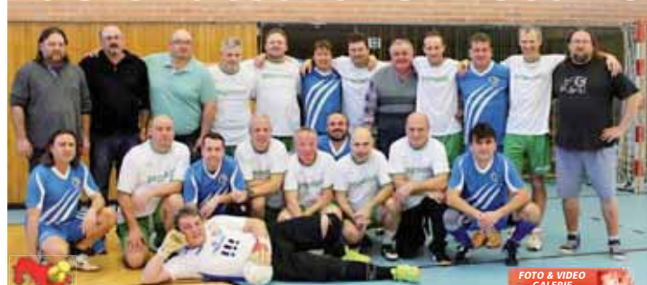
Aktéři exhibice na společném snímku před výkopem.