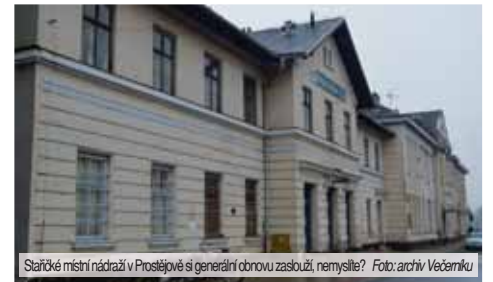
Staré místní nádraží v Prostějově si generální obnovu zaslouží, nemyslíte?

Právě SŽDC nedávno převzala i obě prostějovská nádraží do svého majetku. „Místní nádraží nakonec kulturní památkou prohlášené nebylo, takže můžeme zahájit přípravy. Pilotní projekt však musí projít rozsáhlejší aktualizací, s opravou počítáme nejdříve v roce 2019. Bude se jednat o celkovou rekonstrukci střešky, fasády, rozvodů, oken, dveří, celého interiéru a podobně. Zmodernizovat chceme každopádně i perón a nástupiště. To první by mělo být určitě bezbariérové“, doplnila Šubová s tím, že v současné době nelze ani odhadnout předpokládané náklady. (mik)