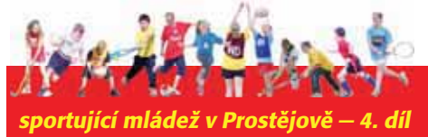
sportující mládež v Prostějově – 4. díl

Vysoké výsledkové ambice zavírají mladým talentům doma dveře