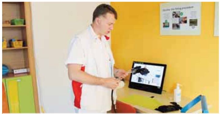
Robotická ruka je také jedním z originalit oddělení.

„Jedná se o takovou specifickou robotickou ruku, která pomáhá rozví-