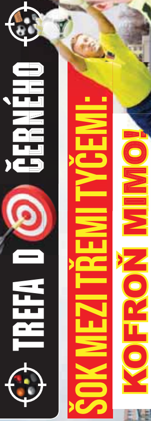
Tomáš Kaláb.