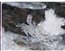
Voda, led a mráz. Tak to vypadalo u Laškova.