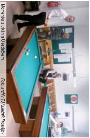
Momentka z utkání v Újezdčáčkem.

Extraligová mapa republiky má své centrum v Moravskoslezském kraji. Tam totiž sídlí dvojice úspěšně favo-ritů Ostrava a Bohumín, která do-plňuje pražský Žižkov s předním hrá-čem nad Labem Trmice. Pouze papírovým outsiderem má být tep-lický Újezdčáček.