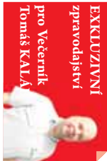
EXKLUZIVNÍ zpráva pro Večerník Tomáš KALÁ