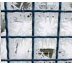
Ostnatý drát. Autor: Jitřina Piňosová