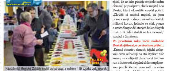
Návštěvníci Mexické Zeliády mohli ochutnat z celkem 119 vzorků zelených, zelených a dalších pokrmů, marmelád a dalších pokrmů.