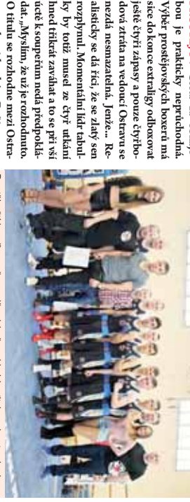
Prostějovští boxeři se už pravděpodobně z odhlaply titulu radovat nebudou...