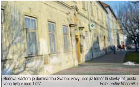
Budova kláštera je dominantou Svatoplukovy ulice již téměř tři stovky let, postavena byla v roce 1727.

Už více jak rok se mluví o tom, že by zde v budoucnu mohli vzniknout domov pro lidi trpící roztroušenou sklerózou. Přestože se na první pohled s objektem stále nic neděje,