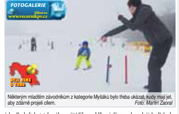
FOTOGALERIE Některým mladším závodníkům z kategorie Myšíků bylo třeba ubrát, kudy mají jet, aby získali správný cíl.