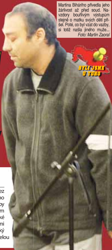
Martina Bihářiho přivedla jeho žárlivost až před soud. Navzdory bouřlivým výstupům stejně o matku svých dětí přišel. Poté, co byl vzat do vazby, si totiž našla jiného muže...