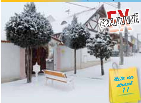
Tento dům v Dětkovicích si vytipovali zloději...