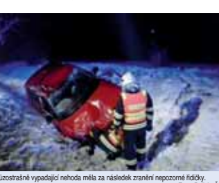
Horizontálně vypadalá nehoda měla za následek zranění nepozorné řidičky.