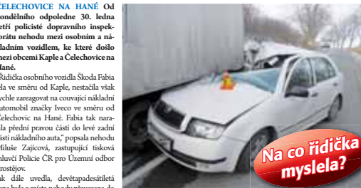
Horizontálně vypadalá nehoda měla za následek zranění nepozorné řidičky.