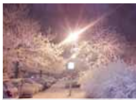
Zajímavý záběr lze pořídit i ve městě.