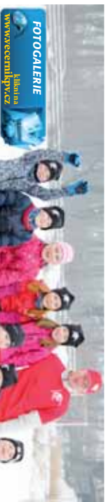
FOTOGALERIE Klikněte www.ecmmpkv.cz