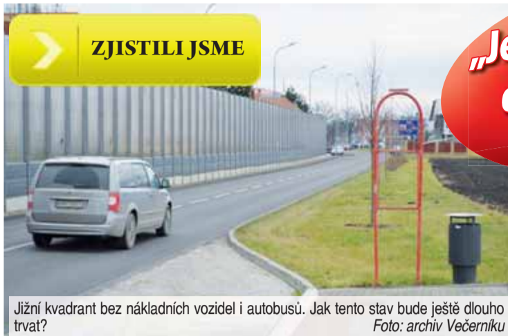
Jižní kvadrant bez nákladních vozidel i autobusů. Jak tento stav bude ještě dlouho trvat?