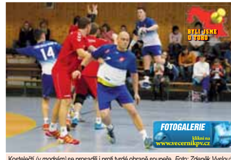
Kosteletci (v modrém) se prosadili i proti tvrdě obrané soupeři.

Domácí borci tahali od začátku za delší konec a soupeře deptali parádními shozy k lajnám, odkud zakončoval hbitá křídla Příkrýl