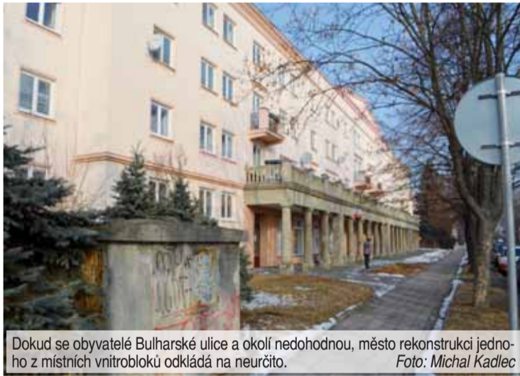
Dokud se obyvatelé Bulharské ulice a okolí nedohodnou, město rekonstrukci jednoho z místních vnitrobloků odkládá na neurčito.

Dva roky jednání, tři varianty řešení, nezáměr některých obyvatel. Výsledkem je pozastavení příprav akce. „Je to opravdu těžko uvěřitelné, ale bohužel taková je holá realita,“ potvrdil Večerníku Zdeněk Fišer (ČSSD), první náměstek primátorky Statutárního města Prostějova. Vzájemná jednání mezi magistrátem a zástupci bytových domů probíhají již od roku 2015. „Při prvním setkání obyvatelé vznesli své požadavky, které město zapracovalo do varianty řešení rekonstrukce vnitrobloku. Tato situace se opakovala a pracovníci Odboru