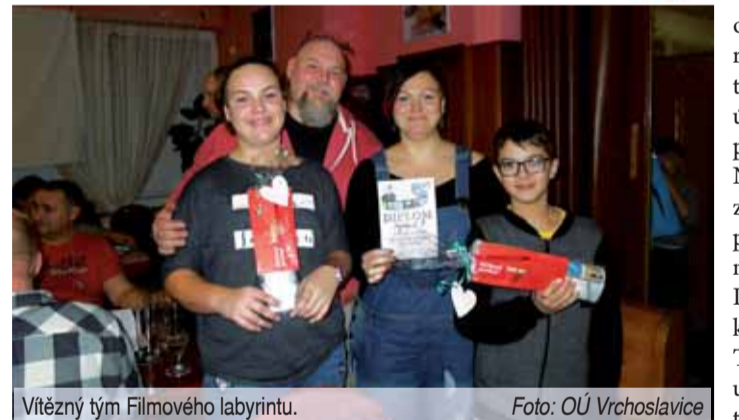
Vítězný tým Filmového labyrintu.