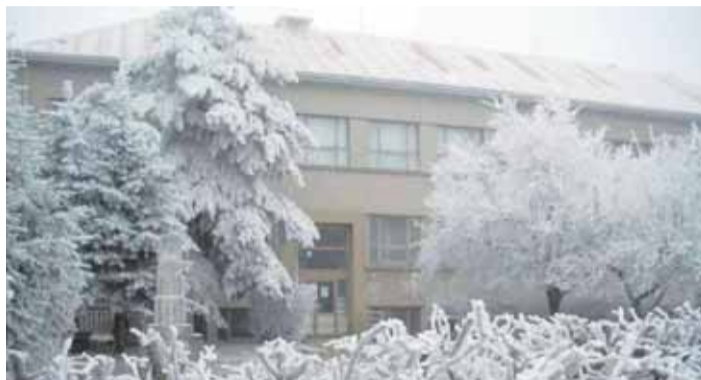
Muzeum Drahanské vrchoviny a vzdělávací centrum TGM v Drahaně zahájilo v budově bývalé školy provoz v červnu 2013. Loni v únoru bylo uzavřeno.