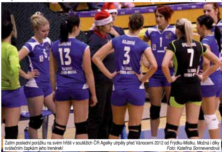
Zatím poslední porážku na svém hřišti v soutěžích ČR Agelky utrpěly před Vánoce 2012 od Frýdku-Místku. Možná i díky svátečním čapkám jeho trenérů!