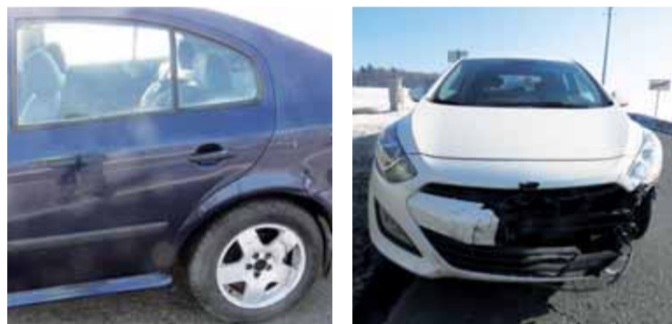
Zatímco škodovka zůstala havarovaná stát u Kostece, policisté chytili viníka s bílým vozem Hyundai až v Drahanech. 2x foto: Policie ČR

KOSTELEK NA HANĚ, DRAHANY Mívalé pondělí 10. února o půl deváté ráno došlo v křižovatce silnice Prostějov - Kostelec na Hané s komunikací od Smřic na Mostkovice k dopravní nehodě dvou osobních automobilů. Na tom by vzhledem k nebezpečnosti této křižovatky nebylo nic divného, k podobným karabóolům zde dochází bohužel často. Tento případ byl ale výjimečný tím, že viníka nehody honili policisté až do Drahan!