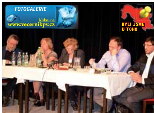
Představitelé radnice a židovských organizací společně lidem v sále vysvětlovali své postoje k danému problému.

Celý spor nakonec pomůže řešit bývalý premiér České republiky Vladimír Špidla. Podarí se mu to?