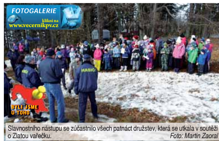
Slavnostního nástupu se zúčastnilo všech patnáct družstev, která se utkala v soutěži o Zlatou vařečku.