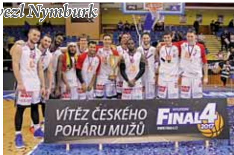
Už po jedenácté se z trofeje raduje basketbalový dominant z Nymburka.

PROSTĚJOV Podle očekávání dopadl finálový turnaj Českého poháru basketbalistů, který hostil Prostějov. Po dvou letech usiloval o celkové vítězství nejlepší domácí klub z Nymburka a roli favorita bez problémů splnil. Po finálové výhře na Opavu 72:52 získal pro svoji klubovou vitrínu jedenáctou pohárovou trofej. Prostějovský výběr domácího prostředí nevyužil, a po důstojné semifinálové porážce s Opavou utrpěl v boji o bronzové medaile debakl od Pardubic.