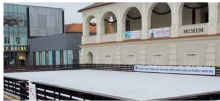
Také během druhé sezóny bylo kluziště na náměstí T. G. Masaryka hojně navštěvováno. Aby také ne, za dva a půl milionu...

Nelze ale vyloučit, že už na dnešním zastupitelstvu se bude o kluzišti diskutovat a třeba někdo přednese jiný návrh... (mik)