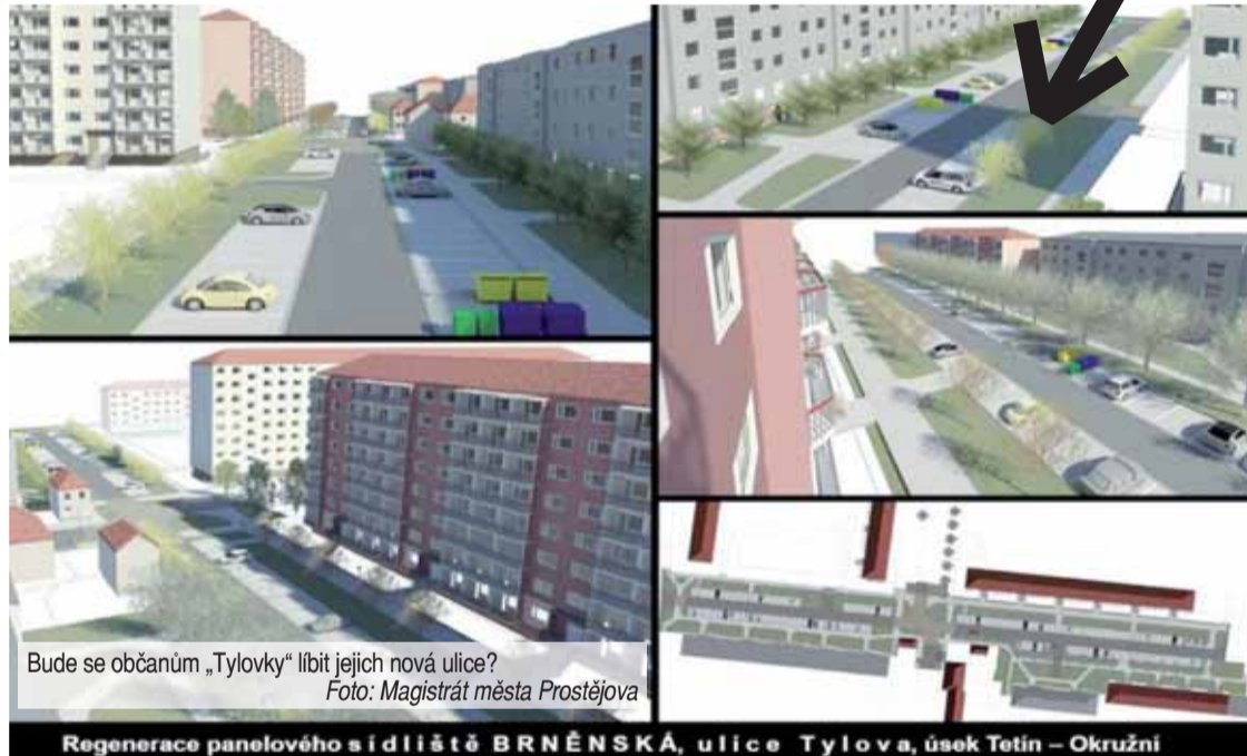
Bude se občanům „Tylovy“ líbit jejich nová ulice?

Jednání zastupitelstva města začíná ve 13.00 hodin a je pochopitelně veřejnosti přístupné. Tradičně je z něj také pořizován přímý přenos, který můžete sledovat na webových stránkách města. Večerník nebude v obřadní síni prostějovské radnice chybět a v příštím čísle přinese podrobnou reportáž. (mik)