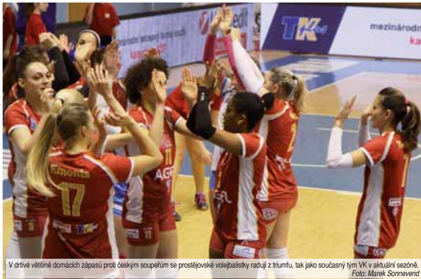
V drtivé většině domácích zápasů proti českým soupeřům se prostějovské volejbalistky radují z triumfu, tak jako současný tým VK v aktuální sezóně.

K jeho prolomení se dostala nejlépe družstva Olomouce v ročníku 2008/09, KP Brno o rok později a dvakrát Olymp Praha v sezóně 2012/13, neboť v těchto případech Prostějovanky uspěly jen o fous 3:2. Všechny ostatní duely na domácí palubovce v počtu mnoha desítek pak ovládly 3:0, maximálně 3:1. A s drtivou suverenitou dokráčely k osmi mistrovským titulům i stejnému počtu Českých pohárů za sebou. „Nejvíce ze všeho si cením té obrovské stability. Pochopitelně jsme do každého jednotlivého zápasu vyzdí šli jako jasní