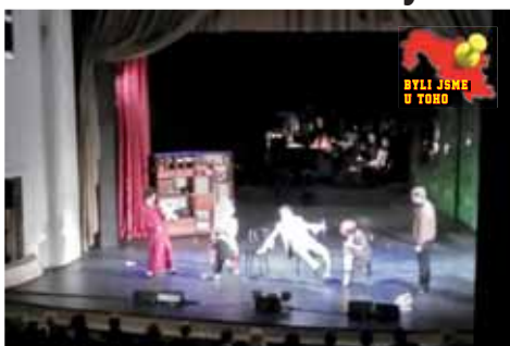
Alkohol, drogy, sex, umění. O tom všem vyprávělo drama Vrabčák a anděl.

Dvě velká jména z historie světového šoubiznisu, která však ani nyní rozhodně zapomenuta nebyla. „Edith je má nejoblíbenější zpěvačka, její hlas ve mně vždy probudí novou energii, nemůžu se dočkat, až to vypukne,“ přiznala Večerníku těsně před začátkem představení Šárka, jedna z návštěvnic.