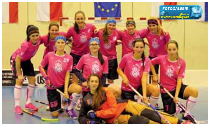
Růžová ekipa SK K2 hýřila po utkání s Paskovem úsměvy.

Statistiky z tohoto utkání najdete na straně 22, průběh soutěže budeme i nadále sledovat!