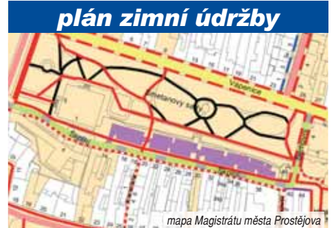
mapa Magistrátu města Prostějova

Chodník ve Smetanových sadech směřující z Vápenice směrem k altánu ve středu parku se tak od sněhu a náledí neuklízí! Večerníku to potvrdil i vedoucí odboru komunálních služeb prostějovského magistrátu. Občanům se doporučuje, aby v případě náledí zvolili hlavní cestu parkem. „Ve Smetanových sadech je v Plánu zimní údržby místních komunika-