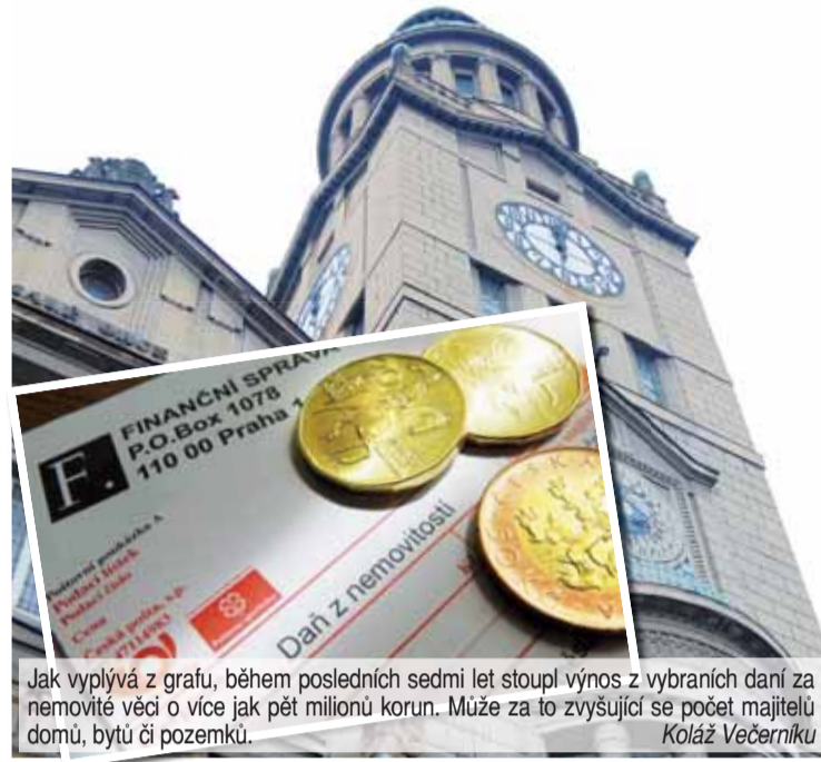
Jak vyplývá z grafu, během posledních sedmi let stoupl výnos z vybraných daní za nemovité věci o více jak pět milionů korun. Může za to zvyšující se počet majitelů domů, bytů či pozemků.