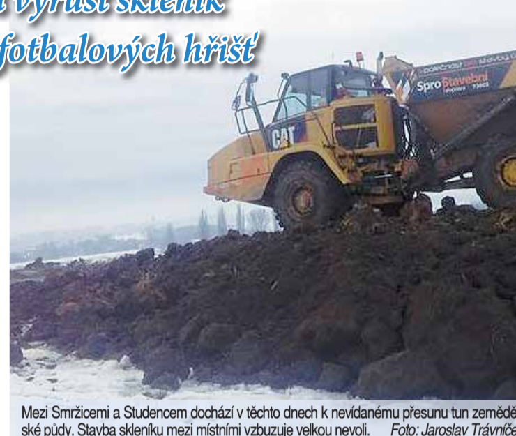
Mezi Smřicemi a Studencem dochází v těchto dnech k nevidanému přesunu tun zemědělské půdy. Stavba skleníku mezi místními vzbuzuje velkou nevoli.

Přes jejich protesty už však odborníci na životní prostředí z Olomouckého kraje a následně i stavební úřad záměr posvětil. Projekt se tak už začal realizovat, a to