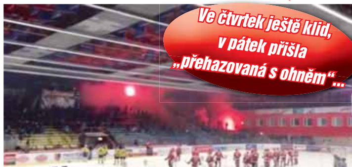
O velké inteligenci opět přesvědčili někteří příznivci Prostějova a Přerova, kteří si po skončení pátečního zápasu zahrávali s životy ohněm a na ostatní návštěvníky ohled nebrali...

Podobně pohodovým způsobem do dlouho pokračovalo také o den později, leč zde už relativní idyla nevydržela. Na podlé straně Víceúčelové haly zimního stadionu nad strídačkami začaly hned po skončení zápasu lézat mezi kot-