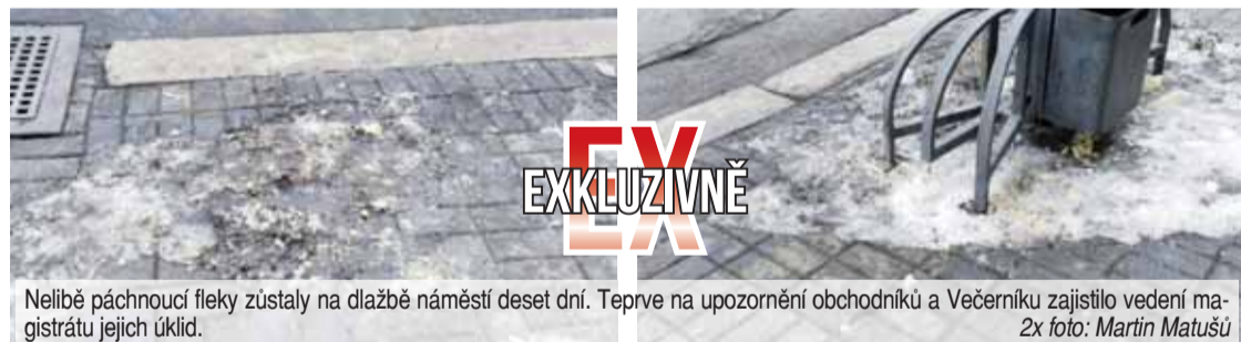
Nelíbě páchnoucí fleky zůstaly na dlažbě náměstí deset dní. Teprve na upozornění obchodníků a Večerníku zajistilo vedení magistrátu jejich úklid.