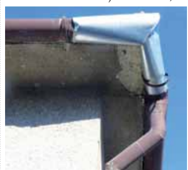
Poškození fasády a okapové roury na domě v Kralickém Háji chtěl řidič kamionu uhradit, pak ale vzal „roha“...