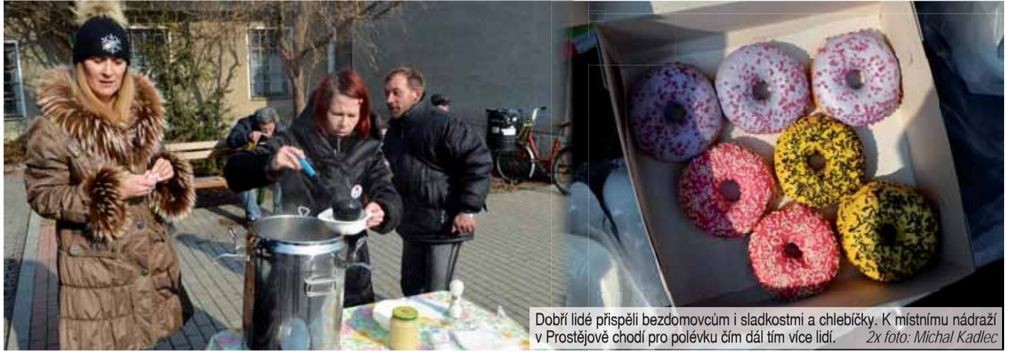
Dobří lidé přispěli bezdomovcům i sladkostí a chlebičky. K místnímu nádraží v Prostějově chodí pro polévku čím dál tím více lidí.