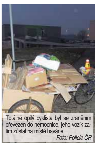
Totálně opilý cyklista byl se zraněním převezzen do nemocnice, jeho vozík zatím zůstal na místě havárie.

í. „Sedmašedesátiletý řidič automobilu značky Škoda přehlédl při jízdě z ulice Komenského do Palackého třídy po hlavní komunikaci od ulice Brněnské stejným směrem jedoucí šestašedesátiletou cyklistku. Žena po střetu s vozidlem upadla a způsobila si zranění na hlavě,“ popsal nehodu František Kořínek, tiskový mluvčí Policie ČR pro Územní odbor Prostějov. „Ke zranění dalších osob nedošlo, výše způsobené hmotné škody byla vyčíslena na čtyři tisíce korun. Alkohol byl pak u obou účastníků vyloučen provedenými dechovými zkouškami,“ konstatoval Kořínek s tím, že ženu si převzali lékaři Rychlé záchraně služby a převzeli ji k ošetření do nemocnice.