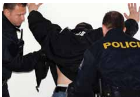
Policisté se s agresivním opilcem vůbec nepárali, muž skončil v poutech na záchytce. Ilustrační foto

„V neděli devátého února krátce před dvacátou hodinou napadl osmdvacetiletý muž v rodinném domě v obci na Prostějovsku svého o čtyři roky staršího bratra. Matka mužů incident oznámila na linku 158. Na místo vyslaní policisté z obvodního oddělení v Plumlově u muže podezřelého z přestupku proti občanskému soužití dechovou zkouškou změřili hodnotu 2,46 promile alkoholu,“ prozradil František