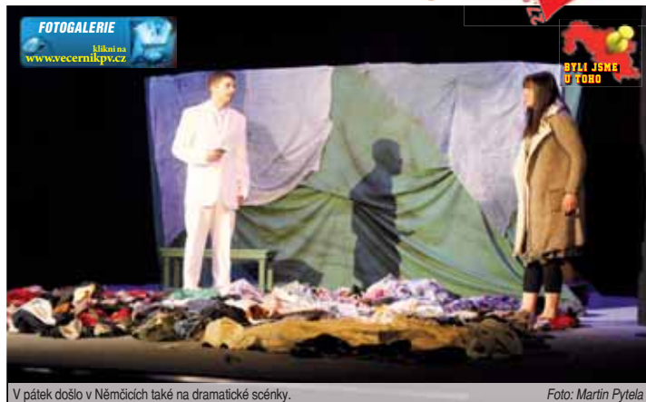
V pátek došlo v Němčicích také na dramatické scénky.