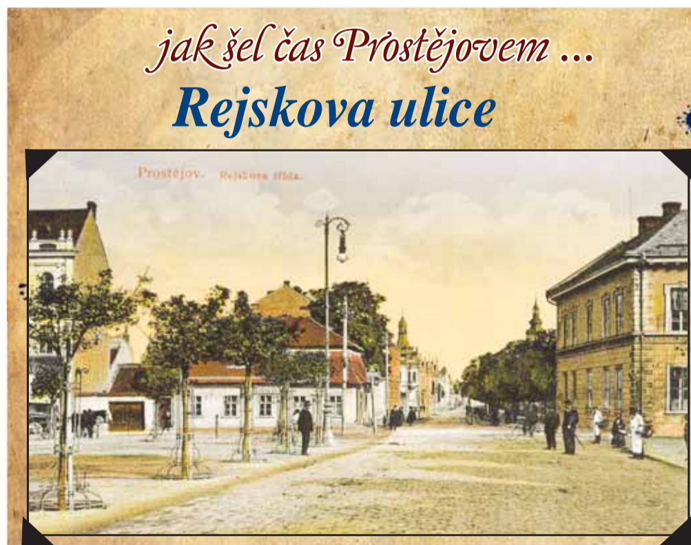
jak šel čas Prostějovem ... Rejskova ulice

Po dalším týdnu už policie zveřejnila identifikát podezřelého násilníka, trvalo však ještě nějakou dobu, než jej dopadla. Tento čin se ale stal určitým mezníkem pro bezpečnost ve Vrahovicích. Zdejší občané začali dávat nepokrytě najevo své obavy, nejednalo se totiž o první případ násilného činu v této příměstské části Prostějova. Státní a městská policie tak od té doby zesílily své hlídky, které hlavně ve večerních hodinách projížděly Vrahovicemi křížem krážem. Mnohem vážněji se začalo na radnici uvažovat i o zavedení kamerového systému v této lokalitě. Mezitím se ale do Vrahovic nastěhovali do zdejších ubytoven lidé s kriminální minulostí, a jelikož jich nebylo zrovna málo, obavy o bezpečnost začaly nanovo. Příznak je tedy aktuální i nyní po deseti letech, Vrahovice rozhodně nejsou zrovna dvakrát bezpečnou destinací... (mik)