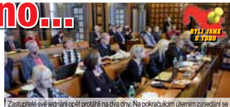
Zastupitelé své jednání opět protáhli na dva dny. Na pokračujícím úterním zasedání se už ale řada z nich jaksi nepodílela...

kauzy společnosti Manthellan. Zkrátka naopak přišli zástupci Federace židovských obcí České republiky, kterým zastupitelé zamítli výměnu pozemků na Městském hřbitově v Prostějově za park ve Studentské ulici. Projednávání dalších bodů, a nezbyvalo jim už moc, přerušila v pondělí večer dvaadvacátá hodina. Podle jednacích řádů zastupitelstva je totiž právě tato doba hraničním mezníkem, do kdy může jednání trvat. „Pokud si odhlasujeme, že pokračujeme dál, můžeme tady být až do půlnoci. V tom případě by ale zaměstnanci magistrátu měli podle Zákona práce zítřka volno“