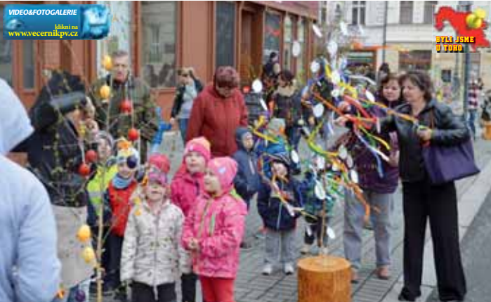
Děti se společně se svými učitelkami v pátek na náměstí bavily zdobením velikonočních stromečků.