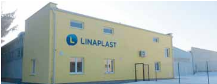
Firma z Kralic otevřela novou pobočku ve Skřípově na začátku letošního roku.

SKŘÍPOV Tenhle příběh má dobrý konec. Bývalý armádní sklad munice a kasárna ve Skřípově před více jak rokem změnil majitele. Celých šest hektarů koupila firma Linaplast z Kralic na Hané zabývající se výrobou plastů pro automobilový průmysl. Výrobu v rozlehlém areálu se jí podařilo rozjet, firma má přitom v plánu počty zaměstnanců i nadále zvyšovat.