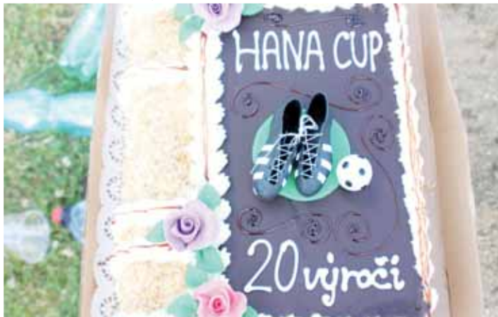
Sladká odměna v podobě dortu byla tradiční odměnou vítěznému týmu. Po nedávných událostech však i tento cukrářský skvost poněkud zhořkl...

V současnosti to tedy vypadá tak, že krásný krumsínský areál, jenž se zvelebil zejména díky ziskům z Haná Cupu fotbalově minimálně v létě osiřel. Své mistrovské zápasy zde ještě hraje rezerva Plumlova a některé duely zde odehrají i mládežnické plumlovské výběry. Při současné tendenci stáleho úbytku aktivních fotbalistů však hrozí, že se nad další fotbalovou regionální baštou stahují temná mračna totálního zániku!