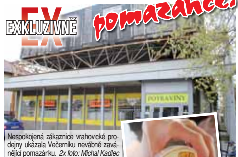
Nepokojená zákaznice vrahovické prodejny ukázala večerníku nevábně zaváňající pomazánku.

„V pátek sedmého dubna v osm hodin ráno jsem si v tomto obchodě koupila pomazánku z Nivy. Když jsem ji na snídani ochutnala, řekla jsem si, že je to 'echt' nivová pomazánka! Zaváhala totiž opravdu fest! Podívala jsem se na etiketu, na které bylo ovšem vyznačeno datum spotřeby do soboty osmého dubna. Poté jsem se podívala důkladněji na kelímek, na jeho spodku však bylo vyznačeno úplně jiné datum, a to do devětatřicátého ledna! Nechápala jsem, jak na jednom výrobku mohou být dvě data doporučené spo-