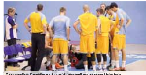
Basketbalisté Prostějova už vymyslí strategii pro záchranné boje.

PROSTĚJOV Na poslední přičce skončili po nadstavbové části prostějovští basketbalisté. Další šest zápasů nyní odehrají Orli v play-out Kooperativa NBL a v nich se pokusí odvrátit hrozbu baráže.