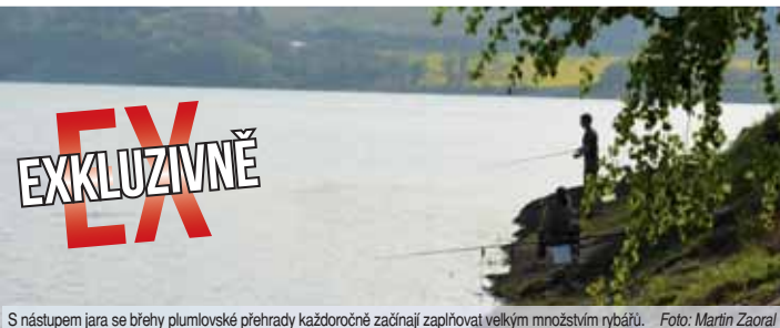
S nástupem jara se břehy plumlovské přehrady každoročně začínají zaplňovat velkým množstvím rybářů.

Otázkou zůstává, zda kapry nebude po tomto opatření v přehradě přilší