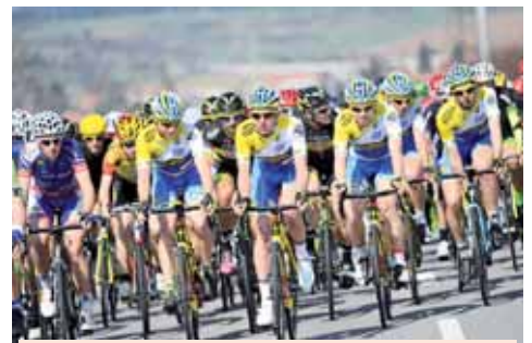
Prostějovští cyklisté byli vidět na čele pelotonu jen v úvodu závodu.