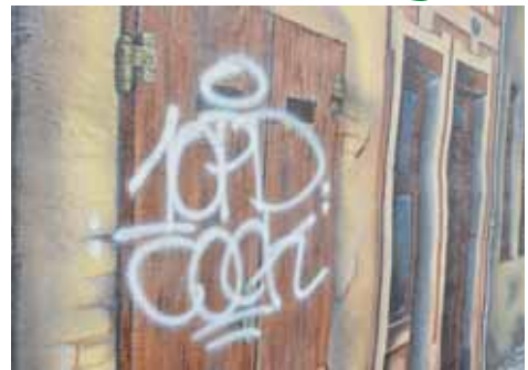
Autoři tohoto výtvoru dodnes nebyli vypátráni. Možná se teď někde v koutě smějí...