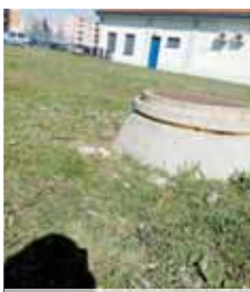
Milovníci perivitu řadí na různých místech Prostějova.