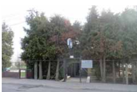
Do obchodu i hospody v Osíčanech, které provozuje místní obec, se vchází touto brankou.

Výskyt myšního trusu, nečistot na podlaze, regálech či zařízeních, hromadění odpadků, a z toho plynoucí riziko kontaminace potravin. Právě tyto závady odhalili při své kontrole předminulý čtvrtek 30. března inspektoři SZPI v obchodě i vedlejší hospodě v Osíčanech. V kramu posléze uzavřeli sklad potravin, v pohostinství pak sklad lihovin, čaje, citronek, cukrovinek a jiných potřeb sloužících pro chod hospody. Obě provozovny inspekce otevřela hned druhý den. Pokud se provozovatel, kterým je místní obec, ovšem prav-