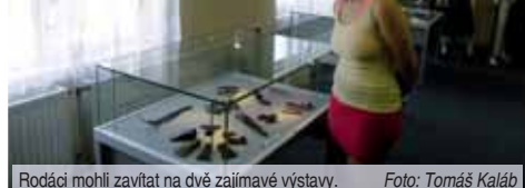
Rodáci mohli zavítat na dvě zajímavé výstavy.

děkovat veřejně lidem, kterým život obce není lhostejný a kteří se tohoto jubilea ve zdraví dožili;“ poznamenal Novotný. Ze slavných rodáků se omluvila atletka Helena Fibingerová, která ale plánuje přijet do Víceměřic na besedu s obyvateli.