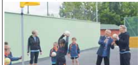
Pavel Holík na svém letišti nemohl chybět.

Po dva dny se v nově zrekonstruovaném sportovním areálu odehrávaly soutěže miniházené a sportovní dovednosti. Na Hanou se sjely všechny oddíly střední Moravy, které se věnují házené. „Jsem dlouhodobým příznivcem kostelecké házené, rád jsem tedy přijal pozvání i na tuhle akci;“ prozradil Pavel Holík. „Mým místním nadšeným vysekout poklonu. Pro házenou toho dělají strašně moc. Vždycky tu panuje přátelská atmosféra a každý se tu musí cítit dobře;“ dodal poslanec Parlamentu Poslanecké sněmovny České republiky. (red)