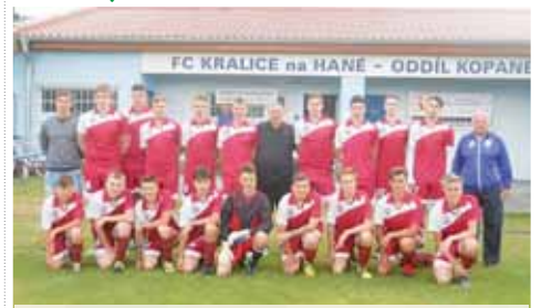
Domácí výběr dobyl bronzovou příčku.