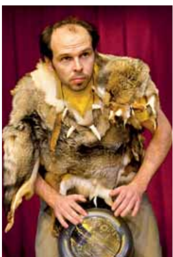
Hra odhálila mnoho zábavných, ale především pravdivých faktů o obou pohlavích.

PROSTĚJOV Ti, kteří se těšili na povedenou komedii Tři grácie z umakartu, měli smůlu. Smutník však nemuseli, protože původní představení bylo nahrazeno legendární hrou Roba Beckera, nesoucí název Caveman. O zábavu tedy rozhodně nouze nebyla.