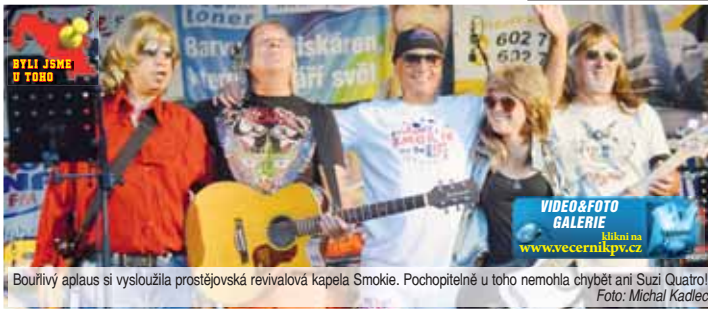
Bouřlivý aplaus si vysloužila prostějovská revivalová kapela Smokie. Pochopitelně u toho nemohla chybět ani Suzi Quatro!

Sobotní první díl letošního Rock Maier Festu se skutečně vydařil. Revivalové skupiny bavily publikum až do nedělní tři čtvrtě na jednu! „Já jsem naprosto spokojený. Výšlo krásné počasí a návštěvnost byla přímo rekordní. Když jsem před deseti lety začínal na přehradě s těmito akcemi, věřil jsem, že si svoji tradici udržím.