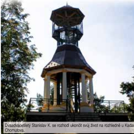
Dvaadvacetletý Stanislav K. se rozhodl ukončit svůj život na rozhledně u Kadaně ležící v západních Čechách nedaleko Chomutova.

Stanislav K. pocházel původem z Ukrajiny. V Prostějově studoval na střední zdra-