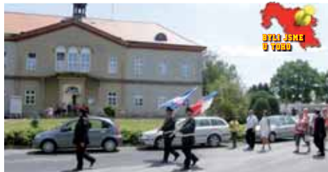
Slavnostní průvod Víceměřicemi.

V následující slavnostní chvíli byly předány pamětní medaile dvačtyřiceti vybraným osobnostem obecního společenského života. „Jsme rádi, že můžeme tímto způsobem po-