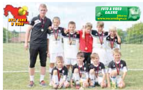
Kosteletká mistrovská sestava v kategorii starší přípravky.

získali plný počet bodů za čtyři vítězství. Obdobně projel „běčkem“ Kostelec na Hané. Do semifinále doprovdily tuto dvojici celky Mostkovic a Němčice nad Hanou. Nevděčná poslední příčka zbyla na Kralice na Hané, první turnajovou radost si naopak prožili elevové Přemyslovic, kteří přetlačili v zápase o sedmou pozici Horní Štěpánov. Páté místo po výhře nad Uřičemí brala prostějovská Haná. Hodně dramatické byly semifinálové duely Kosteletčí se nadřeli s bojojnými Mostkovicemi. Nezamyslictí se rozešli s němčickým rivalem snímě a rozhodovaly až pokutové kopy, v nichž byla úspěšnější drobtovina z Nezátek. Pohár za třetí místo si ze Ptení nakonec odváželi Mostkovičtí, když přejeli na závěr Němčice nad Hanou. Ve finále pak byl dlouho nerozhodný stav. Štělečké trápení Kostece prolomil až ve druhém poločase Maxim Mrva - 1:0. Bojovníci v zeleném však dokázali kontrovat - 1:1. Rozhodující gól padl až pár minut před koncem, když se podruhé trefil Mrva - 2:1. Následně pak ještě Kosteletčí přidali dvě branky a zaslouženě se radovali z výhry 4:1 a celkového prvenství.