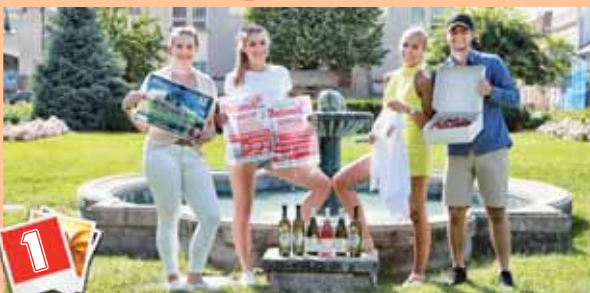
Oktáva A z GJW získala poukaz na večírek v hodnotě 20 tisíc v Pilsner Urquell restaurantu, výlet na hrad Sternberk pro celou třídu včetně dopravy, dárková trička s emblémem PROSTĚJOVSKÉHO Večerníku, bednu sektu z Vinotéky Svět vína, dva krásné ovocné dorty a čtvrtletní předplatné Večerníku pro celou třídu.

PROSTĚJOV Studenti oktávy A ze všech skříní svých rodičů, sklepičí či second handů vytažili šustáky, elastáky, džiny a flanelové košile, v nichž oživilo módu devadesátých let, na jejichž sklonku se narodili. O tablu třídy, kde maturitu úspěšně složilo sedmadvacet z původně třicetky studentů, si Večerník povídal s Petrem Ohlídalem.