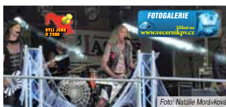
FOTOGALERIE Líbilo se na www.vecernikpv.cz

„Letošní ročník jsme to pojali tak, že v době vystoupily čistě jen revivalové kapely, v sobotu pak kapely originální. Celé přípravy trvají v podstatě rok. Jeden festival skončí a už začínáme oslovovat kapely a shánět vše potřebné na rok příští. Největší problém je sládit to tak, aby se ten termín kapelám hodil. A stejně se občas stane, že se nakonec