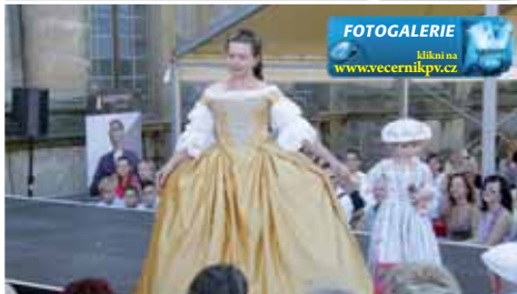
Návštěvníci mohli v úvodu obdivovat dobové kostýmy z epochy Marie Terezie.

Kromě očí mohli přítomní uspokojit i chuťové pohárky díky prezentaci farmářských produktů a zdravé výži-