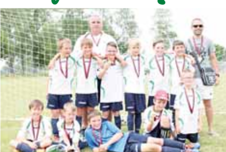
Přeborníkem nejmladších přípravek se stala Haná Prostějov.

neměla vliv na konečný výsledek. „O to přece jde v první řadě. V této kategorii nejsou výsledky vůbec důležité. Hlavní je, že ty děti fotbal mají a mají z něj radu, jsou fantastické“, poznamenal Milan Elmkar, přiléhavě předseda OFS Prostějov. Jeho slova byla jen potvrzena v zápasech o konečné umístění. Duel o poslední místo mezi Jesencem a Konicím měl nesukutečný náboj a Jesenec se po divoké výhře 5:4 radovali, jakoby celý turnaj vyhráli. Ten samý pohled nabídl soubor o patou příčku, kdy zvídali penaltový rozstřel Vrahovičů, domácím borcům tekly po tvářích slzy zklamání. Největší výsledkovou bombu odpálili v semifinále benjaminci 1.SK Prostějov, „C“. Ti se nezalekli vyspělých Smržičanů a přes dvoubrankové manko nakonec slavili po výhře 4:3 postup do finále. Ve druhém duelu zvítězila Haná s „B“ týmem eskáčka sedm nau. Smržice si zchlazily záhu v boji o třetí místo proti druhému celku 1.SK. Hezký fotbal nabídl i finále, ve kterém hrála prim Haná, ale bojovnosti z eskáčka to nezabírali ani při narůstajícím rozdílu a proti urostlejšímu soupeři uhráli solidní