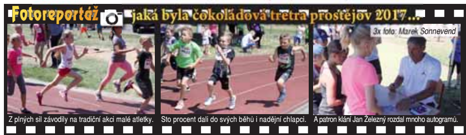
Fotoreportáž jaká byla čokoládová tretra prostějov 2017... Z plných sil závodily na tradiční akci malé atletky. Sto procent dali do svých běhů i nadějní chlapi. A patron klání Jan Železný rozdával mnoho autogramů.