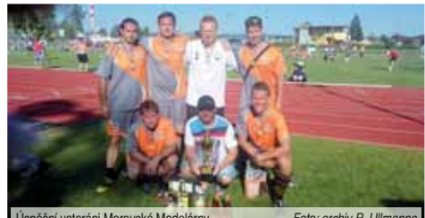
Úspěšní veteráni Moravské Modelárny.

SVITAVY Nejprestižnější letní turnaj s prostějovskou stopou. Fotbaloví veteráni z regionu, tým Moravská Modelárna, se uplynulou sobotou blýskli výborným výsledkem na nej-