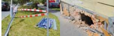
Toto jsou následky hrozivé havárie opilého řidiče v Martinákové ulici. Za volant si zoeila jistě dlouhou dobu nesedne.

„V pátek třináctého června kolem dvaadvacáté hodiny došlo v Martinákové ulici v Prostějově k dopravní nehodě vozidla BMW. Z prvotního šetření vyplývá, že šestaticetiletý řidič osobního automobilu, který jel ve směru od Olomoucké ulice, z prozraťm přesně nezjištěných příčin vyjel vpravo mimo komunikaci, bokem vozidla narazil do domu, poté i do dopravní značky a sloupu veřejného osvětlení,“ informovala Irena Urbánková, tisková mluvčí Krajského ředitelství Policie Olomouckého kraje.