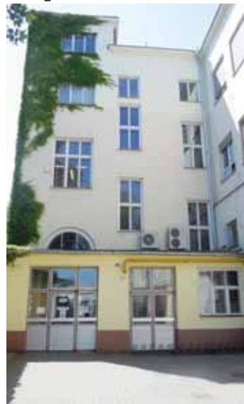
Už během letních prázdnin začne rekonstrukce Domu dětí a mládeže na Vápenici, stavět se začne i velká tělocvična!

Večerníku se ale náměstek pro investiční výstavbu před půl rokem svěřil, že stavba tělocvičny je ohrožena, protože při stavebním řízení se proti projektu razantně vyslovil jeden z dotčených sousedů. „Vyskytl se problém s vysokou stěnou, která by údajně tomuto občanu stínila při pohledu z jeho domu. Plán postavit tělocvičnu tak z původního projektu musíme vymotat,“ uvedl Fišer. Těsně před zastupitelstvem však vyšlo najevo, že s mužem rozporujícím celý projekt se podařilo dohodnout a výstavba se vrátila ke svým původním plánům. Rada města tak žádala zastupitele o schválení rozpočtové opatření ve výši sedmadvaceti milionů korun, která by se v rámci rekonstrukce DDM na Vápenici proinvestovala už letos. „Nemáme ještě dořešenou stavbu jedné olympijské tělocvičny a už schvalujeme druhou! A jak to bude s dotací, to bych taky rád věděl,“ vzpíral se souhlasu jeden z opozičníků.