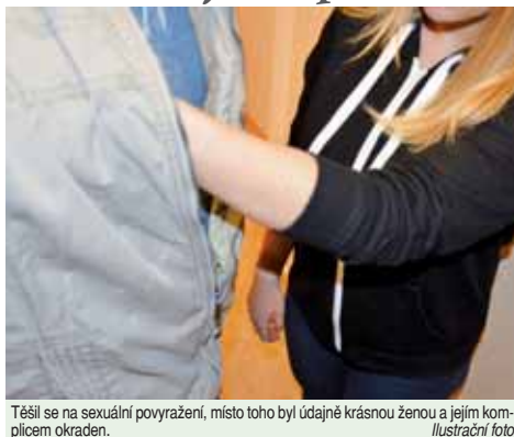
Těšil se na sexuální povyražení, místo toho byl údajně krásnou ženou a jejím komplotem okraden.

Je nyní na strážcích zákona, aby provedeno dvojici dopadli. „Policisté ve věci zahájili úkony trestního řízení pro podezření z přčinu krádeže a přčinu neoprávněného opatření, padělán a pozměnění platebního prostředku. V případě dopadení a odsouzení pachatelům tohoto skutku hrozí trest odnětí svobody až na dva roky,“ dodal Kořínek.