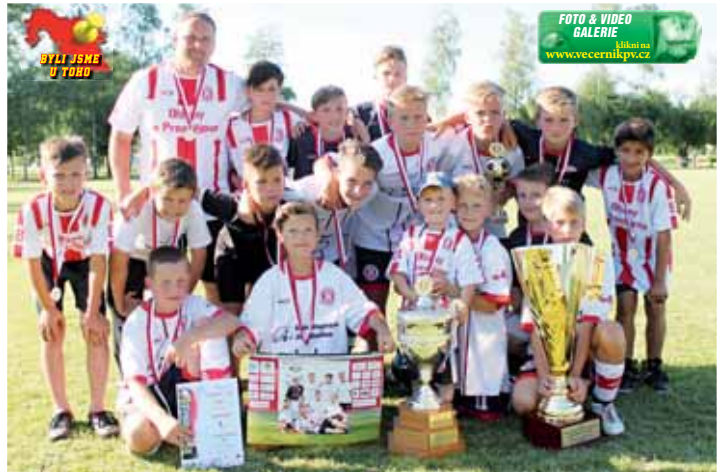
Vítězná olšanská parta se všemi trofejemi.

Celkové tak turnaj skončil z pohledu organizátorů úspěšně po všech stránkách. „Nevyskytly se prakticky žádné problémy. Až na malé prodlevy se jelo podle časového harmonogramu. Musím říci, že mi spadl velký kámen ze srdce,“ úlevně hodnotil čtvrtý ročník Michal Uhřík a pokračoval: „Nejvíce potěšující je, že se mě už ptala polovina trenérů, jestli se mohou přihlásit na příští ročník.“