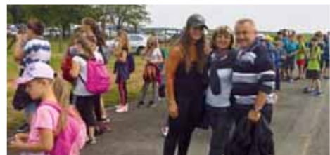
Pavel Holík na svém letišti nemohl chybět.

Stichovický Deltaklub, jehož je dlouholetým členem poslanec Parlamentu České republiky MUDr. Pavel Holík, pořádal na závěr školního roku tradiční akci v podobě Dětského dne. V prostorách a hangárech stichovického letiště znel dětský výskot a obdivné štěbetání.