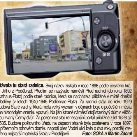
Stávala tu stará radnice. Svůj název získala v roce 1896 podle českého krále Jiřího z Poděbrad. Předtím se nazývalo náměstí Před radnicí (do roku 1892 Rathaus-Platz) podle staré radnice, která se nacházela přibližně v místě dnešní Moděvy (v letech 1940-1945 Poděbrad-Platz). Za radnicí stála do roku 1929 budova Staré valchy, která měla velký význam v dějinách boje o počestí města (na historickém snímku vpravo). Na jižní straně náměstí stojí starobylý dům s věžičkou zvaný Černý dvůr. Za pozornost stojí renesanční portál přibližně z let 1526 až 1535. Budova poštovního úřadu na západní straně byla postavena v roce 1897, v přízemním rohovém domku naproti přes Vodní ulici byla o dva roky později otevřena nejstarší mateřská škola v Prostějově.