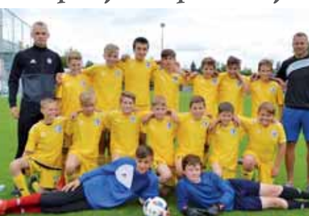
Domáci výběr 1.SK Prostějov.

jsem původně plánovali. Museli jsme tak omezit počet zápasů v základních skupinách“, informoval Neoral. Turnaj si po loni vysoko nasazené laťce svou úroveň zdělali. Domáci výběr se mezi abnormálně silnou konkurencí neztratil. Kluci zahráli, na co měli. Rozhodně herně nepropadli. Důležité ale bylo, že se mohli poměřit se soupeři, se kterými se kluci nemají možnost strettout, vypíchl vedoucí trenér Sportovního střediska mládeže Prostějov. Ve finálové skupině si nejlépe počínala olomoucká Sigmě, která za sebou nechala na druhém místě Zlín a třetí Karvinou. Nejlepším zahraničním účastníkem byli mladíci z Košic. „Já bych především rád poděkoval všem rodičům a trenérům, kteří se podíleli na organizaci celého turnaje. Myslím, že to všichni zvládli ke spokojenosti našich hostů“, vzkázal Martin Neoral. (zv)