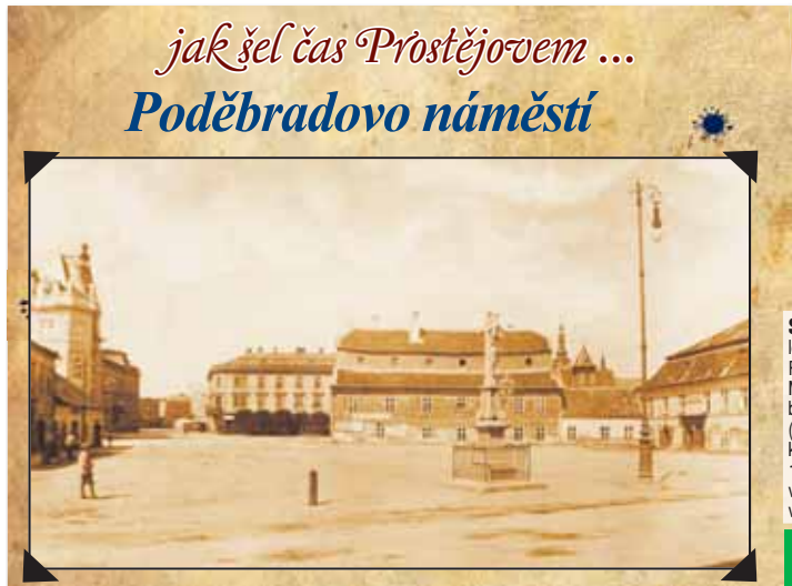
jak šel čas Prostějovem ... Poděbradovo náměstí