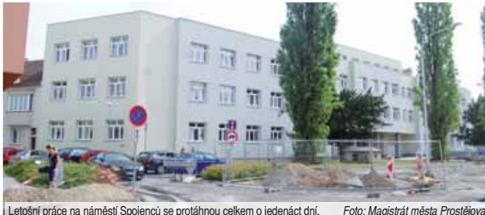
Letošní práce na náměstí Spojenců se protáhne celkem o jedenáct dní.

PROSTĚJOV Nedávné přívalové deště a s tím spojené vícepráce se negativně podepisují na některých stavebních investicích. Nejnak je tomu i v případě městských zakázek. Proudny vody ovlivnily stavební postupy rozsáhlé rekonstrukce náměstí Spojenců. Vedení magistrátu už nyní spočítalo, že rekonstrukce bude mít určitý skluz... „Práce, které jsou naplánované na tento rok, mely trvat sedmdesát dnů. Z důvodu nevhodných klimatických podmínek v průběhu letošního měsíce června a července, kdy nebylo možné pokračovat ve stavební činnosti, se