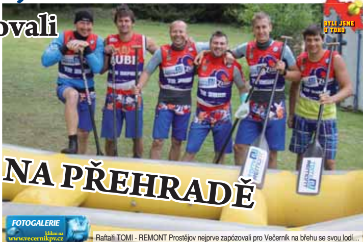
FOTOGALERIE k článku na www.vecernikpv.cz