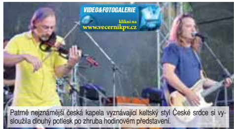
VIDEO & FOTOGALERIE Můžete si prohlédnout na www.vecernikpv.cz