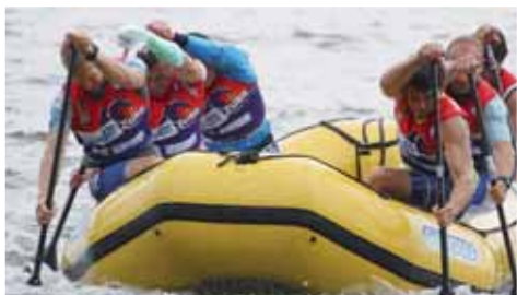
...a vzápětí se naplno vrhli do tréninku na hladině plumlovské přehradě.