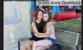
Fanynky nesměly zaručeně chybět.