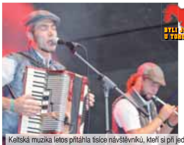
Keltská muzika letos přitáhla tisíce návštěvníků, kteří si při jednotlivých koncertech kapel s chutí zatancovali.