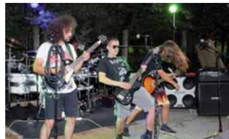
Skupina Group of Cocks to umí rozbalit.