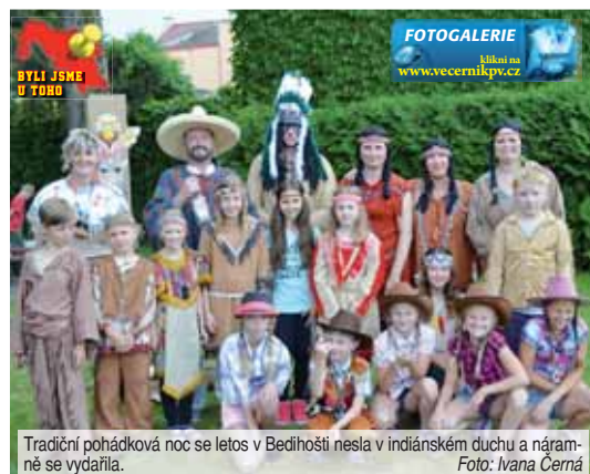
Tradiční pohádková noc se letos v Bedihošti nesla v indiánském duchu a náramně se vydařila.