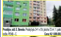
Prostějov, síd. E. Beneše. Prodej bytu 3+1 v OV, plocha 72 m 2 , 1. patro, boží. PEB-G-C. Cena: Kč 1.669.000,-