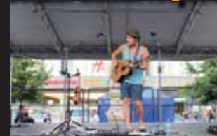
Voxel při zkoušce před koncertem...