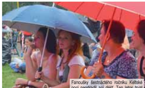
Fanoušky šestnáctého ročníku Keltské noci neodradil ani déšť. Ten letos trval našťáště jen půl hodiny a festival nijak neochlzl.

nepřetržitě. Do půlnoci se na pódiu vystřídaly ještě kapely Selfish Murphy, Bran, Démairt, Sliotar a samotnou Keltskou noc uzavřela česká kapela Wolfarlan. Nádherný ohňostroj dvě hodiny po půlnoci byl poslední tečkou za šestnáctým ročníkem, který se nadmíru vydáril. Celou Keltskou noc zprjemňovalo bohaté občerstvení. Proudem tekly pivo, medovina či tradiční skotská whisky. A voněly bramboráky, klobasy, makrely a další pečené speciality. Kde jinde byste strávili příjemnější víkend?