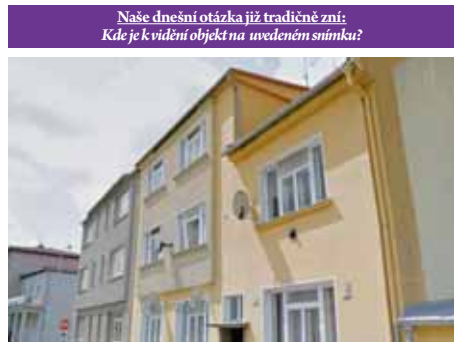
Naše dnešní otázka již tradičně zní: Kde je kvádrní objekt na uvedeném snímku?