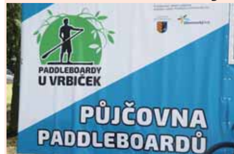
Zajezdit si na paddleboardu můžete i na plumlovské přehradě díky půjčovně na pláži U Vrbiček.