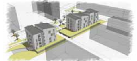
Komunitním domům v Holandské ulici už nic nestojí v cestě, stavět se začnou ale až v roce 2018.

Situace s projektem, který v Holandské ulici počítá rovnou se dvěma domy pro seniory, se ale během letních prázdnin výrazně zlepšila. „Zatímco v Sušilově ulici jsme žádné majetkoprávní problémy neměli a projekt nikdo z dotčených orgánů ani majitelé sousedních domů či pozemků nerozporoval, v Holandské ulici byla situace jiná. Poté, co jsme vyměnili pozemky se společností Lidl, aby se oba domy do lokality vešly, jsme požádali o stavební povolení. Při stavebním řízení ale byl proti stavbě komunitních