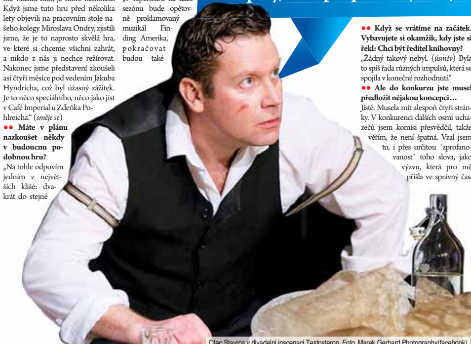
Otec Stavros v divadelní inscenaci Testosteron.