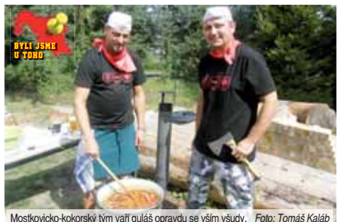
Mostkovicko-kokorský tým vaří guláš opravdu se vším všudy.

Libeznický guláš Praháčů a guláš Devil od Steel Devil, návštěvníky evidentně zaujal výše zmíněný Ma-MoGul a guláš MUDr. Pohlreicha od První pomoci teamu. Ještě dodejme, že o dobrou náladu kochutnávání dobré krmě se od praveho poledne starala kapela Kokeno Rock.