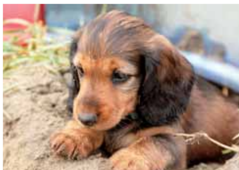
Roztomilého jezevčíka měl neznámý člověk vyhodit pod ohrozimským kopcem z auta.