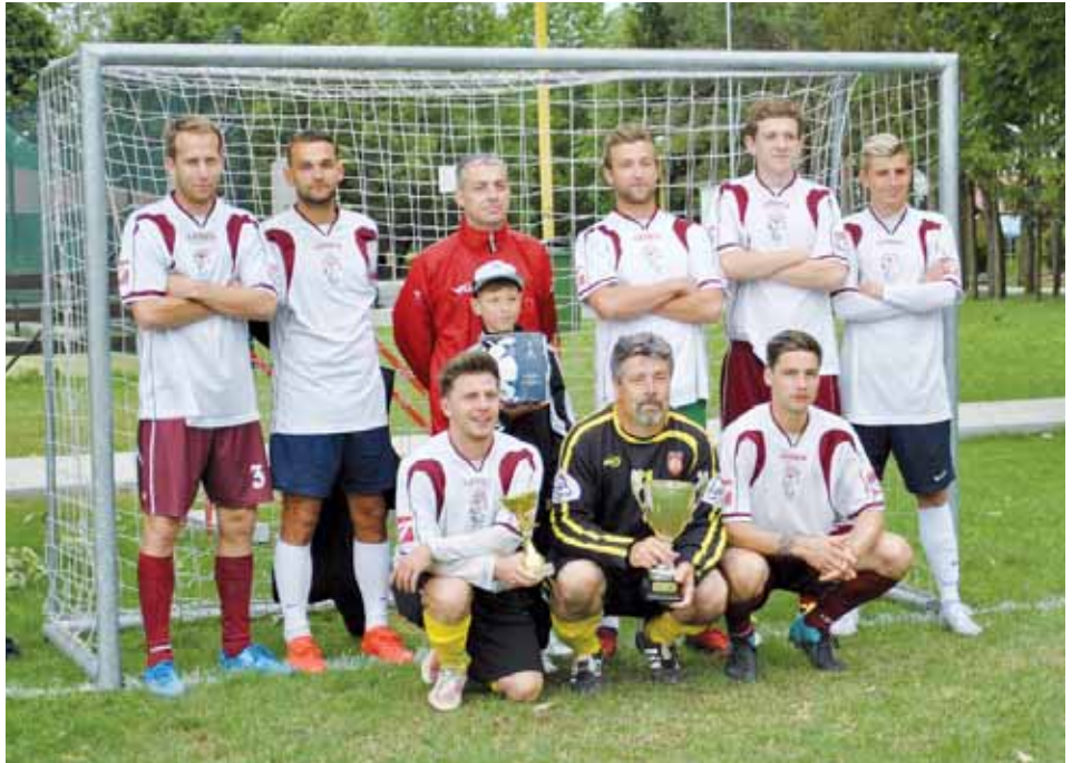
SK Tomek Dobrochov vyhrál v uplynulé sezóně okresní ligu i pohár a získal double potvrdil svou suverenitu za poslední roky.

O dřív hodně oblíbený sport už sice není takový zájem, ale okresní ligy se účastnický drží nad vodou