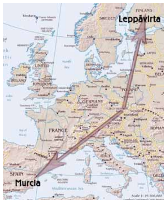
Projekt mezinárodní spolupráce zavede studenty GJW na sever a jih Evropy