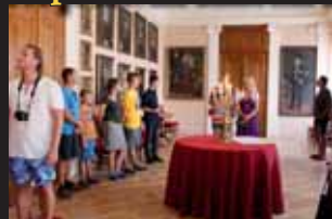
Lidé si na zámku se zájmem prohlédli i parádní sbírku obrazů.