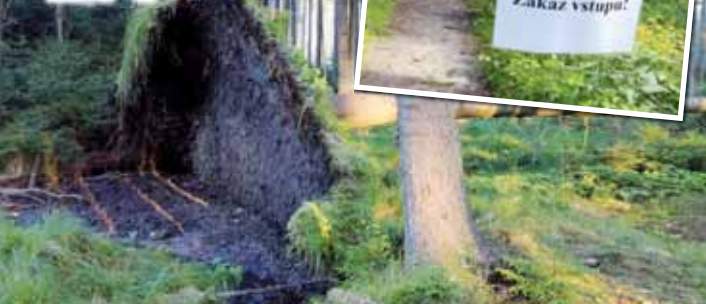
Přestože protivanovští hasiči hned po kalamitě varovali, aby lidé do lesů nechodili a vyhnuli se tak nebezpečí, mnozí se chovají, jako kdybyste jim řekli pravý opak.

zemí,“ popsal. Jiní celou věc zlehčují. „Takových zákazů vám vytisknu. Dobrý nápad, jak odradit lidi, pak tam najet kosou a odvézt si plný