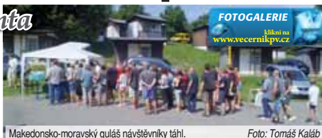
Makedonsko-moravský guláš návštěvníky táhl.

gulášů známý, ale doplněný slogan. A v horkém počasí teklo pivo opravdu proudem. Osmička soutěžních družstev se skládala ze zkušených harcovníků soutěže i úplných nováčků. Zatímco k těm prvním patřil tým z hospody U Kamzíka, premiérová byla účast dvojice kamarádů, z nichž jeden byl téměř místní, z Mostkovic, druhý z Kokor. „Byli jsme sice nachystáni na klasický hovězí guláš, ingredience na vepřový nás trochu překvapily, ale nezaskočily,“ neztvářeli glanc za pečlivého míchání. Naprostým trhákem bylo ale téměř mezinárodní družstvo makedonsko-moravské, které ke svému stánku soustředovalo největší pozornost. „Náš šéfkuchař pochází z Makedonie, takže guláš má trochu ostřejší balkánské základy, zejména moravským korením,“ vysvětlil název Ma-MoGul, tedy Makedonsko-Moravský Guláš mluvčí týmu. Suroviny měly totiž všechny týmy kvůli rovným podmínkám stejné, tedy moravské, recept a dochucení bylo na umění každého kuchaře.