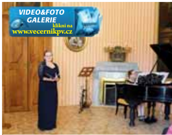
Hned na začátku akce si zaplněný sál zámku vyslechl nádherný koncert pěvkyně za klavírního doprovodu.