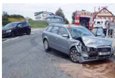
Kvůli řidičské chybě došlo u sjezdu z dálnice D46 ve Vranovicích-Kelčicích k závažné nehodě s těžkými následky. Šest lidí se zranilo, z toho čtyři děti!

VRANOVICÉ-KELČICE Šest zraněných osob, z toho čtyři děti! To jsou fatální následky srážky dvou osobních vozidel, ke které došlo v úterý 22. srpna ve tři hodiny odpoledne u sjezdu z dálnice D46 ve Vranovicích-Kelčicích.