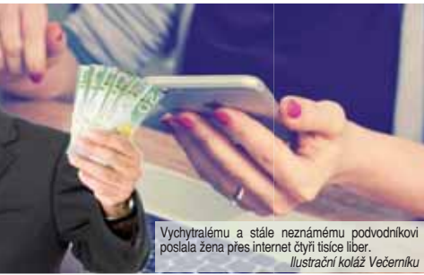
Vychytralému a stále neznámému podvodníkovi poslala žena přes internet čtyři tisíce liber. Ilustrační koláž Večerníku

osoby. Podle předložené legendy zavazadla sám vyzvednout nemohl, protože se účastnil lékařské mise ve válečné zóně v Sýrii,“ uvedl František Kořínek, tiskový mluvčí Policie ČR, územního odboru Prostějov. Původně přátelská služba ale nebyla pro domnělého lékaře, který požadoval dalších 7 650 liber, pojalá žena podezření, že se jedná o podvodu, a celou věc oznámila policistům,“ informoval František