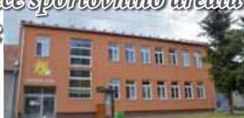
Kapacita školky ve Ptení přestává stačit.