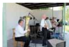
Markovanka zahrála v Určicích dospělým i malým dětem.

URČICE Na sobotní odpoledne si pro obyvatele Určic připravil místní kulturní klub zábavný program s dechovou kapelou Markovanka. Její vystoupení bylo naplánováno na 16 hodin v takzvaném určicím parku.