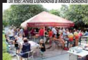
Nedělní poledne strávili hosté Restaurant Day ve velké pohodě a veselí. A s plnými žaludky...