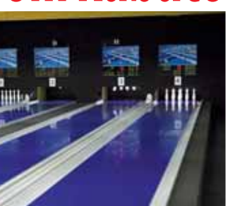
Zbrusu nové dráhy lákají ke hře.