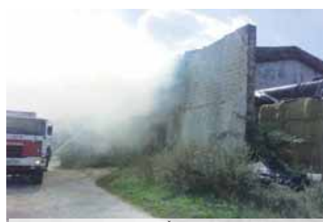
Kvůli svařování ve skladišti slámy došlo ve Štětovicích k obrovským škodám. V objektu shořela sláma za dva miliony korun.

Čtyři jednotky profesionálních a dobrovolných hasičů likvidovaly požár uskladněné slámy v hale ve Štětovicích na Prostějovsku. Jednalo se o stoh z balíků slámy ve zděné budově o rozměrech zhruba 20 krát 15 metrů. „Informaci o požáru převzalo operační středisko Hasičského záchranného sboru Olomouckého kraje krátce před polednem ve středu 23. srpna. K události vyrazila profesionální jednotka požární stanice Prostějov posílena o dobrovolných hasičů z Dubu nad Moravou, Vrahovici a Vrbátek. Pro dostatečnou zásobu vody zřídily jednotky dálkovou dopravu z hydrantové sítě. Po zdoání plamenného hoření hasičské jednotky pokračovaly ve spolupráci s technikou zemědělců v postupném vyklizení