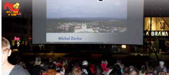
Návštěvnost středního promítání na náměstí T. G. Masaryka předčila veškerá očekávání.

PROSTĚJOV Již v rámci předvolební kampaně vsadila prostějovská Občanská demokratická strana na to, jak vhodně oživit prostějovské náměstí T. G. Masaryka. A „moderním ptákům“ se to povedlo náramně. Filmovou novinku Špunti na vodě sledovalo přes pět stovek diváků!