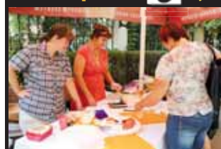
Návštěvníci akce měli k ochutnání na výběr ze stovek pokrmů. Jídlo během hodiny zmizelo.