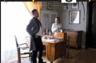
Stovkám návštěvníků se představili i členové různých divadelních spolků.