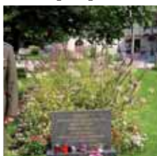
Před devětačtyřiceti lety zastřelili sovětskí vojáci tři občany Prostějova. V pátek jim osobnosti vzdaly hold a připomněly si jejich památku i odkaz budoucím generacím.