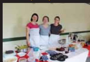
O kulinařské speciality se často staraly celé rodiny. Většina kuchařek vesele pózovala fotografoce Večerníku.