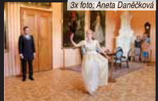
Prohlídka historických kostýmů byla pro návštěvníky velkým lákadlem.