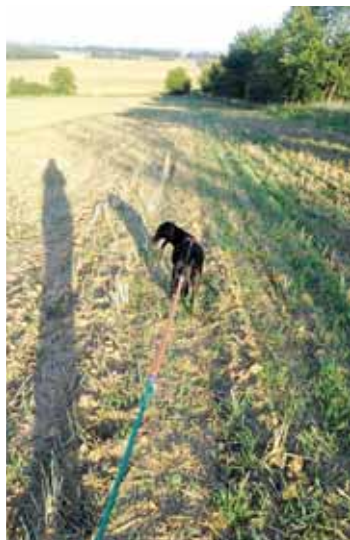
Krutý majitel se měl zbavit štěněte jezevčíka. Lidé v okolí ohrozimského kopce po něm pátrali i se svými psy. Někteří to vydrželi celých osm hodin.

pouze ke zviditelnění některého z uživatelů. Ať tak či onak, všichni, kteří se však zapojili do pátrání po vyhozeném štěněti jezevčíka, si mohli společně s hlavním hrdinou filmu Přelet nad kukaččím hnízdem Randlem McMurphy říct: Alespoň jsme to zkusili... (mls)