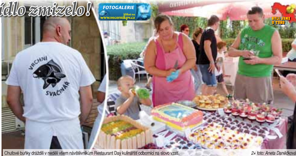
Chufové burky dráždily v neděli všem návštěvníkům Restaurant Day kulinařští odborníci na slovo vzali.

Hodování začalo už v 11 hodin dopoledne a mělo pokračovat až do 14 hodin. „Pokaždé se sem moc těším, už se tu mezi sebou dobře známe, dokonce i s těmi, co přichá-