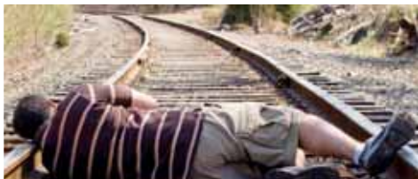
Pokud by strážníci rychle nepřišli na místo, opilého sebevraha by přejel vlak. Ilustrační foto.

PROSTĚJOV Předminulou neděli měli strážníci městské policie i lékaři záchranky pořádný fofr. Totálně opilý muž zavolal na tísňovou linku, že stojí u koleji na železničním přejezdu ve Vrahovické ulici a skočí pod vlak! Tim-toc oznámením plným zoufalství nastartoval složky integrovaného záchranného systému.