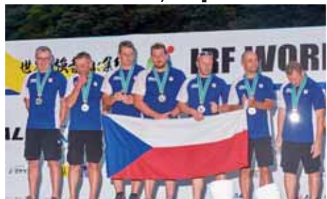
Pět cenných kovů včetně tří stříbrných získali v Japonsku veteráni (vlevo), dvě bronzové plakety přidali muži (vpravo).