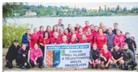
V SJ si ze závodů na přehradě odnesla dvě první a dvě druhá místa.

Vrahovická sací jednotka je tým složený z více než šedesáti lidí, který reprezentuje Prostějovsko na různých závodech po celé ČR a trénuje jednou až dvakrát týdně. Vyvrcholením letošního sezóny byl závod na „domácí půdě“ na plumlovské přehradě, kde se soustředilo na vzdálenosti 200 metrů a 1000 metrů. A jak vše dopadlo? V SJ mix, tedy tým složený z šestnácti mužů a čtyř žen i bubence, vybojoval ve své kategorii 1. místo na 200 metrů a 2. místo na 1000 metrů. V SJ women, tedy samé dívky a ženy, vybojovaly ve svých ženských kategoriích 2. místo na 200 metrů a 1. místo na 1000 metrů. A