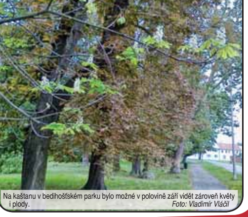
Na kaštanu v bedihoštském parku bylo možné v polovině září vidět zároveň květy i plody.