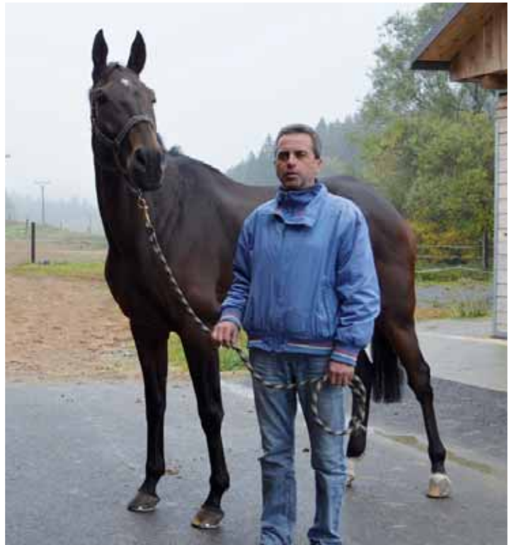
Dostihový stáj Na srdéčku rozhodně není pouze o Nikasovi, který se díky svým úspěchům zatím nejviditelněji zapsal do její historie. Už letos se však ukázali jeho následovníci.