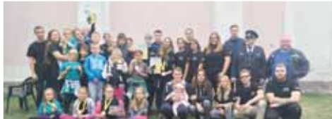
Tým „A“ mladších žáků z Krasic dokázal doma zvítězit, tým „B“ skončil osmý. Mezi staršími žáky skončili domácí na šestém místě.

PROSTĚJOV V parku kostela svatého Josefa Krasicích se předminulou sobotu 2. září konaly závody mladých hasičů pohár starosty SDH Krasice. vítězství se kate-