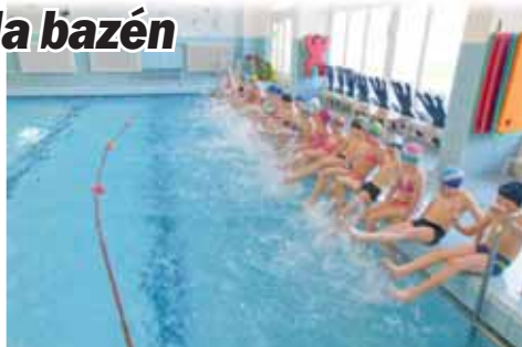
Bazén na „základce“ v ulici Dr. Horáka je oblíbený a dětmi hojně využíván.

PROSTĚJOV Tohle by mohlo být hodně nebezpečné. Při pravidelné kontrole kvality vody bylo ve sprchách u bazénu školy Dr. Horáka objeveno zvýšené množství Legionelly. Bakterie může v některých krajních případech způsobit smrtelně nebezpečnou tzv. legionářskou nemoc. Vedení školy již udělalo všechny kroky potřebné k nápravě. Dopadnou-li výsledky opakovaných měření dobře, bude bazén už tento čtvrtek opět zpřístupněn.