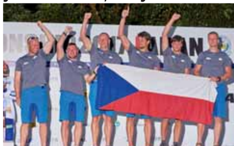
Pět cenných kovů včetně tří stříbrných získali v Japonsku veteráni (vlevo), dvě bronzové plakety přidali muži (vpravo).