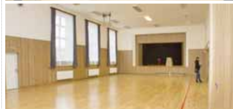
Sokolovna v Čechovicích opět slouží. Práce na obnově se dotýkaly přístavby hlavního sálu a první etapy rekonstrukce.