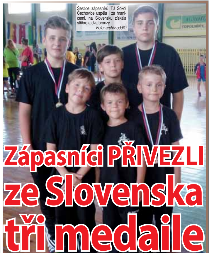
Šestice zápasníků TJ Sokol Čechovice uspěla i za hranicemi, na Slovensku získala stříbro a bronz.

vyjždět na závody. Naše juniorská posádka funguje již třetím rokem a jejich výsledky jsou neuvěřitelné. Více o našich činnostech se můžete dozvědět na stránkách vsjwebnem.cz nebo na Facebooku,“ napsala do redakce Večerníku za celou V SJ kapitánka žena a trenérka dračat Zuzana Nedomová. (red)