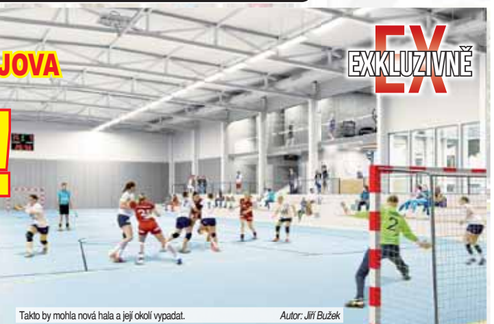
Takto by mohla nová hala a její okolí vypadat.