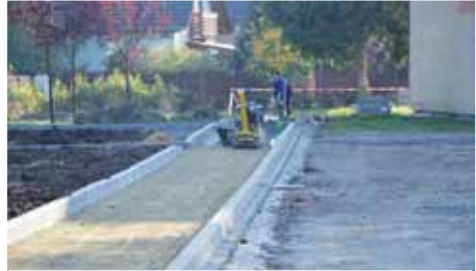
Na náměstí Odboje se budují zbrusu nové chodníky. Přibude zde i rozsáhlá sadová úprava.