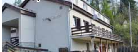
Zatímco občané Stražiska objekt v centru města vnímali jako sídlo kriminálních živlů, majitelka jej prezentovala jako dům poslední záchrany pro lidi v nesnáších.