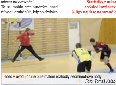
Hned v úvodu druhé půle málem rozhodly sedmimetrové hody.