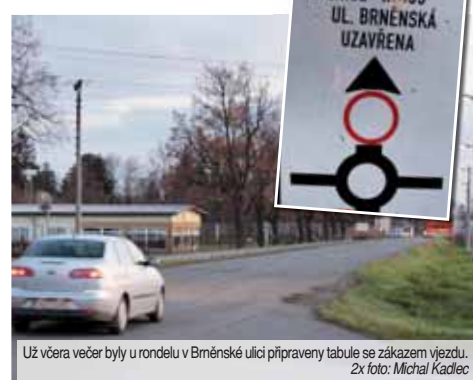
Už včera večer byly u rondelu v Brněnské ulici připraveny tabule se zákazem vjezdu.