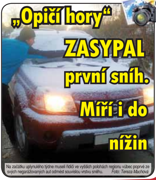
Na začátku uplynulého týdne museli řidiči ve vyšších polohách regionu vůbec poprvé ze svých negaržovaných aut odmést souvislou vrstvu sněhu.

V průběhu uplynulého týdne sice převládly spíše mlhy a dešť, nicméně již během následujících dní bychom se souvislejšího sněžení a teplot kolem bodu mrazu měli dočkat nejen na „opičích horách“, ale i v samotném Prostějově. Tak už se těšme!