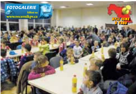
Toto jsou budoucí naděje prostějovského fotbalu.

Právě spolupráce klubu se sousední ZŠ E. Valenty a Gymnáziem Jiřího Wolke-