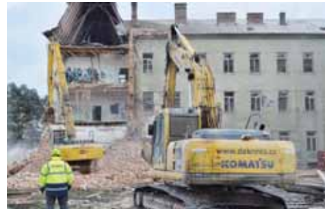
S demolicí Jezdeckých kasáren se hodně spěchalo. Nyní se ale zdá, že uvolněný pozemek bude ležet ještě dlouho ladem.

Večerník už v létě loňského roku získal vizualizaci budoucího uspořádání nových domů, sportovního zařízení i rozlehlého parku. „Souběžně s ubytovnou v ulici Šárka, které říkáme ‘Parlament’, budou postaveny čtyři bytové domy sociálního charakteru s dotovaným náměstím. Uprostřed plochy vznikne velký park, který bude volně napojen na botanickou zahradu a dále na Spitznerovy sady. Vznikne tak obrovská zelená plocha, větší než současná Smetanovy sady,“ prozradil v červenci loňského roku Zdeněk Fišer, první náměstek primátorky statutárního města Prostějova. „Zrekonstruujeme také památkově chráněnou jízdrnu, na jejíž pozdější využití je už zpracováno několik studií. Může z ní být knihovna, či jiné společenské zařízení. A napojena bude na novou tělocvičnu, kterou podle