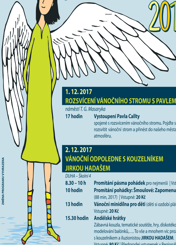
ZMĚNA PROGRAMU VYHRAZENÁ