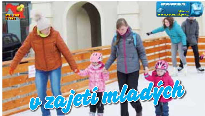
Na kluzišti se vydáří drobtina i rodiče.