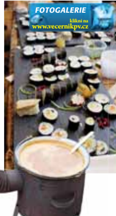
Sobotní dopoledne patřilo v Národním domě v Prostějově opět akci Restaurant Day. Jako vždy nabídl paletu chutí a vůní.