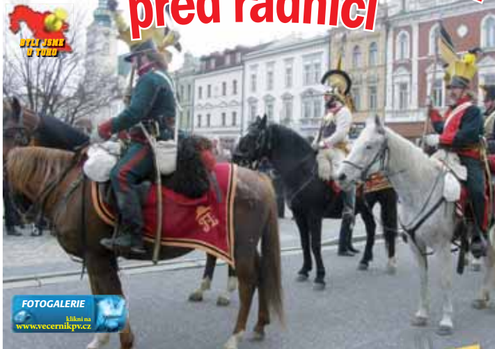
Kromě hulánů dorazili i rakouský kyrysník (uprostřed) a ruský kozák (zoela vpravo).