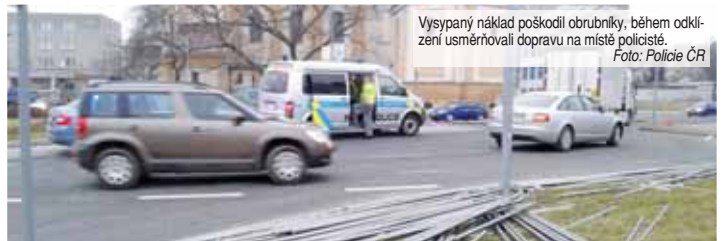
Vysypání nákladu poškodilo obrubníky, během odklizení usměrňovali dopravu na místě policisté.