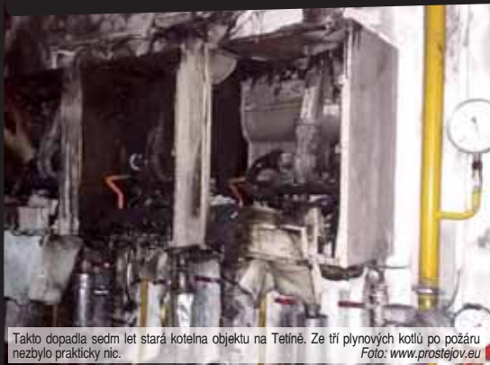
Takto dopadla sedm let stará kotelna objektu na Tetíně. Ze tří plynových kotlů po požáru nezbylo prakticky nic.