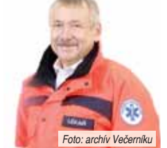
Foto: archiv Večerník ●● Podle všeho nás nyní čeká mrazivé období. Na co by si lidé s ohledem na své zdraví měli dávat největší pozor? „Je třeba se dobře oblékat, raději více tenkých vrstev oblečení, rukavice a čepice, pozor na omrzliny okrajových částí těla. Mějme také na paměti, že požívání alkoholu v mrazivém počasí zvyšuje riziko podchlazení a při náledí mohou na pády a z nich pramenící zlomeniny.“

sem byl uvolněn pro výkon veřejné funkce. Z toho plyne, že jsem neztratil kontakty s odborností a také jsem chodil jako anesteziolog na operační sál. Takže žádný problém. A jsem rád, že jsem opět ve svém městě, mezi lidmi, která léta znám, mohu se více věnovat své odbornosti a také své rodině“ ●● Co se po sedmi letech vaší nepřítomnosti na prostějovské záchrance změnilo? „V podstatě nic převratného. Přišli samozřejmě noví kolegové a kolegyně. Co se týká techniky, máme dvě nové sanitky, přístroj na nepřímou srdeční masáž a několik dalších přístrojů i zařízení. Samotná