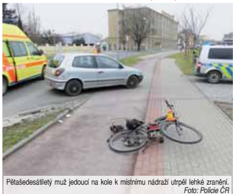
Pětašedesátiletý muž jedoucí na kole k místnímu nádraží utrpěl lehké zranění.

PROSTĚJOV Předminulý pátek 12. ledna před třináctou hodinou došlo ve Sladkovské ulici k dopravní nehodě osobního automobilu s pětádesátiletým cyklistou. Srazka skončila naštěstí „pouze“ lehkým zraněním seniora na bicyklu... „Čtyřiašedesátiletý řidič automobilu značky Fiat se při odbočování na parkovišti ležící mimo komunikaci bokem vozidla střetl s cyklistou jedoucím po cyklostezce podél komunikace“, popsal kolizi