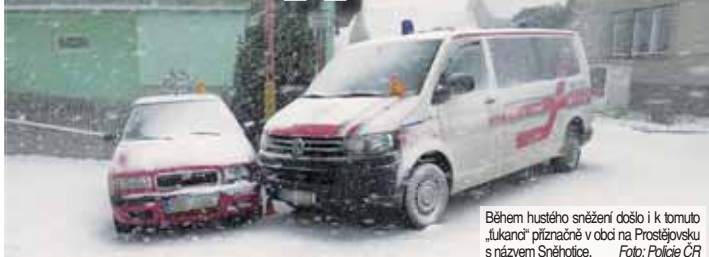
Během hustého sněžení došlo i k tomuto „lukanci“ příznačné v obci na Prostějovsku s názvem Sněhotice.