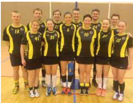
Korfbalový tým SK RG Prostějov v tomto složení přivezl z Českých Budějovic dva cenné body.

To pochopitelně znamenalo novou dávku motivace do odvety, ovšem ta výběru SK herně sedla mnohem hůře. Tentokrát šli hned v úvodu do vedení domácí a v podstatě celou dobu vývoj utkání kontrolovali. Hosty nenechali přiblížit na méně