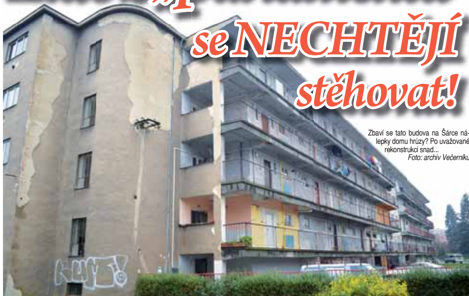
Zbaví se tato budova na Šárce nálepky domu hrůzy? Po uvažované rekonstrukci snad...

PROSTĚJOV Na střeďeční tiskové konferenci prostějovští radní poprvé přiznali, že spřádají plány na rekonstrukci nájemního sociálního domu v ulici Šárka, kterému nejen místní říkájí „PARLAMENT“. V této zvenci odpudivě vypadající nemovitosti v majetku Domovní správy Prostějov obývají sociálně slabší lidé celkem devadesát bytů. A podle všeho by se mohli konečně dočkat lepších podmínek.