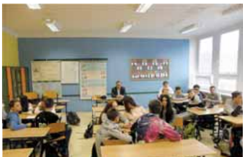
Dvě desítky žáků osmých tříd ZŠ v ulici E. Valenty během programu „To je zákon, kámo!“

PROSTĚJOV Aby účinky protidrogové prevence byly co největší, připravil nadační fond Nové Česko program s názvem „To je zákon, kámo!“