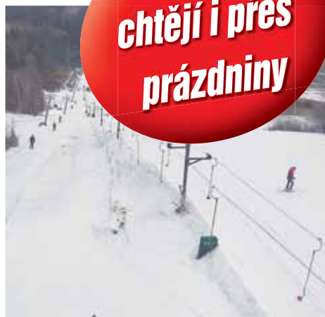
Vyšší teploty sice daly sněhu v Kladkách zabrat, na sjezdovce se však stále drží.

KLADKY Prostějovští školáci si v nadcházejícím týdnu budou užívat jarních prázdnin. Vyrazit během nich mohou i do jediného lyžařského areálu v regionu. Přestože obleva z posledních dní se sněhem v Kladkách rádně zamávala, na sjezdovce stále drží. V uplynulém týdnu panovaly ve zdejších areálu pro lyžování velmi dobré podmínky. „Obleva je jasně znát, nicméně máme štěstí, že u nás nepršelo. Snůh na sjezdovce je v současné době udusany a upravený. Věříme, že vydrží po celý následující týden, nesmí však moc pršet," vyjádřil se exkluzivně pro Večerník Jiří Křeček, předsesta kladeckých sokolů, kteří ski areál provozují. Sezona v Kladkách se letos ve srovnání s těmi předchozími protáhla. Například loni se tu končilo už v neděli 26. února. Provozovatelům se díky tomu budou alespoň částečně kompenzovat ztráty z tepleho