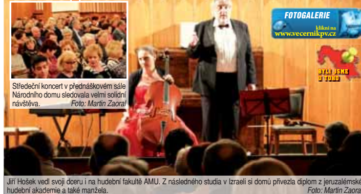
Středeční koncert v přednáškovém sále Národního domu sledovala velmi solidní návštěva.