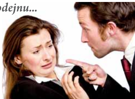
Muž si přišel vyřizovat účty se svojí bývalou partnerkou do jejího zaměstnání. Za to nyní může jít i do vězení. Ilustrační foto

Okolnosti však přispěly k tomu, že chování zhrzeného milence nebude řešit jen přestupková komise. Druhý den totiž rabíat přišel do stejné prodejny znovu!