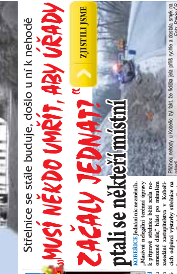
MUSÍ NĚKDO UMRÍT, ABY ÚŘADY ZAČALY JEDNAT? Zjistili jsme, proč se některé místní střelnice nedostavily. Je to kvůli nedostatku financí a neochotě úřadů. Úřady by měly být více ochotny spolupracovat s občanskými organizacemi.

Střelnice se stále buduje, došlo u ní k nehodě. Úřady by měly být více ochotny spolupracovat s občanskými organizacemi. Je to kvůli nedostatku financí a neochotě úřadů. Úřady by měly být více ochotny spolupracovat s občanskými organizacemi.