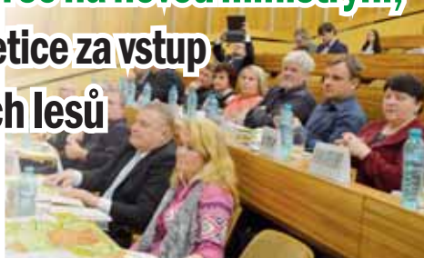
Na setkání s tehdejšími ministrem dorazili zástupci všech dvaadvacet dotčených obcí. Někteří byli s ústupky armády spokojeni více, jiní méně.

„Nechceme být vězni ve vlastních podmínkách vstupu osob do vojenského újezdu Březina, které od začátku roku 2016 zcela zamezily výjezdům takzvaných povolenek. Díky nim měli lidé z obcí ležících na okraji újezdu do okolních lesů umožněn vstup. Následně vznikla petice, která se setkala se značným ohlasem. V polovině listopadu 2016 bylo shromážděno celkem