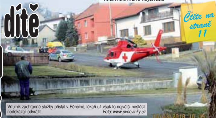
Vrtulník záchranné služby přistál v Pěncíně, lékaři už však to největší neštěstí nedokázali odvrátit.