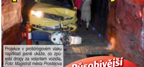
Projekt ve protidrogovém vlaku například jasně ukáže, co způsobí drogy za volantem vozidla.

PROSTĚJOV Do Prostějova opět po roce přijede protidrogový vlak s jarním programem Revolution Train. Zapojením všech lidských smyslů prostřednictvím patentových metod 5D chtějí organizátoři maximálně zapůsobit na osobnost návštěvníka vlaku a efektivně ovlivnit jeho pohled na zdravý životní styl i prevenci závislostního chování. Protidrogový vlak bude k vidění na hlavním nádraží v Prostějově již tento čtvrtek 22. března.