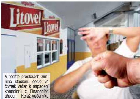
V těchto prostorách zimního stadionu došlo ve čtvrtek večer k napadení kontrolorů z Finančního úřadu. Kolář Večerníku

PROSTĚJOV Tohle bude mít velké následky! V prostorách Víceúčelové haly zimního stadionu v Prostějově došlo uplynulý čtvrtek večer k neuvěřitelnému incidentu. Během hokejového utkání mezi prostějovskými Jestřábky a kladenskými Rytyři podnikli kontrolori z Finančního úřadu v Prostějově razii v prostorách vestibulu. V momentě, kdy „finančáci“ zabavovali suvenýry prodáváné obsluhou stánku bez jakýchkoliv potvrzení a finanční prostředky stržené z prodeje, jim začala sprostě nadávat skupinka přihlížejících návštěvníků. A nejen to! Po chvíli se slovní ataky změnila v agresivní chování a lidé se do obou kontrolorů z bernáku pustili i fyzicky. Výsledek? Pracovnice Finančního úřadu skončila v nemocnici!