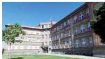
Univerzita Tomáše Bati před šesti lety opustila tuto opravenou budovu na Husově náměstí, do níž se následně přestěhovala střední škola Art Econ.

Bezprostředně po konci zlínské školy se hovořilo o tom, že by se do Prostějova mohla přesunout Masarykova univerzita v Brně. Tyto plány však vzaly za své.