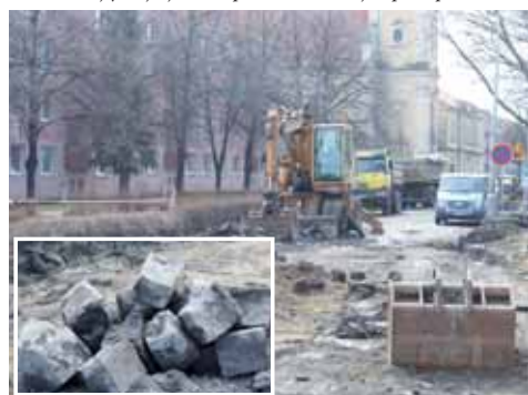
V první etapě rekonstrukce Brněnské ulice pracují dělníci podle plánu. Při frézování vozovky narazili i na historickou dlažbu.