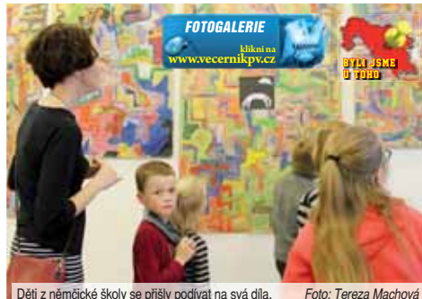
Děti z německé školy se přišly podívat na svá díla.

Výstava Obrazová řecká mytologie výtvarného oboru německé ZUŠ obsáhla neskutečné množství výjevu, na nichž se podílelo zhruba šest desítek dětí ve věku od pěti do osmácti let. Na stěnách visely obrazové malby a kresby, ale i komiksy, knížky, koláže nebo gladiátorské helmy a dobové