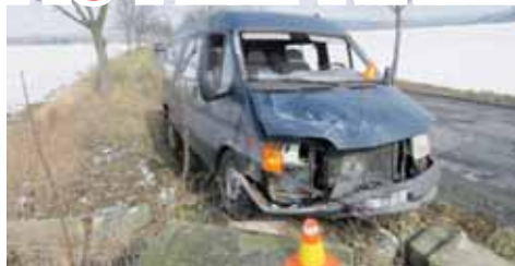
Zničením kříže vedle silnice mladý řidič způsobil škodu za dvacet tisíc korun. Kdo ale kříž znovu postaví?

KRUMSÍN To si u věřících občanů hodně „polepil“. Mladý řidič za volantem dodávkového automobilu minulou středu nezvládl řízení na silnici u Krumsína a v příkopě povalil a zničil kříž!