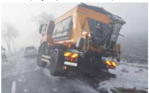
Na silnici za Výšovicemi, která se letos bude opravovat, došlo před třemi lety k sérii nehod. Jedna z nich skončila tragicky, v příkopu uvízli i sypač.

investovat také z evropských dotačních programů. Pokud v letošním roce Státní fond dopravní infrastruktury opět poskytne finance na silnice druhých a třetích tříd, mohlo by hejtmánství získat na jejich opravy dalších 254 milionů korun.