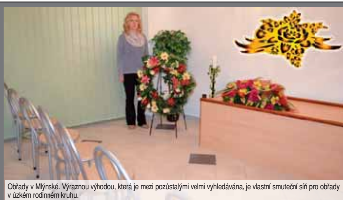
Obrady v Mlýnské. Výraznou výhodou, která je mezi pozůstalými velmi vyhledávána, je vlastní smuteční síň pro obrady v úzkém rodinném kruhu.