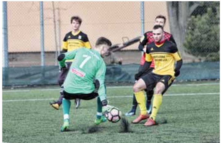
V přípravě využili prostějovští fotbalisté také domácí umělku. Čtvrteční ostrý start by se už měl odehrát na přírodní trávě, pokud počasí nebude proti.

V zimní přípravě se Uničovu dařilo se střídavými úspěchy. Zpočátku se mu proti silnějším soupeřům, mezi nimiž nechyběly Vítkovice nebo Znojmo, příliš nedařilo. Povzbudi- vější výsledky se objevily až v závěru, v němž si Uničovští otestovali sílu na divizních soupeřích. Kromě Krče je v týmu další hráč, který navlékal pro-