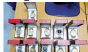
Strážníci zabavili prodejci tyto hodinky, za přestupek proti tržnímu řádu města dostane cizinec zřejmého pokutu.

PROSTĚJOV Hodinky pochybného původu prodával uplynulý pátek ráno přes supermarketem v Plumlovské ulici cizí státní příslušník. Tím si ale zadělal na problém. Strážníci ho zadrželi a hodinky mu odebrali.