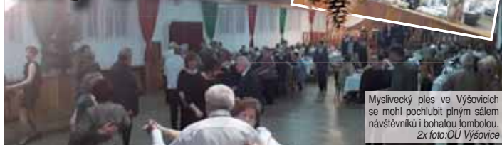
Myslivecký ples ve Výšovicích se mohl pochlubit plným sálem návštěvníků i bohatou tombolou. Zx foto:OU Výšovice

VÝŠOVICE Plesová sezóna nezadržitelně míří ke svému konci. Jeden z posledních uspořádal Myslivecký spolek Diana Výšovice. V tamním kulturním se sešlo bezmála na dvě stovky hostů. Přestože se v bohaté tombole objevila řada zvěřinových cen, hlavní náplň sdruzení jsou převážně sportovní střelba a pořádání soutěží. Poděkování patří všem sponzorům a organizátorům plesu a zejména pak starostům obcí Výšovice a Vřesovice, kteří podporují i činnost spolku. (red)