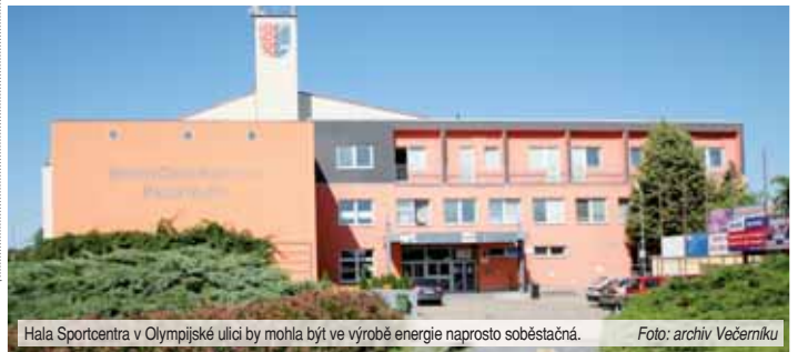
Hala Sportcentra v Olympijské ulici by mohla být ve výrobě energie naprosto soběstačná.

Přípravná projektová dokumentace tak má dát odpovědi na otázky ohledně únosnosti konstrukce střechy Sportcentra v Olympijské ulici i na to, jaký druh elektrárny s ohledem na výkon je potřeba pořídit. „Musíme znát technické způsobilosti a rozsah nutných úprav pro možnost využití takové elektrárny, která zaručí energetickou soběstačnost,“ řekl dále Fišer a doplnil, že projekt musí mimo jiné zohlednit uchování vyrobené elektřiny v bateriovém úložišti, návratnost investice a také dotáční možnosti. (mik)