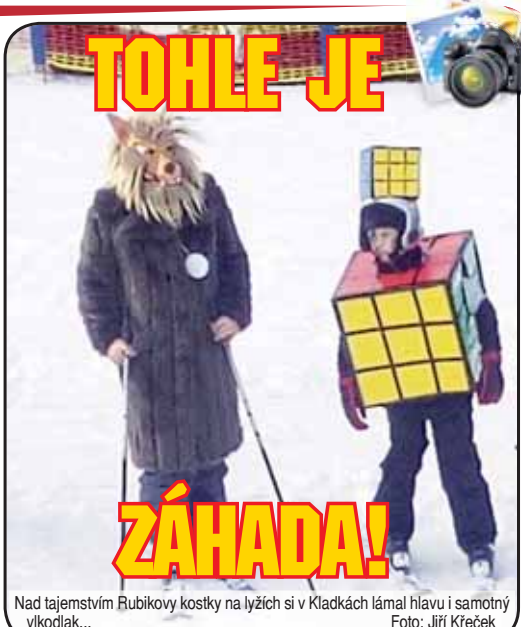
Nad tajemstvím Rubikovy kostky na lyžích si v Kladkách lámal hlavu i samotný vkladak...