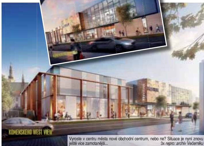
Vyrostle v centru města nové obchodní centrum, nebo ne? Situace je nyní znovu ještě více zamotanější...