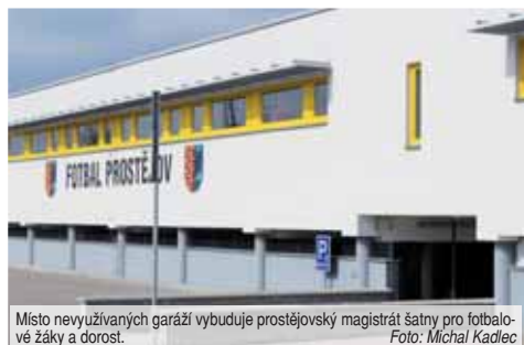
Místo nevyužívaných garáží vybudoje prostějovský magistrát šatny pro fotbalo- vé žáky a dorost.