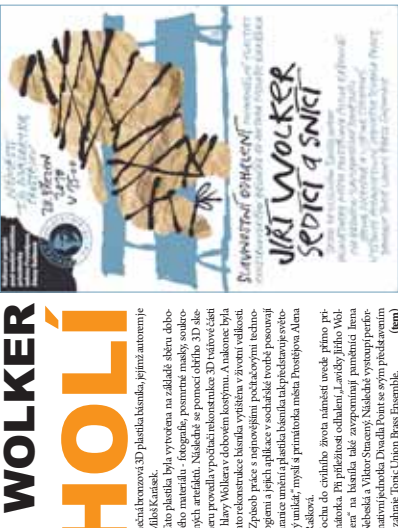
PROJEKT WOLKER VRC HOLÍ ... jaký byl koncert Jarka Nohavici... ... jaký byl koncert Jarka Nohavici... ... jaký byl koncert Jarka Nohavici...