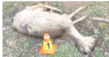
Smra tvrdou srážku u Smrčice nepřežila, předtím ovšem na autě způsobila značnou škodu.