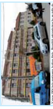
V roce 1904 byla postavena budova školy. Rozšířila rekonstrukce by se měla do jara 2018 připravit dílnu dřevěnou výtahov. Foto: Martin Zboral

ZISTIL JSME PTENÍ Tak tato budova opravu pro konkrétní účel. V roce 1904 byla postavena budova školy. Rozšířila rekonstrukce by se měla do jara 2018 připravit dílnu dřevěnou výtahov. Foto: Martin Zboral