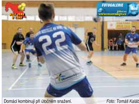
Domáci kombinují při útočném snažení.

také nejlepší herní pasáže domácích, v nichž mohli pomýšlet na dobrý výsledek. Ještě do poločasu se ale karta začala obracet. V posledních čtyřech minutách domácí prohodili dvoubankový náskok a v poločase svítlo na tabuli jednobrankové manko. Po v první pětminutovce druhé půle díky efektivité střelby navyšila Telnice až na pět branek. Díky změně organizace obrany i dobrým zásahům brankáře Navrátila se ovšem domácí šňurou čtyř branek dostali na dostřel. Rozdíl dvou až