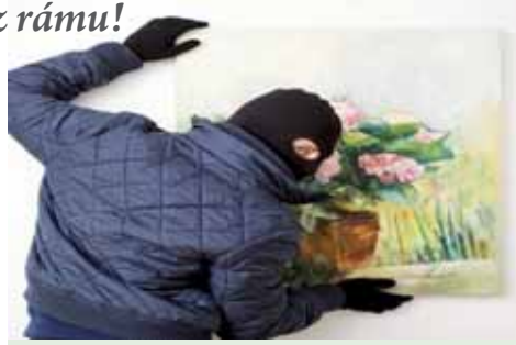
Zadrženy muž přiznal, že obraz ukradl kvůli hladu. Proč se ale vracel na místo činu, to už neovysvětlil... Ilustrační foto

systémem. „Policisté tak věc na místě zadokumentovali a odjeli ji zpracovat administrativně," přidal Kořinek. O tom, že případ nebude zase až tak složitý, se policisté přesvědčili záhy. „Přibližně za dvě a půl hodiny jsme přijali oznámení, že pachatel se vrátil na místo činu, kde byl přichycen. Po opětovném příchodu na místo policisté zjistili, že zadrženy je pětadeřítiletý muž z obce na Prostějovsku. Ten se k činu dozvěděl a policisté u něj zjistili i odcizené plátno. Jako motiv muž uvedl, že si chtěl koupit jídlo. Provedenou dechovou zkouškou u něj naměřili hodnotu 2,45 promile alkoholu v dechu," konstatoval mluvčí prostějovské policie.