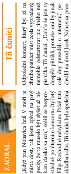
Tři čuníci Okleblíhí koncert, který byl až na závěr tak jako vždy, ale na scéně nemohlo odstartovat, nic jiného než kam dříve za něj, světlé se bezpo-... stěbné po úterním koncertu čtyřky dopředu, přičítají, protože on by jinak... cke čtyři prosadili v interu, po-... chválil na tvůrce Nohavici.