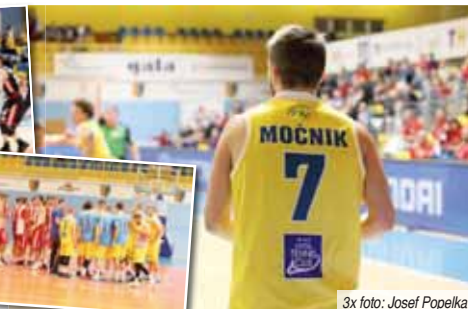
3x foto: Josef Popelka

Právě nejbližší tři zápasy rozhodnou o tom, zda se tým posune v tabulce ze