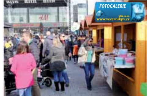
Kromě kulturního a společenského programu mají návštěvníci Velikonočního jarmarku 2018 v Prostějově k dispozici i stánky s rozličným sortimentem.