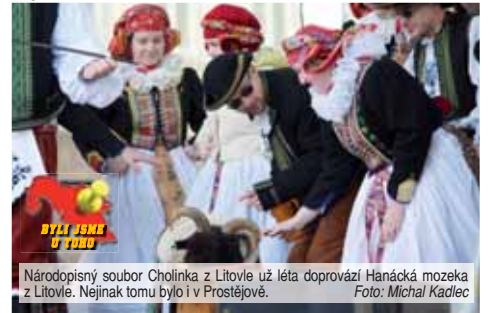
Národopisný soubor Cholinka z Litovle už léta doprovází Hanácká mozeka z Litovle. Nejnak tomu bylo i v Prostějově.