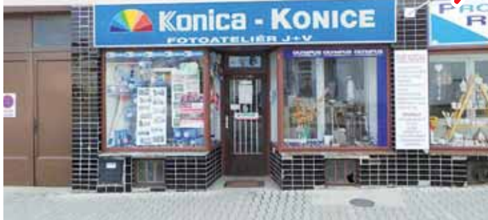
Fototelefon J + V Tylšarovi působil na náměstí v Konici šestnáct let, nyní už na jeho místě funguje obchod s domácími potřebami.