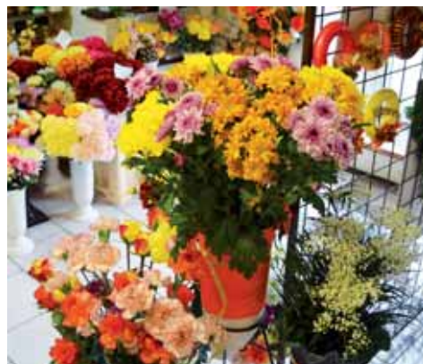
V provozovně Soukromé pohřební služby Václavková a spol. v Mlýnské ulici v Prostějově jsou nabízeny také hřbitovní doplňky a květiny.