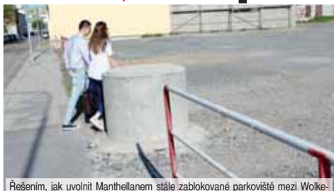
Řešením, jak uvolnit Manthellanem stále zablokované parkoviště mezi Wolkerovou a Komenského ulicí, je odstranění „městské“ zábradlí.