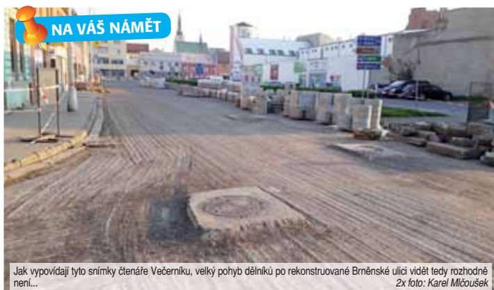
Jak vypovídají tyto snímky čtenáře Večerníku, velký pohyb dělníků po rekonstruované Brněnské ulici vidět tedy rozhodně není...