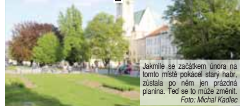
Jakmile se začátkem února na tomto místě pokácel starý habr, zůstala po něm jen prázdná planina. Ted se to může změnit.

Už tehdy byl ovšem ale nejen Večerník překvapen tím, že není za pokácený habr na prostějovském náměstí žádná náhrada! „Samozřejmě jsme