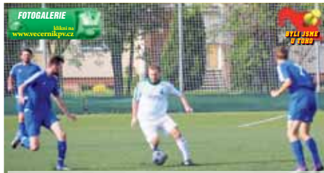
Rychlá a přímočará hra mezi obránci v podání hráče Hané

Poprve se rozvlnila síť ve dvanácté minutě, když se trefil prostějovský Zdeněk Kaprál - 1:0. Haná byla nadále aktivnější a technickou střelou ze střední vzdálenosti orazil kovář Vyskočil tyč. Díky široké hře se domácí lehce dostávali blízko k brance, ale skoro všechny pokusy nezaměřili přesně mezi tyči tře. Pivín zvládl skóre utkání srovnat v 29. minutě gólem Trajera. Celá kombinace začala už na polovině Pivína a po centru z pravé strany přišla skákavá přihrávka z první přímo do běhu. Brankář domácích neodhadl razanci přihrávky, zakřičel na obránce, že jde po míči, ale útočníci hráč byl u balonu dříve a z bezprostřední blízkosti se nezmy-