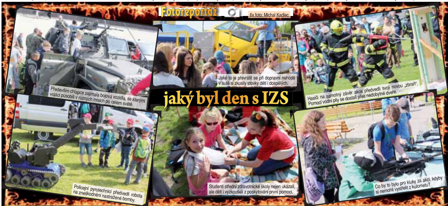
Především chlapec zajímal bojová vozidla, se kterými vojáci působili v různých misích po celém světě.