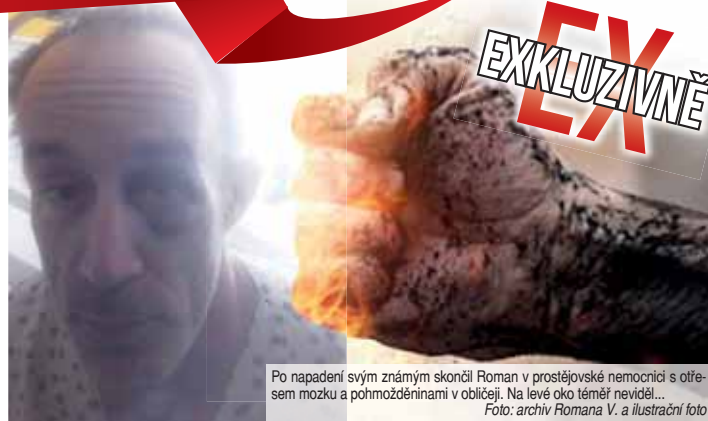
Po napadení svým známým skončil Roman v prostějovské nemocnici s otřesem mozku a pohmožděninami v obličeji. Na levé oko téměř neviděl...

Bezdomovec nebere prášky „na hlavu“ a útočí na ostatní