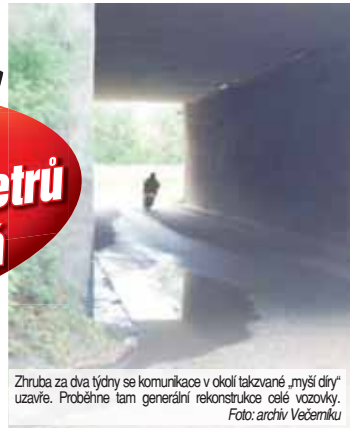
Zhruba za dva týdny se komunikace v okolí takzvané „myší díry“ uzavře. Proběhne tam generální rekonstrukce celé vozovky.