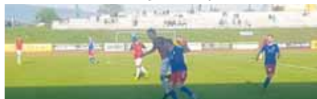
Za stavu 0:4 už ve Valašském Meziříčí dostala hra klidnější ráz.

PROSTĚJOV Už na pět bodů se rozrostl po uplynulém víkendě náskok 1.SK Prostějov v čele Moravskoslezské ligy. Stalo se tak díky pátému vítězství eskáčka na Valašsku a poměrně překvapivě porážce druhého Velkého Meziříčí v Petřkovicích. A jelikož zaváhala i Kroměříž v Hodoníně, kde jen remizovala, Hanácká Slávia ztrácí ze třetího místa již sedm bodů. Zápas prvního z konkurentů je ale na druhé straně důrazným varováním před domácími utkáními eskáčka právě s Petřkovicemi. A pozor, to se hraje již v pátek 4. května od 17:30 hodin!