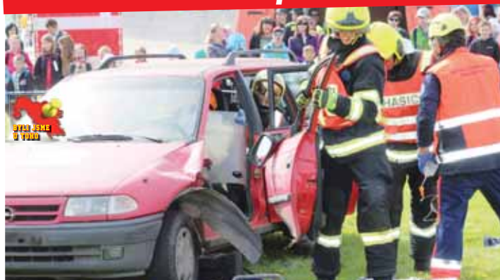
Sedmnáctý ročník Dne s integrovaným záchranným systémem přinesl spoustu atraktivních ukázek, přes dva tisíce dětí opouštělo velodrom spokojeno.

Na ukázky byli zvědaví i dospělí, bude velodrom příště stačit?