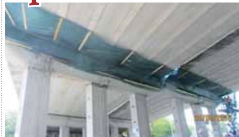
Ředitelství silnic a dálnic již na některých dílech estakády Haná nainstalovalo ochranné sítě proti spadu omítky i betonu. Bude to ale stačit?