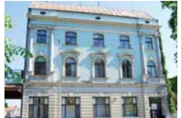
Rekonstrukce Domu dětí a mládeže na Vápenici je zatím omezena pouze na obnovu uliční části. Výstavbu tělocvičny ještě nepovolil stavební úřad.