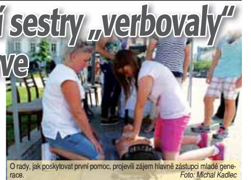
O rady, jak poskytovat první pomoc, projevil zájem hlavně zástupci mladé generace.