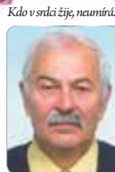
Kdo v srdci žije, neumírá.

UZÁVĚRKA ŘÁDKOVÉ INZERCE JE V PÁTEK 15. ČERVNA V 10.00 HODIN