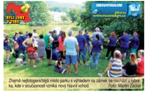
Zřejmě nejfotogeničtější místo parku s výhledem na zámek se nachází u rybníka, kde v současnosti vzniká nový hlavní vchod.

ku, jejichž stáří se počítá na stovky let,“ upozornil všechny. Lidem se komentovaná procházka parkem musela líbit. „Náš průvodce mluvil s velkým zaujetím. Bylo jasné, že to tady díky své práci nejen perfektně zná, ale navíc to tu má i hodně rád,“ poznamenal jeden z návštěvníků. Na komentovanou prohlídku parku můžete vyrazit i po skončení Víkendu otevřených zahrad, kdy byl vstup zdarma. Kromě toho se aktuálně můžete těšit na koncert Lenky Filipové a jejich hostů, který se tam bude konat už ve čtvrtek 28. června.