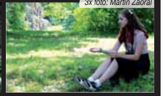
Ve stínu javoru rostouchoho na umělé navršeném pahorku se krásně odpočívá.