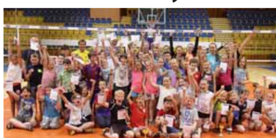
Minivolejbalové boje na hřištích a nadšení bylo k vidění na Poháru VK Prostějov 2018 nelicencované.