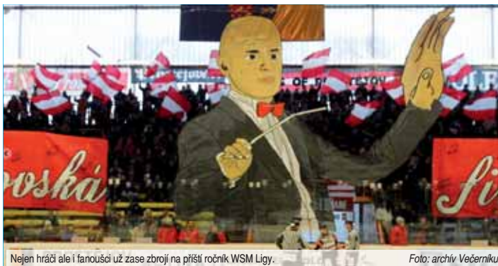
Nejen hráči ale i fanoušci už zase zbrojí na příští ročník WSM Ligy.

stane čas pro semifinále a od pátku 29. března zahájí dva nejlepší týmy WSM Ligy souboje s dvěma nejhoršími týmy extraligy.