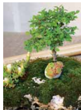
Bonsaje jsou nádherné na pohled, ale jejich pěstování je nesmírně obtížné. Přidáním mchu a podobných věcí dosáhneme lepšího estetického výsledku.

Další výstavu můžete navštívit 11. a 12. srpna ve Slatinicích.