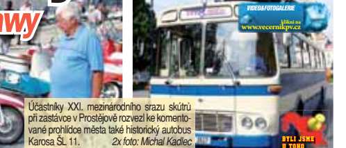
Účastníci XXI. mezinárodní srazu skútrů při zastávce v Prostějově rozvěli ke komentované prohlídce města také historický autobus Karosa ŠL 11.

Ještě během pátečního dne účastníci srazu přešli se svými historickými skútry z Prostějova do Skalky a zpět do Plumlova, kde je čekal večerní program. V sobotu pak společně odjeli do Čech pod Kosířem, kde se uskutečnila další veřejná expozice skútrů.