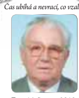
Čas ubíhá a nevrací, co vzal...

Kdo jste ho znali, vzpomínejte s námi, rodina.