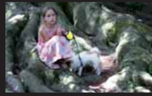
Kořeny tohoto buku členovitého patří vůbec k nejpočetnějším místům v celém parku.