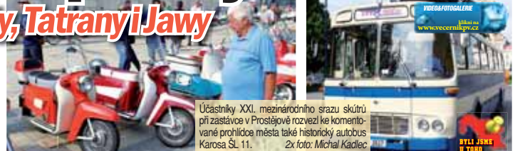
Účastníci XXI. mezinárodní srazu skútrů při zastávce v Prostějově rozvěli ke komentované prohlídce města také historický autobus Karosa ŠL 11.