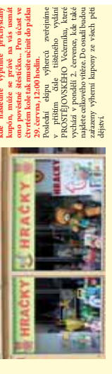
Soutěž byla velmi úspěšná, protože všude byli vítězi. Hráči byli velmi úspěšní, protože všude byli vítězi.

SOUTĚŽNÁ OTÁZKA PRO 5. KOLO ŽNÍ: KŘEMÍLEK A . Soutěž byla velmi úspěšná, protože všude byli vítězi. Hráči byli velmi úspěšní, protože všude byli vítězi.