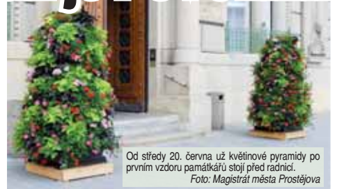
Od středy 20. června už květinové pyramidy po prvním vzdoru památkářů stojí před radnicí.

„Obdrželi jsme od památkářů negativní stanovisko k záměru instalovat u vchodu do radnice dvě květinové pyramidy, které tu stály už vloni a lidé si je pochvalovali, uvedla před měsícem Ivana He-