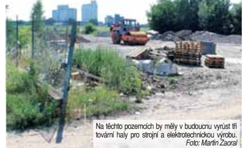
Na těchto pozemcích by měly v budoucnu vyrůst tři tovární haly pro strojí a elektrotechnickou výrobu.

Z předložených dokumentů vyplývá, že by tam mělo najít uplatnění 438 technických a 305 administrativních pracovníků. Bude za současné situace možné v Prostějově sehnat dostatečné množství kvalifikovaných osob? „Z této pozice o tom aktuálně neuvážujeme. Do budoucna věříme, že pokud firmy nabídnou kvalitní zázemí i dobré pracovní ohodnocení, pak nebudou mít o kvalitní zaměstnance nouzi“, reagoval na tento dotaz Batta.