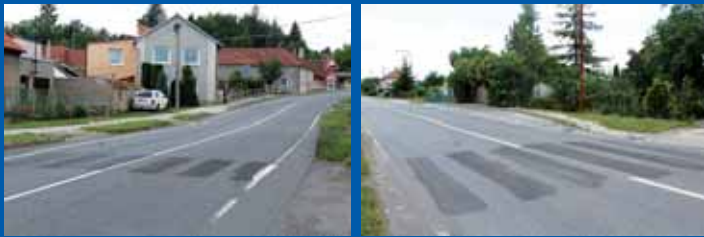
Po přechodech pod hrází plumlovské přehrady (obr. č. 1) a u autobusové zastávky naproti místního obchůdku zůstal na vozovce pouze vyřezávaný asfalt.

procházeli pod hrází plumlovské přehrady (obr. č. 1) a u autobusové zastávky naproti místního obchůdku zůstal na vozovce pouze vyřezávaný asfalt.