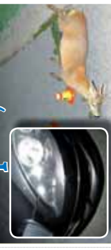
Smec, který vlní do slunce a sází ho řídě. Sazul, nepříže. Mřve žvěsí si přezel myslivci.

Dvě strážky se zvěř v Vřábatek Kanec přezil, smecne!