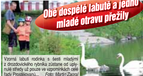
Obě dospělé labuťe a jedno mladé otravu přežily

PROSTĚJOV Z toho pohledu muselo být do breku... Radost z narození prvních labutích mláďat na drozdovickém rybníku vystřídala smutek! Uplynulou středu před polednem bylo na břehu rybníka nalezeno pět mladých labutí a šest uhynulých kachních mláďat. Za smrti zvířat zřejmě nestojí lidský ani zvířecí agresor, ale otrava. Krajská veterinární již vyloučila náказu virem ptáčí chřipky, domnívají se, příčinou by mohl být takzvaný botulismus.