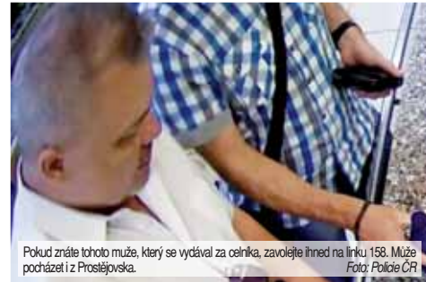
Pokud znáte tohoto muže, který se vydával za celníka, zavolejte ihned na linku 158. Muže pocházet i z Prostějovska.

ského ředitelství Policie Jihozemského kraje v Brně. „Kriminalistům se podařilo zajistit videozáznam, na kterém je podezřelý zachycen během obchodní schůzky v Olomouci. Pokud tušíte, o koho jde, uvítáme jakékoli informace na lince 158,“ apeluje na veřejnost Pavel Šváb. Žádost o zveřejnění patřící relace zrozeslal médiím mluvčí Krajského ředitelství Policie ČR Olomouckého kraje. „Dá se předpokládat, že hledaný muž může pocházet i z Prostějovska,“ vzkazuje Libor Hejtmán.