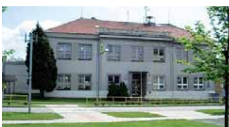
Škola v Hrubčicích na historickém a aktuálním snímku. V současné době slouží škola k výuce dětí 1. až 5. ročníku.