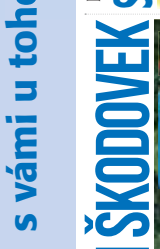
Průběh sledování automobilu... Průběh sledování automobilu... Průběh sledování automobilu...

Ujel od nehody a zanechal poškozený dům!