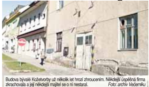
Budova bývalé Kožetvorby už několik let hrozí zhroutilím. Někdejší úspěšná firma zkrachovala a její někdejší majitel se o ni nestaral.

KONICE Tohle je zajímavý obrát! Před více jak dvěma lety odkoupilo město Konice areál bývalé Kožetvorby a přilehlé Hygie. Zdevastované budovy přitom již řadu let hzdí hlavní konické náměstí. Vedení konického úřadu je plánovalo zbořit, k tomu však dosud nedošlo. Nyní se do celé záležitosti vložil soukromník s ambiciózními plány.