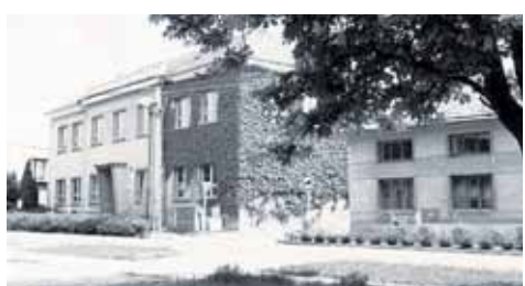
Škola v Hrubčicích na historickém a aktuálním snímku. V současné době slouží škola k výuce dětí 1. až 5. ročníku.

ky Arnošt Lejsal, který na škole 30 let působil ve funkci ředitele. Nyní je již pětadvacet let v důchodu, stále však bydlí nedaleko školní budovy. „Škola pro mě i nadále zůstává mojí srdcevní záležitostí, proto jsem moc rád, že se podobné akce daří úspěšně organizovat,“ uzavřel Lejsal. (mls)