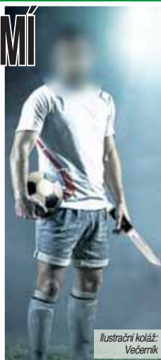
Ilustrační koláž: Večerník

Zda to je skutečně on, na to si budeme muset počkat zřejmě až do soudního přelíčení. Policejní prezidium připravuje obžalobu, kterou podle slov