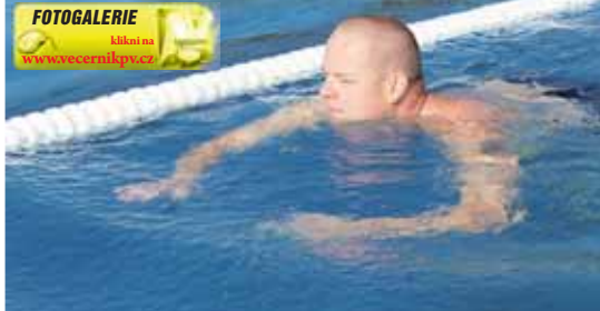
FOTOGALERIE klikni na www.vecernikpv.cz

bazén navazuje dětský bazén s herními prvky. Součástí stavby byla nová technologie úpravy bazénové vody. V rámci stavby bylo vybudováno nové zázemí pro personál, sociální zařízení pro veřejnost, prostor pro obcerstvení včetně přístřešku a moderní dětské hřiště s herními prvky. Součástí rekonstrukce byla i obnova dvou hřišť pro míčové sporty, jedno je