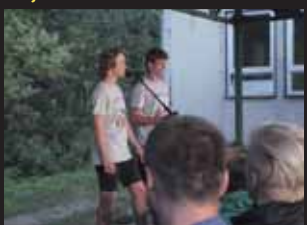
Každý z tvůrců předváděného filmu svoji práci „obhajoval“ před zaplněným hledištěm.