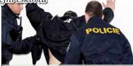
Policie načapala neplatiče alimentů v jedné z firem v Plumlově, kde se ukryval před nástupem do kriminálu.

Jak se ovšem záhy ukázalo, uvedení muž bude mít i jiné problémy se zákonem. „Provedeným šetřením k muži dále policisté zjistili, v uplynulých letech v rámci zaměstnání