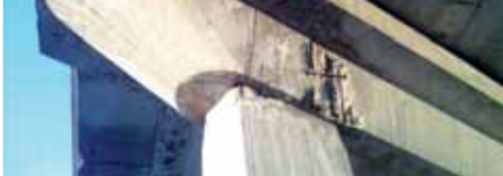
Dálniční nadjezd v Prostějově rozhodně není v pořádku. Svědčí o tom i tyto snímky popraskané mostní konstrukce. Na některých místech už ŘSD provádí sanaci.