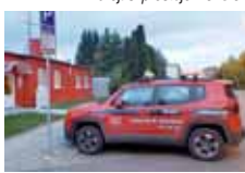
Zásahové vozidlo SIDA Security u sídla společnosti v Krapkově ulici v Prostějově.