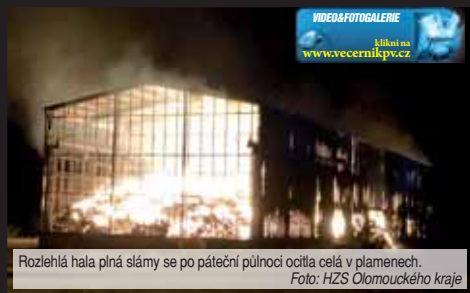
Rozlehlá hala plná slámy se po páteční půlnoci ocitla celá v plamenech.

z Prostějova a Konice, dále dobrovolníci z Protivanova, Nivy, Ptení, Drahan a Suchdola, dorazily také jednotky ze Žďárné a Benešova. V první fázi zajistili lokalizaci požáru a zabezpečení okolních objektů ochlazením, když využívali čerpací stanoviště pro kyvadlovou dálkovou dopravu vody u nedalekého rybníka. Požárem zasažená plocha skladované slámy se nechal postupně vyhořet,“ popsal zásah Hošák. Podle vyjádření vlastníků požár způsobil škodu na skladované slámě a hlavně objektu v celkové výši 6 500 000 korun. Během zásahu došlo také k drobnému zranění hasiče v podobě úrazu dolní končetiny. „Co stojí za přesnou příčinou vzniku požáru, je aktuálně v šetření ve spolupráci s Policií ČR,“ uzavřel tiskový mluvčí krajských hasičů. Situaci na místě bude Večerník sledovat a v případě nových podrobností vás budeme informovat v příštím čísle. (mls)