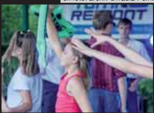
Mezi mladými diváky vládla perfektní atmosféra, navíc organizace tábora fungovala perfektně.