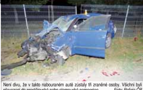
Není divu, že v takto nabouraném autě zůstaly tři zraněné osoby. Všichni byli převezeni do prostějovské nebo olomoucké nemocnice.

OLŠANY U PROSTĚJOVA Ve čtvrtek 16. srpna přibližně dvě a půl hodiny po půlnoci došlo na silnici mezi Lutínem a Olšany u Prostějova k dopravní nehodě osobního automobilu značky Škoda. Ze čtyřčlenné osádky utrpěly zranění tři osoby, z toho dvě nezletilé dívky! „Třicetiletý řidič při projíždění pravotočivou zatáčkou z dosud přesně nezjištěných příčin nevládl řízení a vyjel vlevo mimo komunikaci. Tam narazil do stromu, od kterého se vozidlo odrazilo do příkopu a tam se zastavilo přední částí proti směru jízdy. Zadní částí současně poškodilo oplotení místního fotbalového hřiště. Při nehodě utrpěly zranění tři osoby. Kromě řidiče to byla i patnáctiletá dívka na sedadle spolujezdce a čtrnáctiletá dívka na sedadle za řidičem. Jediným, kdo vyzval bez zranění, byl devatenáct-