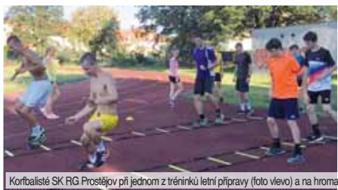
Korfbalisté SK RG Prostějov při jednom z tréninků letní přípravy (foto vlevo) a na hromadném autopořetru čili selfie po absolvované dílně (snímek vpravo).