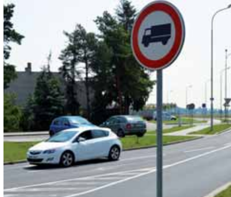
Značka zakazující nákladním vozidlům vjezd na jižní kvadrant již tady zřejmě zůstane navěky.

„Hlukové limity jsou hraniční už teď, kdy po kvadrantu jezdí pouze osobní auta. Takže pokud bychom tam povolili průjezd i nákladákům, museli bychom postavit velkou protihlukovou stěnu. Navíc je podle odborných posudků nepřipustné, abychom uvolnili vjezd pro těžká nákladní vozidla už od rondelu v Plumlovské ulici přes Sidliště Svobody a Anenskou ulici. Jak ostatně zjistil i dopravní průzkum, tolik nákladních aut ve směru od Mostkovic na Brno nejezdí, abychom kvůli tomu museli pro ně otevřít jižní kvadrant. Je pravda, že tuto možnost jsme v radě města už víceméně ulo-