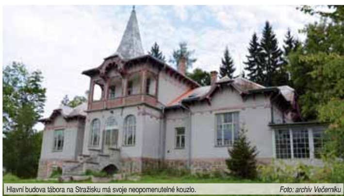
Hlavní budova tábora na Stražisku má svoje neopomenutelné kouzlo.

V roce 2012 se hlavní budova tábora přece jen opět otevřela lidem. Objekt se tehdy v průběhu letních prázdnin měnil v magické místo