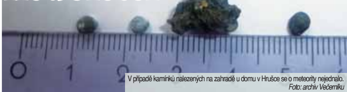
V případě kamínky nalezených na zahradě u domu v Hrušce se o meteorit nejednalo.