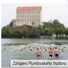
Zahájení Plumlovského triatlonu