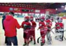
Tým SK Prostějov 1913 při závěrečné ceremonii na domácím turnaji SIDA Cup.