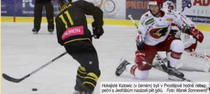
Hokejisté Katowic (v černém) byli v Prostějově hodně nebezpeční a Jestřábům nasázeli pět gólů.

PROSTĚJOV Úvod zápasové přípravy hokejistů LHK Jestřábi Prostějov obstaraly dva hodně zajímavé souboje během tří dnů se zahraničním protivníkem. Asi největší favorit nadcházejícího ročníku polské extraligy Tauron KH GKS Katowice nastoupil do obou vzájemných střetnutí uplynulého týdne bez nových posil z ciziny a v daném složení se ukázal být Hanáckům naprosto vyrovnaným sokem. Což stvrdily i konečné výsledky.