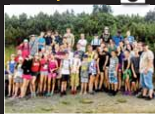
Účast při 14. ročníku byla značná, navíc mezi mladými filmáři vládla velká pohoda.