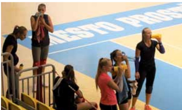
Zatím prostějovské volejbalistky pouze trénují a po dříně se občerstvují, přípravné zápasy začnou hrát až v září.

Generálkou na extraligový vstup se potě stane přátelský souboj v domácím pro-