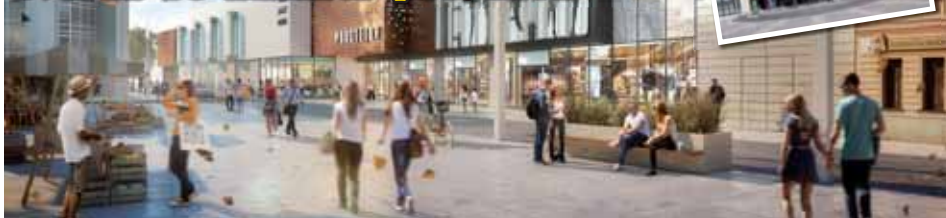
Modernizace středu města se pořádně zdrhla i kvůli sporu o výstavbu kulturního sálu, který by měl nahradit stávající „Kasko“.

Společnost se proti rozhodnutí odvolá. „Není to nic vážného,“ svěřil se manažer projektu