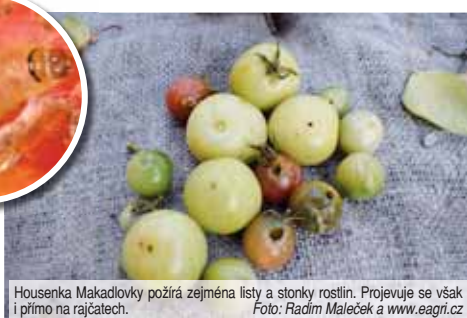
Housenka Makadlovky požírá zejména listy a stonky rostlin. Projevuje se však i přímo na rajčatech.

Makadlovka postihuje všechny pěstitele, a sice velké i malé. Do Evropy a posléze i České republiky byla zavlečena díky obalovým materiálům, do nichž byla zelenina zabalena,“ reagovala na dotaz Večerníku odbornice, která si však nepřála být v této souvislosti jme-