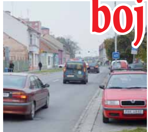
Kdo bude po rekonstrukci Plumlovské ulice chtít parkovat v této lokalitě, musí si podat žádost na magistrát. Místo mu bude pronajato.

Jenže právě v případě Plumlovské ulice město dohlédne na to, aby se na nových