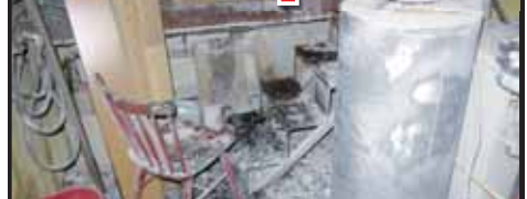
Po uhašení požáru zůstaly v kotelně ohořelé věci. Příčina vzniklého ohně je teprve předmětem šetření.

BŘEZSKO Minulé pondělí 15. října o půl desáté večer byl hasičům oznámen požár v kotelně rodinného domu v Březsku na Konicku. Uhašení byl během několika minut, avšak přítomnou majitelku domu si museli vzít do péče lékaři. Na místo vyjeli profesionální i dobrovolní hasiči z Konice, které doplnily jednotky z Březska a Hvozdu. „Po příjezdu bylo zjištěno, že požár vznikl v kotelně rodinného domu a nastěti se nerozšířil nikam jinam, pouze byl cítit v kuchyni kouř. Hasiči plameny dostali pod kontrolu během