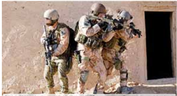
Příslušníci 601. skupiny speciálních sil generála Moravce.

PROSTĚJOV, BAGRAM Česká armáda se pomstila za smrt tří českých vojáků, které v létě zabil v Afghánistánu sebevražedný útočník. Podle středního vydání Lidových novin (LN) jednoho ze spolupachatelů útoku zneškodnili příslušníci 601. skupiny speciálních sil z Prostějova!