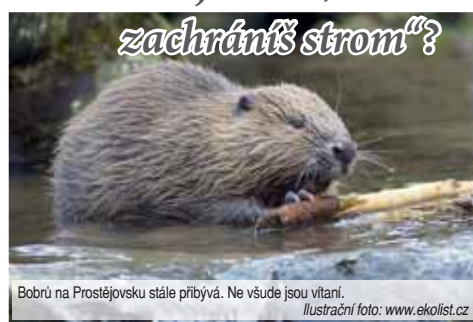
Bobří na Prostějovsku stále přibývají. Ne všude jsou vítáni.

Masakr bobří se však v Čechách pod Kosířem konat nebude. „Konzultovali jsme to se správci Lednicko-valtického areálu, kde bobří žijí již řadu let. Ti nám řekli, že se jich už nikdy nezavíme. Oni sami neodejdou, zlikvidovat je kvůli ochraně nejde a odchytit či přenést jinam také ne, protože by je nikdo nechtěl. Přesto nám navrhli řešení, abychom vzácné