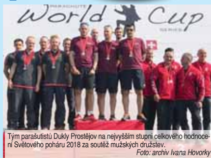
Tým parašutistů Dukly Prostějov na nejvyšším stupni celkového hodnocení Světového poháru 2018 za soutěž mužských družstev.