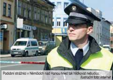
Podobní strážníci v Němčicích nad Hanou hned tak hlídkovat nebudou.

NĚMČICE NAD HANOU Zatímco v Konicích a Kostelci na Haně městská policie funguje, v Plumlově a Němčicích nad Hanou před lety ukončili její činnost. Ve druhém případě to už vypadalo, že se vše od nového roku změní. Ovšem nestalo se.