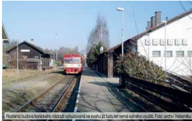
Rozlehlá budova konického nádraží vybudovaná ve svahu již řadu let nemá valného využití.

Vypadá to, že se na konickém nádraží zastavil čas. Největší změnou za poslední roky je fakt, že loni změnila majitele budova skladěš s nákladní rampou. Velkoryse pojetý objekt, který byl s velkou pompou otevřen před necelými třiceti lety, zůstává všem na obtíž. Na lepší budoucnost se v jejím případě očividně neblýská... (mls)