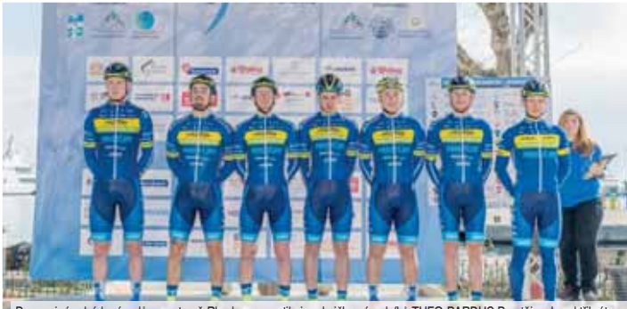
Do mezinárodních závodů na ostrově Rhodos se pustila i sedmička závodníků TUFO-PARDUS Prostějov, hned třikrát se jim podařilo skončit v elitní dvacíce.