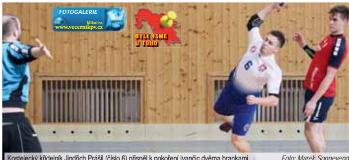
Kostelecký křídelník Jindřich Prášil (číslo 6) přispěl k pokoení Ivančice dvěma brankami.

V úvodu se Hanáci drželi přesně pět minut do stavu 3:3. Vzápětí si vybrali obvyklý blackout, kdy dalších devět minut nedali ani gól a sami jich inkasovali sedm za sebou na 3:10! Během téhle mízerné pasáže nefungovalo absolutně nic, hosté snadno získávali lacino ztracené míče. Aby pohodlně skórovali jak z rychlých trháků, tak z volných pozic na brankovišti po postupných útocích. Povážlivá situace se stabilizovala te-