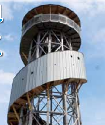
Loni touto dobou se rozhledna na Kosířích teprve opravovala a otvírala se až v červnu.

VELKÝ KOSÍŘ uristé zas budou mít kam vystoupat! Tento pátek 12. dubna se letos poprvé otevře rozhledna na vrcholu Velkého Kosíře.