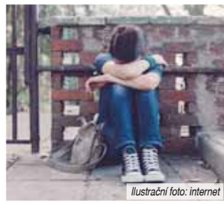
Ilustrační foto: internet