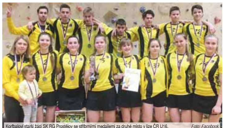
Korfbaloví starší žáci SK RG Prostějov se stříbrnými medailami za druhé místo v lize ČR U16.

moc, byly to proti nim docela vyrovnané souboje. Zatímco Koblou a Tábor jsme přeřhali o něco víc. Každopádně mezi všemi pěti družstvy nejsou velké výkonnostní rozdíly, kromě toho u dětí do třinácti let hodně záleží na momentálním rozpoložení, náladě. Každý zápas mezi stejnými soupeři může dopadnout úplně jinak“, přiblížila s úsměvem trenérka ergéčka U13 Renata Havlová, jež mančaft vede společně s Petrem Šnajdrem. Finálový den 1 mladších žáků 2019 – výsledky SK RG Prostějov: Brno 4:7 (1:4), Znojmo 4:6 (1:2), Koblou 8:2 (2:0), Tábor 9:5