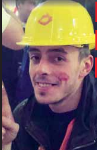
MLADÝ MUŽ BYL OBLIBENÝ PRO SVOJI BODROU POVAHU, VŽDY PŘY NA VLASTNÍCH DISKOTÉKÁCH PRO OSTATNÍ VYMYSLIL NĚJAKOU ZÁBAVU.