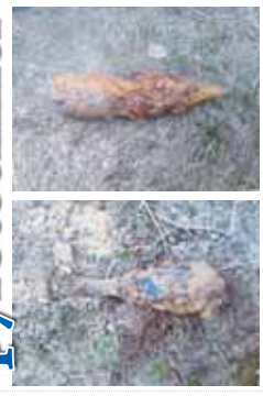
Událost se odehrala v úvodu letošního školního roku.

PROTIVANOVSKÝ zastavil výbuchy. Pyrotechnici zneškodnili granát, který byl nalezen v blízkosti školní budovy. Účastníci záchranných prací se setkali s výbuchem, který vyvolal ohrožení zdraví lidí. Pyrotechnici zneškodnili granát, který byl nalezen v blízkosti školní budovy. Účastníci záchranných prací se setkali s výbuchem, který vyvolal ohrožení zdraví lidí.