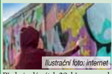
Ilustrační foto: internet

Předminulý pátek 29. března vpolední strážník při hlídkové činnosti v Janáčkově ulici povšiml u supermarketu mladíka, který popisoval fixou betonový pilír budovy. Na místě s ním byla i dívka. Dvojice byla vyzvána k prokázání totožnosti. Hoch uvedl, že je mu patnáct let, o občanský průkaz má zažádáno a ještě mu nebyl vydán. Slečna uvedla, že je jí třináct let. Po podezření z trestného činu poskožení cizí věci si strážník vyžádal přes operační středisko příjezd Policie ČR. Po dostavení se hlídky na místo byla dvojice policistům předána k dalšímu šetření.