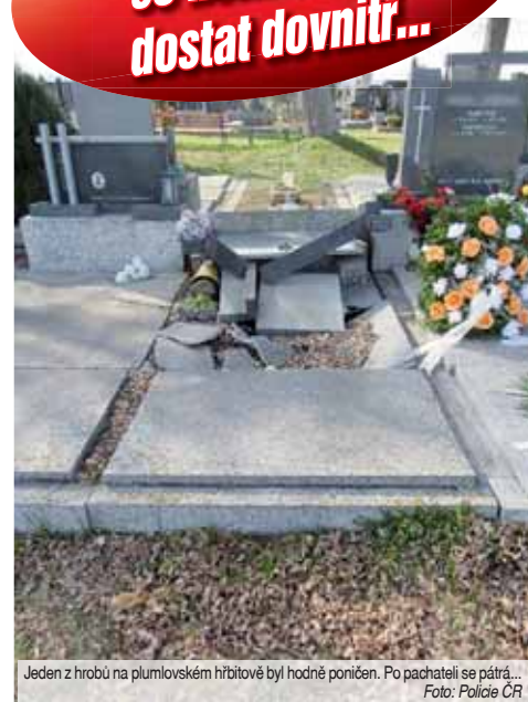
Jeden z hrobů na plumlovském hřbitově byl hodně poničen. Po pachateli se pátrá...

Škoda na druhém hrobu doposud vyčíslena nebyla. „Policisté ve věci zahájili úkony trestního řízení pro podezření z přečinu poškození cizí věci a přečinu výtržnictví, za což pachatel v případě dopadení a prokázání viny hrozí trest odnětí svobody až na dva roky,“ doplnil Kořínek. (mik)