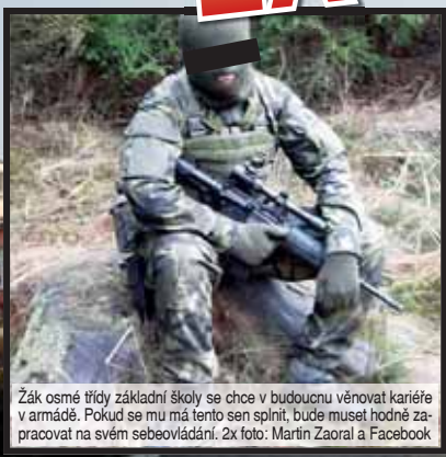
Žák osmé třídy základní školy se chce v budoucnu věnovat kariéře v armádě. Pokud se mu má tento sen splnit, bude muset hodně zapracovat na svém sebevzdělání.