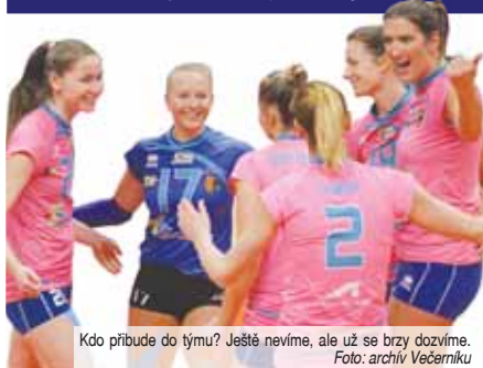
Kdo přibude do týmu? Ještě nevíme, ale už se brzy dozvíme.

Poslední duo hráčských posil vyzkouší VK Prostějov od začátku společné přípravy