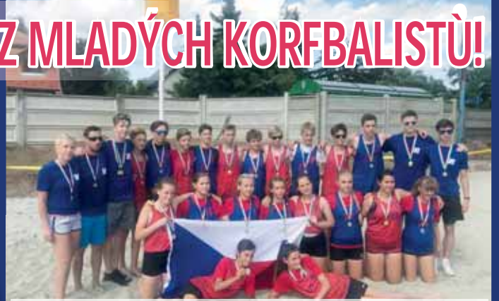
Beachkorfbalové ME U15 přineslo reprezentaci ČR včetně devíti Prostějovanů zlaté medaile.