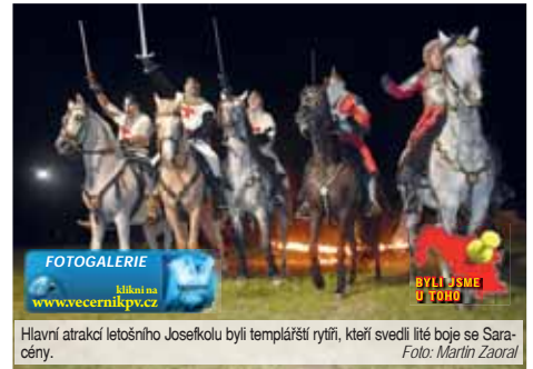
Hlavní atrakcí letošního Josefkolu byli templářští rytíři, kteří svedli líté boje se Saraceny.

Všichni účinkující sklízeli přítom zasloužený a uznatý potlesk ze strany přítomných diváků. To nejdražšími přítom mělo teprve přijít. Divadelní a kaskadérská společnost Štvanci známá například svým působením ve filmu o Johance z Arku si pro letošek připravila příběh o vě-