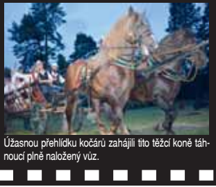
Úžasnou přehlídku kočárů zahájili títo těžcí koně táhnoucí plně naložený vůz.