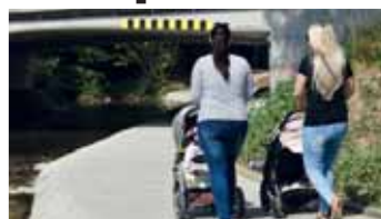
Chodí a cyklisté musejí pod mostem v Olomoucké ulici procházet či projíždět opatrně, vedle stezky chybí kvůli povodním povodním ochranné zábradlí.