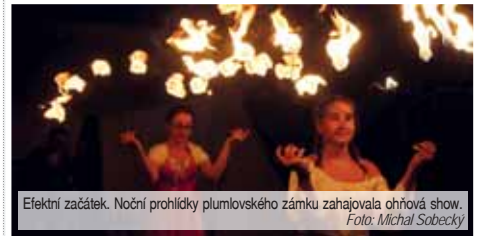
Efektivní začátek. Noční prohlídka plumlovského zámku zahajovala ohňová show.

PLUMLOV V příjemnou a oblíbenou tradici se na Plumlově proměnilo noční prohlídka. Žádný div tedy, že ani letos nechyběly v napěchovaném kulturním programu. Příběh ve třech různých podzích zámku přiblížil mimo jiné jeho začátky, něco z historie roku Lichtenštejnů. Držel se ale také hodné pověsti, třeba o ohnivém kočáru, v němž ještě dnes žijí nedokonalou stavbu zámku.