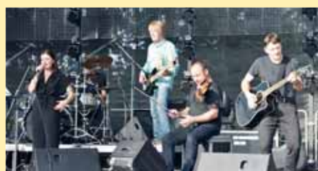
Polská kapela Carrantuohill dokázala roztančit publikum přímo pod pódiem.