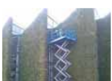
V některých městech se už takzvané zelené střechy nebo jiné části domů objevily. Bude tak tomu brzy i v Prostějově?

PROSTĚJOV Technologické novinky chystá do budoucna prostějovský magistrát. Ten zvažuje, zda by se v budoucnu z části prostějovských střech i stěn domů nestaly louky. A to díky speciálním travnatým střechám a konstrukcím. S informací přišel ve čtvrtek web města.