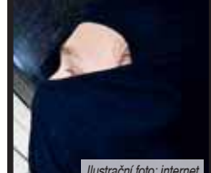
Ilustraci foto: internet

Dne 18. března tohoto roku po šestnácté hodině se vloupal v té době neznámý pachatel do nákladního automobilu značky Mercedes-Benz zaparkovaného v Brněnské ulici v Prostějově. Z místa u sedadla spolujezdce poté odcizil tašku čtyřiašedesátiletého cizince. S taškou muž přišel i o osobní doklady, notebook, dvě platební a čtyři tankovací karty a finanční hotovost 500 euro a 22 tisíc maďarských forintů. Výše způsobené škody byla vyčíslena na 31 400 korun. Policisté ve věci zahájili úkony trestního řízení pro podezření z přestupku krádeže, přičiněním poškození cizí věci a přčinou neoprávněného opatření, padání a pozmenění platebního prostředku. Provedeným šetřením se policistům jako podezřelého podařilo ustanovit čtyřiatřicetiletého muže z Kolína. Ten není policii neznámý a trestnou činnost nepáchal jen na Prostějovsku. Proto bude spisový materiál k této věci postoupen brněnskými kriminalistům k trestnímu stíhání ve společném řízení.