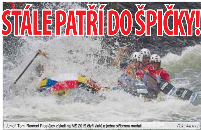
Junioři Tomi Remont Prostějov získali na MS 2019 čtyři zlaté a jednu stříbrnou medaili.

PŮVODNÍ zpravodajství pro Večerník Marek SONNEVEND