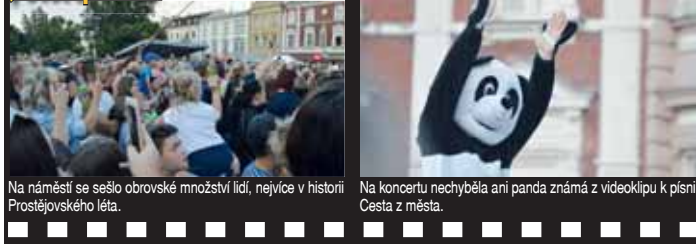
Na náměstí se sešlo obrovské množství lidí, nejvíce v historii Prostějovského léta.