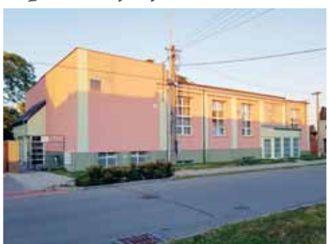
Čechovickou sokolovnu se podařilo díky dotačním zrekonstruovat od podlahy. A to doslova a do písmene!

PROSTĚJOV Sokolovna v Čechovicích se začala stavět v roce 1938 a po téměř 81 letech opět září novotou. Celou dobu slouží jako tělovýchovné zařízení a dále pak pro kulturní a společenské akce v této části města Prostějova. Sokolovna je rovněž využívána pro výuku tělesné výchovy základní školy. Za dobu jejího užívání došlo jak k morálnímu, tak i fyzickému opotřebení celkového stavu budovy, který vygradoval havarijním stavem nosné části podlahy hlavního sálu a ústředního vytápění budovy.