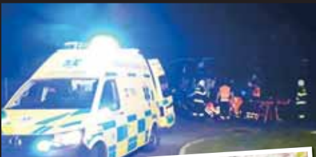
U sídla hasičů v Konici přistál vrtulník letecké záchranky, aby přepravil popálenou ženu do nemocnice. Proč došlo k požáru v kuchyni, se vyšetřuje.

„Hasiči na místě našli zraněnou, popálenou ženu již v péči posádky zdravotníku záchranky. V prostorách požářiště provedli důkladný průzkum, v kuchyni došlo k zahoření molitanu a plastů. Nejednalo se o výrazné zahoření a v krátkosti také vyloučili možnost opětovného rozhoření či skrytého zhnutí. V průběhu své činnosti hasiči také asistovali zdravotníkům, uvedl Zdeněk Hošák, tiskový mluvčí Hasičského zá-