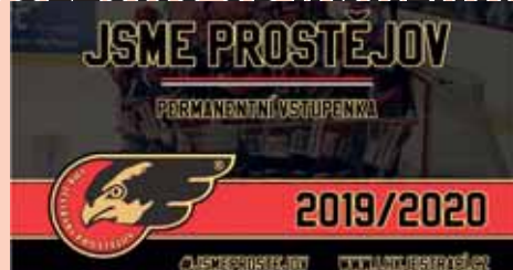
Vzhled nové základní permanentky (JSME PROSTĚJOV).

PROSTĚJOV – Prostějovský hokejový klub představil ceny vstupného a permanentních vstupenek pro nadcházející ligovou sezónu 2019/2020. Fanoušky Jestřábů čeká několik změn týkajících se například ceny lístků nebo variant permanentních vstupenek. Zájemci o permanentky mají nově na výběr pouze ze dvou variant: základní JSME PROSTĚJOV (2 600 Kč) a VIP (12 500 Kč). Změnou je také množství zápasů zahrnutých v ceně základní permanentky. V letošním roce bude tato „permice“ platit pouze na přípravu a základní část (celkem 33 zápasů, pozn. red.). Každý „permanentkář“ ještě obdrží slevovou akci na podepsané zápasový fan dres a podepsané profesionální kartičky Jestřábů. „Permanentkáři“ budou mít výhodu i po skončení základní části, kdy pro ně bude vyhrazen první den předprodeje vstupenek na zápasy play-off. Přesné datum zahájení prodeje permanentních vstupenek bude upřesněno během tohoto týdne. Změna čeká i na ty, kteří si kupují vstup-