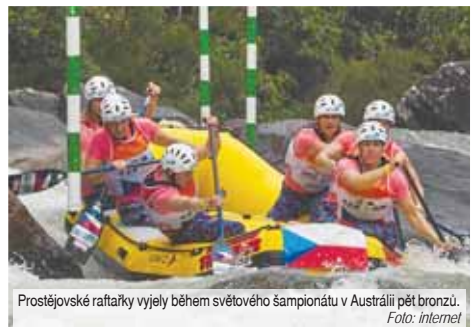
Prostějovské raftařky vyjely během světového šampionátu v Austrálii pět bronzů.

Sám patřil do oddílové posádky veteránů, kteří z australské divoké vody vyloučili zrcadlově obrácenou sbírku než mladíci. Tedy jedno prvenství a čtyři druhé pozice. Dominovali přitom královské disciplíně sjezdu, ve