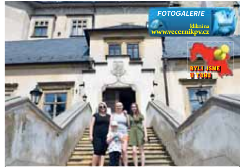
Ženské kvarteto na schodišti před zámkem ve Šternberku.

Během prohlídky jsme se mimo mnoha jiného dozvěděli, že se