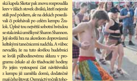
dodávat, že zábava tím nekončila, stovky lidí v kempu Zralok popíjely a bavily se až do časných ranních hodin. (mik)