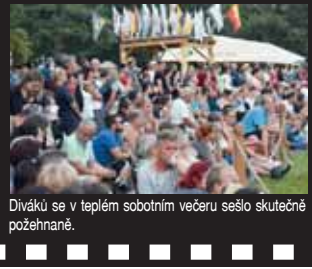
Diváků se v teplém sobotním večeru sešlo skutečně požehnaně.