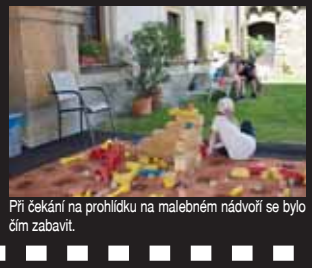
Při čekání na prohlídku na malebném nádraží se bylo čím zabavit.