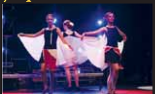
Prkna jeviště se otřásla i pod irským tancem od skupiny Démáirt.