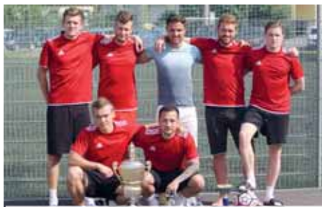
Vítězové COPA Vrbátky 2019 – tým Mumuland. Foto: Marek Sonnevend

Momentka z rozhodujícího utkání turnaje Mumuland versus FK Vrbátky 3:0. Foto: Marek Sonnevend