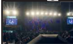
Bez deště ani ránu. Ani déšť však skvělou atmosféru Keltské noci nepokazil.