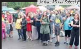
Po dešti ani památky a tak se před pódiem nahrnuli davy posluchačů. Skupina Bran si mnohé získala.