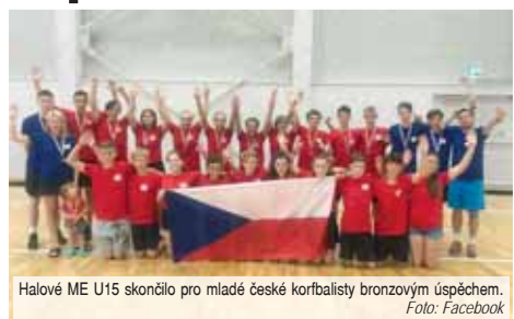
Halové ME U15 skončilo pro mladé české korbálisty bronzovým úspěchem.

Nejprve se hrálo halové ME v klasičtém korbálu, kde mladí Češi museli během dvou dnů zvládnout vydatnou porci sedmi duelů. Šest z nich patřilo do zápasového maratónu základní skupiny, ve které porazili Slovensko 17:3, Anglii 9:5, Německo 7:4 i Maďarsko 8:4, naopak podlehli Portugalsku 7:9 a favorizovanému Nizozemsku 2:11. Díky obsazení třetího místa se na závěr střetli o bronzové medaile s němeč-