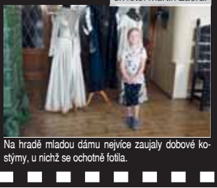
Na hradě mladou dámu nejvíce zaujaly dobové kostýmy, u nichž se ochotně fotila.