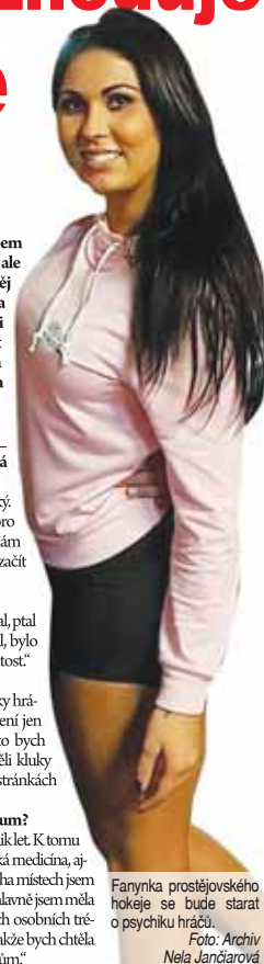
Fanyanka prostějovského hokeje se bude starat o psychiku hráčů.

„Jsem už osobní fitness trenérkou, tomu se věnuji už několik let. K tomu už se roky snažím jít alternativní cestou. To znamená čínská medicína, ajurvěda a další, kde je právě propojení mysli a těla. Na mnoha místech jsem byla, kde se tohle reálně praktikuje, jinak čerpám z knih. A hlavně jsem měla štěstí na užasně lidi, co mě vedli nebo ještě vedou. U svých osobních tréninků to praktikuji a doufám, že i v hokeji to bude znát. Takže bych chtěla všechno, co roky na sobě zkouším, předat našim hráčům.“