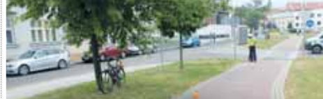
Policisté předemlulý pátek prověřovali všechny okolnosti havárie cyklisty na stezce v ulici Sádky.

PROSTĚJOV V pátek 12. července o půl třetí odpoledne došlo na cyklostezce v ulici Sádky v Prostějově k havárii jednesedásátiletého cyklisty. Muž vše sváděl na příruční tašku, která se mu zapletla do „špic“ kola. Za chvíli se ovšem prokázalo, že senior byl navíc úplně namol! „Podle dosavadního šetření muž při jízdě od Netušilovy ulice neuhlíd svou příruční tašku a ta se mu zapletla do výpletu předního kola. V důsledku toho došlo k zablokování kola a pádu muže na cyklostezku. Při něm muž utrpěl zranění, se kterým byl převezon do prostějovské nemocnice. Ke zranění dalších osob