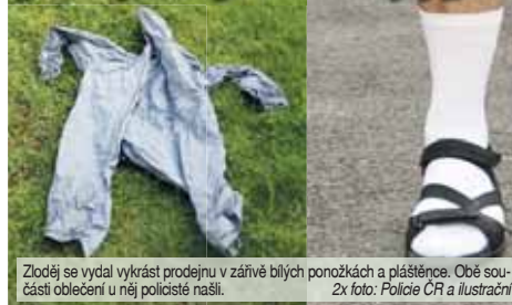
Zloděj se vydal vykrást prodejnu v zářivě bílých ponožkách a pláštěnce. Obě součásti oblečení u něj policisté našli.

Na vloupání přišla zaměstnanek, která věc oznámila na policii. A strážci zákona okamžitě a rychle jednali. „V místě bylo provedeno ohledání místa činu a nasazen byl i služební pes Spike. Ten označil ústupovou cestu pachatele z místa. Na té našel postupně šroubovák, zapalovač a také otisk podrážky pachatele. Dalším stejnéjím důkazem se ukázal být videozáznam pořízený bezpečnostní kamerou. Ne té byl zachycen pachatel v sedě pláštěnce