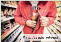
Ilustraci foto: internet

Za uplynulý týden vyjžděly hlídky městské policie k jedenácti krádežím, které se udály v prostějovských supermarketech. Všechny případy byly spáchány dospělými osobami. U osmi krádeží nedošlo k poskození zboží, a proto bylo vráceno zpět do prodejce. Ve dvou případech si přestupci odcizené zboží odkoupili a jedenkrát nebylo vráceno zpět na prodejnu. Pachatelé odcizili zboží v celkové hodnotě 13 525 korun. Přeborníkem v tomto počítání byl devětadvacetiletý muž, jenž byl dopaden třikrát během dvou dnů a sám dokázal odcizit věci za 7 858 korun. Jeden případ vyřešili strážníci uložení pokuty na místě. Následujících deset bylo zadokumentováno a oznámeno příslušnému správnímu orgánu k projednání. Tam může být za takové jednání uložena pokuta do výše 50 tisíc korun.