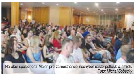
Na akci společnosti Maier pro zaměstnance nechybělo často potlesk a smích.

Zaměstnanci měli den plný sportu i zábavy.