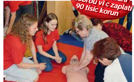
Žáci druhého stupně prostějovských základních škol budou nyní absolvovat kurzy první pomoci.

Prostějovští radní za dobrou věc zaplatí 90 tisíc korun