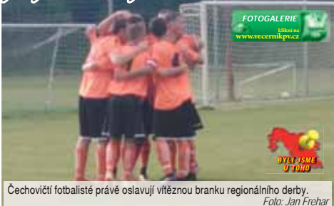
Čechovičtí fotbalisté právě oslavují vítěznou branku regionálního derby.

První vážná akce přišla ve 20. minutě, kdy Filip Halouzka pronikl přes stoperskou dvojici, jenže si míč popoknul příliš a domácí brankář byl včas na zemi. Chvilku poté vystřelil Kolečkář z voleje z dobrých 30 metrů. Střela měla gólové parametry, ale brankář Simandl byl proti. Následně mohl čechovický Novák otevřít skóre zápasu, kdy u něj přistál odražený míč po rohovém kopu, k jeho směle střela skončila pár centimetrů nad břevnem domácí branky. Na konci první půle se Petržela proháčkovo až k vápnu, kde chtěl ve skluzu píchnout míč spoluhráči a srazil se s Aujezdským,