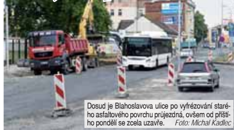
Dosud je Blahoslavova ulice po vyřezávání starého asfaltového povrchu průjezdná, ovšem od příštího pondělí se zcela uzavře.

Na stavební „šrumeč“ v Plumlovské ulici si Prostějované už jaksí zvykli, aktu-