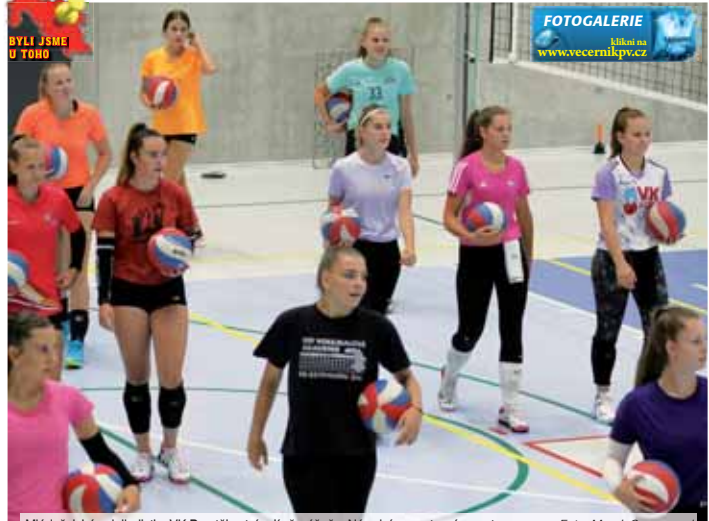
FOTOGALERIE Ukáni na www.vecernikpv.cz