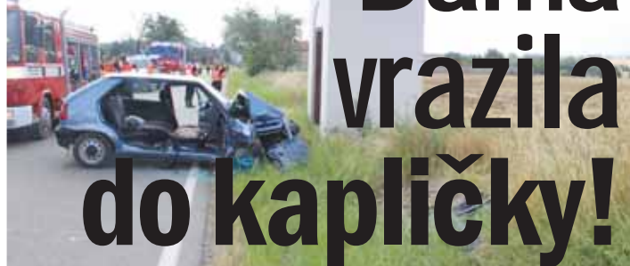
Zatím se přesně neví, proč seniorka za volantem škodovky nezvládla řízení a vrazila do kapličky vedle silnice...

SLUŽÍN Dvě zraněné seniorky zůstaly v nabouraném autě poté, co třiasedmdesátiletá seniorka nezvládla řízení a ve Služíně narazila do kapličky vedle silnice. Policisté dosud neznají příčinu selhání postarší řidičky. „V neděli osmadvacátého července po deváté hodině ránní došlo k havárii osobního vozidla značky Škoda Felicia. V obci Starechovice, části Služín, třiasedmdesátiletá řidička z do- sud nezjištěných příčin vyjela mimo silnici a havarovala do kapličky. Při dopravní nehodě byla zraněna řidička i její o rok mladší spolujezdkyně, která byla letecky transportována do nemocnice. Přesnou příčinu havárie policisté zjišťují,“ uvedla k dopravní nehodě Tereza Neubauerová, tisková mluvčí Krajského ředitelství Policie Olomouckého kraje. (mik)