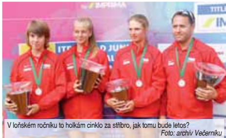
V loňském ročníku to hoikám cinklo za stříbro, jak tomu bude letos?