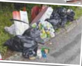
Na Husově náměstí tamní obyvatelé zahrnují běžné popelnice a kontejnery všemožným nepořádkem. Večerník pak odhalil další binec v Řiční ulici.

Na otázku Večerníku, jak chce magistrát odhalovat autory černých skládek, odpověděl okamžitě: „Jsme nuceni přistoupit k mimořádným opatřením. Pochopitelně zajistíme