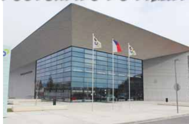
Národní sportovní centrum v Prostějově je novou architektonickou dominantou města. Teď má šanci na úspěch i mezi odborníky.

Zda objekt uspěje i v samotném finále, se ukáže 14. listopadu na slavnostním gala večeru ve Foru Karlín v Praze. Na slavnostní akci budou rovněž vyhlášeny výsledky ocenění za výjimečný počin a ceny partnerů. Předcházet bude pečlivý výběr poroty, která se s realizací seznámí přímo v terénu.