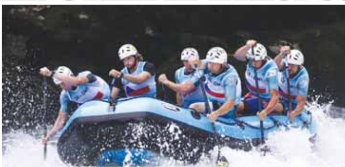
Prostějovští muži TR Zubr vyjeli na ME jeden mistrovský titul a tři stříbra.

V porovnání s týmovými parťáky a partačkami vyšlo evropské mistrovství nejméně prostějovským juniorům. Po slabším sprintu (pátý post) však rovněž oni posbírali čtyři cenné kovy (dva stříbrné + dva bronzové), když v celkovém pořadí obsadili třetí místo. „Z každé takhle významné mezinárodní akce chceme přivést nějaké medaile, což platilo i tentokrát. Že jich ale posbíráme takové množství, to je paráda. Zvlášť