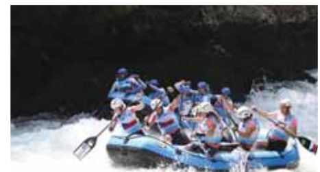
Ženy Tomi-Remont získaly v Bosně a Hercegovině též jedno zlato a celkem pět medailí.