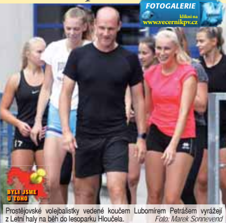
FOTOGALERIE Ukáni na www.vecernikpv.cz

V přípravě zatím není Prostějov kompletní, dál se shání blokařka. Na zkoušku přišel asistent trenéra