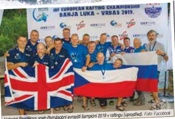
Veteráni Prostějova aneb čtyřnásobní evropský šampioni 2019 v raftingu (uprostřed).