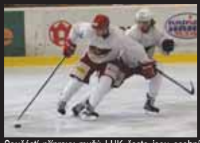
Součástí přípravy mužů LHK často jsou osobní souboje jeden na jednoho.