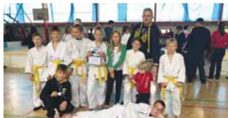
Uspěšná prostějovská výprava na turnaj v Adamově.