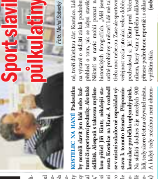
Primo před odstavěm ve střední...