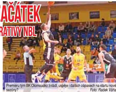
Premiéru tým BK Olomoucko zvládl, uspěje i v dalších zápasech na startu nové sezóny?

„V posledních sezónách to není až tak neobvyklé. Týmy jdou do sezóny v plné síle, hráči jsou natěšení a odhodlaní. Nezátížení porážkami. Výkonnostní rozdíly se mažou,“ všimá si trendu z posledních let Pekárek. „Navíc týmy, které obměnily sestavu,