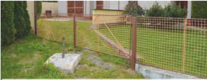
Zábrana stojící před vjezdem na pozemek rodiny Směkalových v Přemyslovicích byla jedna velká schválnost. Rodina si kvůli ní nakonec musela nechat vybudovat nový vjezd.