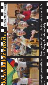
Děti z místní mateřské a přípravy vystoupily ve skvělém. Zele, zapřelky si suchdolského kulturního se oběra...