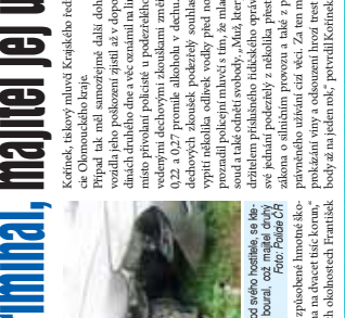
Provozákovi hrozí roční kriminál, majitel jej udal...