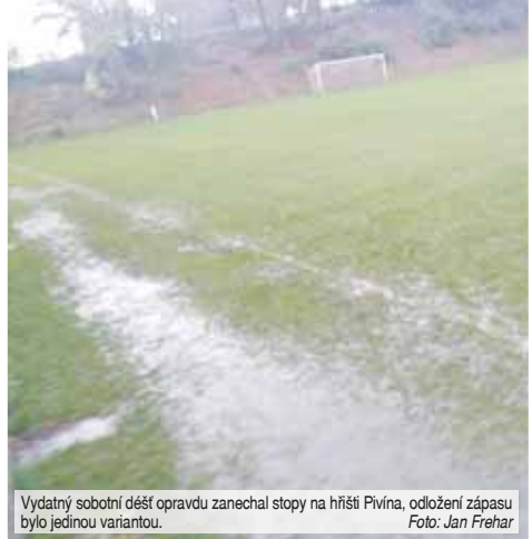
Wydatný sobotní déšť opravdu zanechal stopy na hřišti Pivína, odložení zápasu bylo jedinou variantou.

„Žde je hřiště na velmi měkké půdě a trochu déšť zkrátka nestihá vstřebat. Mysliv si, že pro oba celky i fanoušky je to ta nejlepší varianta, protože na tomto terénu by se fotbal opravdu hrát nedal. Jsem rád také za bezproblémovou domluvu s Držovicemi na odložení zápasu,“ uvedl k tomuto rozhodnutí správce areálu společně s trenérem Skalky Stanislavem Prečanem.