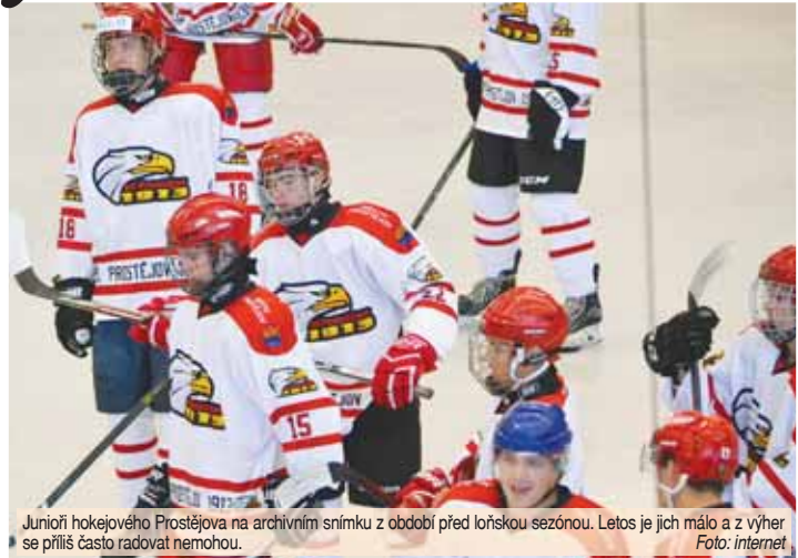
Juniorka hokejového Prostějova na archívním snímku z období před loňskou sezónou. Letos je jich málo a z výher se příliš často radovat nemohou.