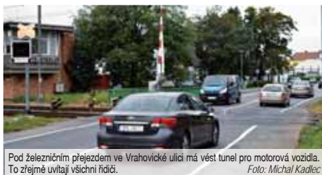
Pod železničním přejezdem ve Vrahovicích ulici má vést tunel pro motorová vozidla. To zřejmě uvítají všichni řidiči.

PROSTĚJOV Už na začátku milé- nia Večerník informoval o úmyslu Českých drah vybudovat pod že- lezními přejezdy ve Vrahovicích ulici tunel. Tedy lépe řeče- no podjezd, kterým by se vyřešil problém s neustálým stahováním