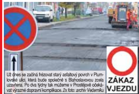
Už dnes se začíná frézovat starý asfaltový povrch v Plum- lovské ulici, která bude společně s Blahoslavovou zcela uzavřena. Po dva týdny tak můžeme v Prostějově očeká- vat výrazné dopravní komplikace.