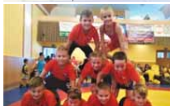
V Tichém vytvořili benjamínici TJ Sokol tuhle medailovou pyramidu.

PROSTĚJOV Mladí zápasníci TJ Sokol Čechovice jsou stále aktivní v objíždění turnajů po celé České republice i v zahraničí, kde navíc dokážou konkurovat tuzemské špičce a opakovaně dosahovat na medailové posty.