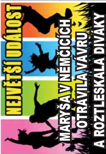
NEVĚTŠÍ UDÁLOST MARYŠA V NĚMČICÍCH OTRÁVILA VÁVRU A ROZTLESKALA DIVÁKY