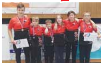
Uspěšná šestice čechovických zápasníků v Hradci Králové.