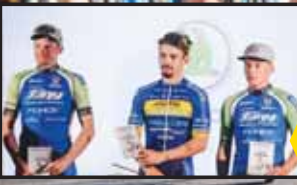
Cyklisté TUFO-PARDUS Prostějov v čele pelotonu při mladoboleslavském kritériu.