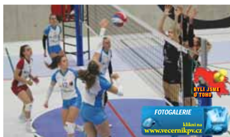
Béčko VK Prostějov uzmulo Vsetinu alespoň bod.