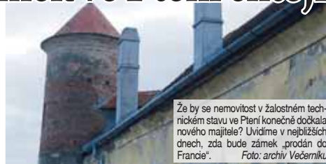
Že by se nemovitost v žalostném tech- nickém stavu ve Ptení konečně dočkala nového majitele? Uvidíme v nejbližších dnech, zda bude zámek „prodan do Francie“.

PROSTĚJOV Že by opravdu už letos skončil více než desetiletý román na pokračování s celou sérií neúspěš- ných pokusů o prodej? Možná že ano! Jak během uplynulého týdne exkluzivně zjistil Večerník, prostějovské radnici se ozval manželský pár z Francie, který má emi- nentní zájem o koupi ptenického zámku! Ten je dosud v majetku města, ale to se za pár týdnů může změnit.