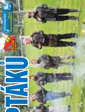
Při zájmovém výletě, vedeném odborně a důvěrně, se účastníci...