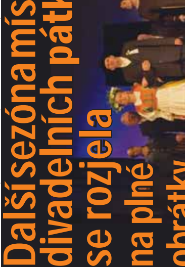
Další sezóna máis divadelních pátí se rozjela na plné obrátky