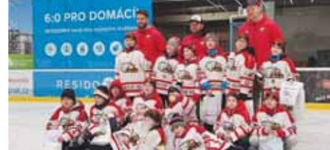
Kde je led? Hokejisté si období Vánoce zpestřili basketbalovým turnajem. Ročník 2010 zase vyválčili v Havířově stíbro.