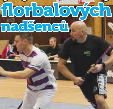
Florbalisté si dali dostaveníčko v Kostelci na Haně. Hrál se o pohár Povánočního florbaleni.