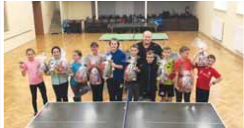
Výhry a úspěchy? Druhořadá věc. O dobrou atmosféru a zážitky šlo na vánočních turnajích především.