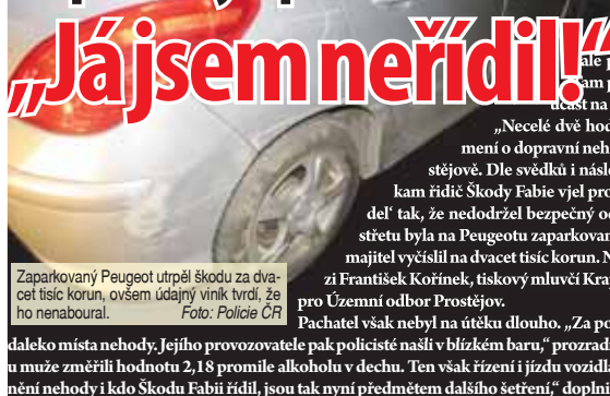
Zaparkovaný Peugeot utrpěl škodu za dva set tisíc korun, ovšem údajný viník tvrdí, že ho nenaboural.

PROSTĚJOV Neměl odvahu zůstat na místě banální nehody a zbabel se zachoval i ve chvíli, kdy jej policisté krátce po bouračce na Sídlišti Svobody dopadli. Opilý muž poškodil jiné osobní vozidlo, ale pak ze své škodovky utekl do blízkého baru. Sam policistům nadržal přes dvě promile, ovšem účast na nehodě odmítl.