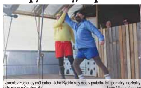
Jaroslav Foglar by měl radost. Jeho Rychlé šipy sice v průběhu let zpomalily, neztratily ale nic ze svého kouzla.