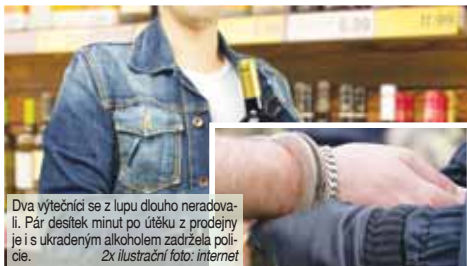
Dva výtečníci se z lupy dlouho neradovali. Pár desítek minut po útěku z prodejny je s ukradeným alkoholem zadržela policie.

Starší z mužů, který z místa krádeže řídil automobil, má zase vyloučen zákaz řízení