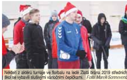
Někteří z akterní turnaje ve florbalu na ledě Zlatá brána 2019 středních škol se vybavili slavnostními vánočními čepičkami.