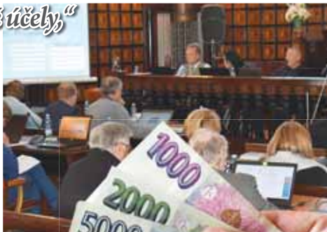
Diskuse kolem peněz nakonec nebyla až tak dlouhá a vášnivá. Při navýšování odměn našla koalice řeč i s většínou opozice.