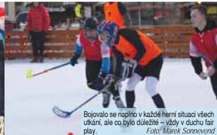
Bojovalo se naplno v každé herní situaci všech utkání, ale co bylo důležité – vždy v duchu fair play.

dvou čtyřlenných skupinách, kde se družstva utkala každé s každým. Tahle základní část tedy zabra celá dopoledne a čítala dohromady dvanáct střetnutí, načež dva nejlepší celky z každé skupiny postupují do semifinále a horší dva putovali do bojů o páté až osmé místo. Dění přitom parádně oživovaly vtipné komentáře dvojice známých studentů Střední školy podnikání a obohodu, Prostějov včetně aktuálních rozhořů s řadou plejerů. Přálo též počasí a po polední tak přišla na řadu rozhodující výtazovací fáze.