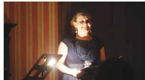
Příjemná atmosféra, zajímavý výklad. A zejména hudba, na kterou se nezapomíná. To byl Tříkrálový koncert v Čechách pod Kosířem.