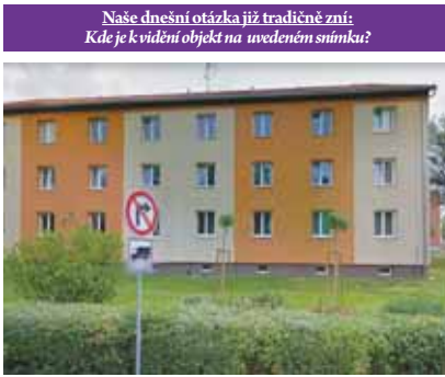
Naše dnešní otázka již tradičně zní: Kde je k vidění objekt na uvedeném snímku?