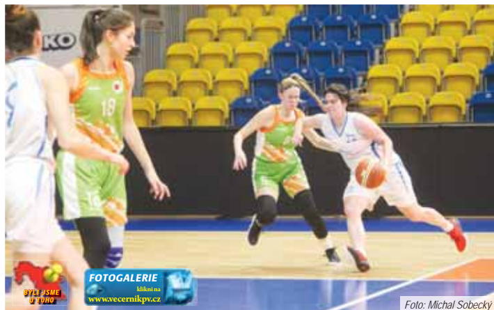
FOTOGALERIE