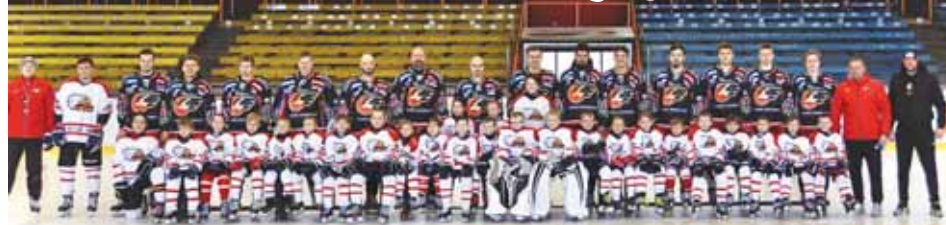
Spokojení děti, spokojení dospělí. Úterý patřilo na zimním stadionu v Prostějově vzájemnému střetnutí Jestřábů a eskáčka.

PROSTĚJOV Pěkný zážitek si minulý úterý odnášely ze stadionu malé děti z SK Prostějov 1913. Na kluzišti se totiž střetly s dospělými Jestřáby ve zhruba půlhodinovém střetnutí. V něm, méně než kdy jindy, vůbec nešlo o skóre nebo o branky, ale právě o konkrétní okamžiky a zážitky. A těch měly po střetnutí zejména děti na rozdávání.