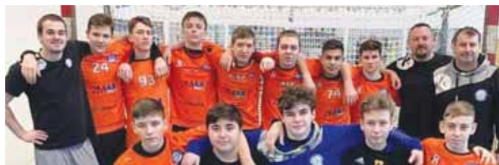
Mladší dorostenci Centra Haná skončili na házenkářském turnaji ve Stupavě čtvrtí.

STUPAVA, PROSTĚJOV Početná výprava házenkářského oddílu TJ Sokol Centrum Haná se vydala na mezinárodní mládežnický turnaj Zornu Cup 2020 do slovenské Stupavy. U našich východních sousedů se představili mladší dorostenci, starší žáci i mladší žáci. Nejlépe se dařilo dorosteneckému výběru, který ve skupinové fázi porazil domácí Stupavu 18:14, podlehl Jičínu 16:21, remizoval s Ostravou 18:18 a zdolal Kuřim 16:14, čímž postoupil do semifinále.