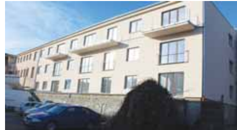
Zatímco průčelí objektu z ulice Vápenice vypadá víceméně stále stejně, za ním již vyrástly dvě rozlehlé třípatrové budovy s byty.

majitel jej magistrátu nabízel za 14,4 milionu korun. Vysoká cena byla jedním z důvodů, proč politici od tohoto záměru upustili a dům chátral dál. Změny přišly až s novým investorem, který „Blešárnu“ získal za necelých šest milionů korun. Koncem předminulého roku se tak rozběhly rozsáhlé stavební práce. Díky nim ve směru do Partyzánské ulice vyrástl rozlehlý bytový objekt rozdělený na dvě samostatné objekty podlouhlé třípatrové budovy spojené historickým objektem Blešárny. V současnosti s tím se hojně spekulovalo o ubytovně pro zahraniční dělníky. „Jedná se o normální byty různých velikostí. Součástí domu jsou i garážová stání,“ prozradil Večerníku jeden z mužů pracujících na stavbě. Sama „Blešárna“ v současnosti doznává změn, někdejší společenský sál je již minulostí. „I v něm budou byty. Brzy se začne upravovat také průčelí viditelné z Vápenice. Z této ulice se bude do domu také vcházet, nicméně hlavní vchod bude z Partyzánské ulice,“ uvedl dále stavební dělník. Přestože práce na výstavbě během uplynulého roku výrazně pokročily, kolaudace zatím není na pořadu dne. „Jestli to bude hotové letos? To netuším, pořád je tu hodně práce,“ uzavřel