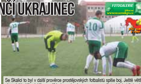
Se Skalici to byl v další prověrce prostějovských fotbalistů spíše boj. Ještě větší ale svádí hráči eskáčka například se zdravotím.

Na zkoušku dorazil exbaníkovec StaĀna PROSTĚJOV Příprava prostějovského eskáčka na jarní část Fortuna:Národní ligy se posunuje dál a s blížícím se startem odvetných bojů druhé nejvyšší soutěže se také začíná stabilizovat tým, s nímž má nový kouč Šustr vyrukovat do boje za lepším umístěním i hrou. Tedy měl by, brání tomu však početná zranění, marodka se navíc spíše zvětšuje, než aby se zmenšovala. Trenérům dává alespoň možnost zkusit na delší čas na hřišti nové hráče, zjistit jejich přednosti a slabiny. Dva už pak po minulém týdnu mají smlouvu prakticky jistou, další jeden naopak z kola vypadává.