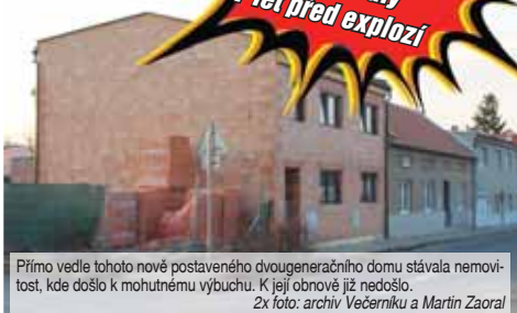
Přímo vedle tohoto nově postaveného dvougeneračního domu stávala nemovitost, kde došlo k mohutnému výbuchu. K její obnově již nedošlo.

V minulém vydání Večerníku jsme v rubrice „Po stopách starého případu“ uvedli, že na místě všech tří domů poničených výbuchem v Mostkovicích už stojí nové objekty. To však nebylo zcela přesně – starší dům, v němž třicetiletý muž neodborně manipuloval s pyrotechnikou, čímž způsobil následnou detonaci, obnovená vůbec nebyl. „Stával na rohu křižovatky hned vedle nás a pa-