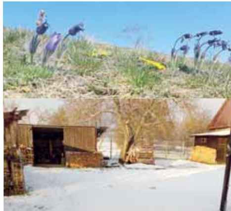
Věřili byste tomu? Snímek s rozkvetlými koniklecemi byl pořízen o 14 dní dříve než fotografie zasněženého dvorku.