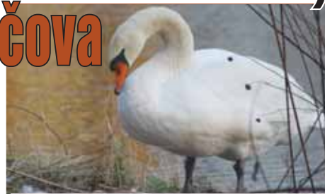
Labuť samce bezradně hledí do prázdného hnízda s již nakladenými vajíčky, které jeho životní družka nečekaně opustila a již se k nim nikdy nevrátí.