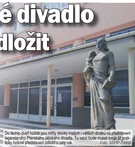
Do těchto dveří každé jaro mířily stovky malých i větších diváků na představení legendárního Ptenického dětského divadla. To letos bude muset svoje již prakticky hotové představení odložit o celý rok.