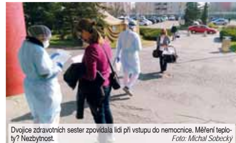
Dvojice zdravotních sester zjišťovala lidem při vstupu do nemocnice. Měření teploty? Nezbytnost.

V současnosti je přítom práce této dvojice stejně důležitá jako těch, co se o lidi nakažené starají. Zabraňuje totiž, aby se jejich počet nerozrostl právě v místě, kam naopak člověk chodí za uzdravením, tedy v nemocnici.