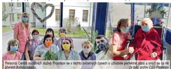
Personál Centra sociálních služeb Prostějov se v těchto svízelných časech o uživatele perfektně stará a snaží se na ně přenést dobrou náladu.

jem o naše uživatele. Náš zřizovatel, krajský úřad odbor sociálních věcí, v čele s vedoucí odboru magistratur Sonntagovou a hejtmán Ladislav Okleštěk nás denně informují, a to i o víkendy, o všech opatřeních a nařízeních vlády. Podporují nás, abychom situaci zvládli co nejlépe, a v co možná nejvyšší možné míře se snaží náš zásobit ochrannými pomůckami, které v této době tak moc potřebujeme. S poděkováním nechci zapomenout na nikoho, ani na jednoho dobrovolníka, který nám ušil roušky, přinesl dezinfekci nebo poslal čokoládu či občerstvení pro uživatele i personál. Nesku-