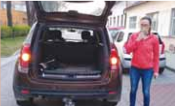
Prostějovští strážníci převezli otrávenou labuť do prostějovského Ekocentra Iris.

Nejčastější příčinou úhynu vodních ptáků v létě je otrava jedem botulotoxinem, který produkuje mikroorganismus Clostridium botulinum vyskytující se běžně v bahně i v písku. Při špatném oxyličování vod odumírají různé řasy a sinice a vznikají tak ideální podmínky pro pomnožení této bakterie. Ptáci se pak otráví pozřením různých bezobratlých živočichů, vodních či suchozemských (například larev hmyzu), v jejichž tělech se botulotoxin hromadí. Příznaky otravy jsou ochrnutí svalstva, tudíž špatná pohyblivost, což znamená, že ptáci nejsou schopni chůze, letu ani potápění a mohou se proto i utopit. Úhynulý pták může být příčinou úhynu i jiných zvířat, sežerou-li jej, proto je potřeba mrtvá těla neškodně odstranit. Zdroj: www.svs.cz