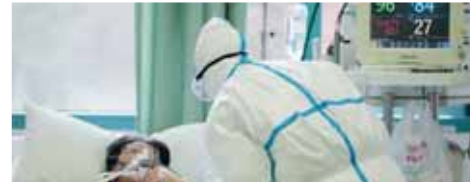
Počet pacientů s COVID-19 na infekčním oddělení prostějovské nemocnice poklesl. V Olomouckém kraji ale celkově rapidně narostl počet nemocných.

Z Prostějova ale mříž do světa v neděli 5. dubna večer i další dobrá zpráva. „Na infekčním oddělení prostějovské nemocnice je v tuto chvíli hospitalizováno čtrnáct pacientů, což je o tři méně než předtím týden. Všichni jsou ve stabilizovaném stavu. Jeden je ve stavu vážném a je v péči lékařů na oddě-