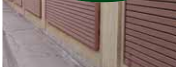
Výstavba protihlukové zdi v Okružní ulici je zatím pouze dílčím opatřením na snížení hluku v dané lokalitě.

„Jakékoliv snížení hlukosti je přínosem,“ konstatuje náměstek Jiří Rozehnal