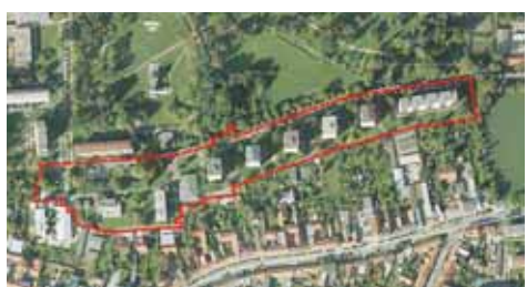
Sídliště B. Šmerala v Prostějově projde během tří let významnou rekonstrukcí. Stavební práce mají začít už letos v červnu.