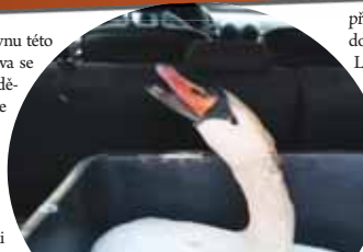
Z Prostějova putovala labuť do Ornitologické stanice Muzea Komenského v Přerově. Ještě při převozu to s ní vypadalo celkem nadějně.

vidá tomu, že příčinou úhynu této labuť byl botulotoxin. Pítva se však v tomto případě nedělala. Je drahá a nařizuje se jen v některých případech. Teorii o botulotoxinu však nasvědčuje i fakt, že před úhynem labuť bylo relativně teplo a rybník byl na nízkém stavu vody. Svoji roli mohlo sehrát i krmení labutí ze strany lidí. Zbytky pečiva mimo jiné znečišťuje vodní toky a podporují množení