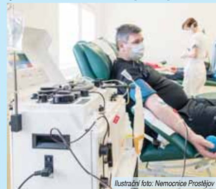
Ilustrací foto: Nemocnice Prostějov

Nemocnice Prostějov s tím, že primárně potřebují dárcy s minúsovým Rh faktorem. Zásobu odběrů plné krve krevních skupin Rh pozitivních má Hematologicko – transfúzní oddělení Nemocnice Prostějov zatím dostatečnou. Situace se však mění a brzy bude potřeba ji také doplnit. I v době epidemie koronaviru totiž lékaři pořád ošetřují akutní zákroky, jako jsou úrazy, prasknutí aneurysmatu, při kterých se na operačním sále během pár hodin spotřebují i desítky jednotek krve. V Česku je potřeba krev každé tři vteřiny a nikdo nikdy neví, kdy ji bude sám potřebovat. Každý člověk totiž za život obdrží průměrně pět transfúzí.