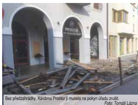
Bez předzahrádky. Kavárna Prostor ji musela na pokyn úřadu zrušit.