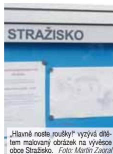
„Hlavně nosíte roušky!“ vyzývá dětem malovaný obrázek na vývěsce obce Stražisko.

Do dob, kdy už zase na tvářích ostatních místo roušek budou vidět úsměvy, se již nyní mohou ve své fantazii přenést děti ze Stražiska. Nejenže tak mohou někomu zpříjemnit nelehké dny, navíc díky tomu mohou i něco vyhrát. „Vyzvali jsme je, aby nakreslily cokoli, co jim teď chybí jako například setkání s kamarády, či návštěvy prarodičů. Je to na nich. Podepsané obrázky doplněné o věk vybíráme každý den v naší schránce u dveří obecního úřadu. Následně všechny práce zveřejníme na našich webových stránkách a dál je předáme potřebným – záchranářům, hasičům, řidičům, prodačům či seniorům.“