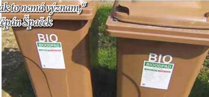
Množství svezeneho bioodpadu v Prostějově stoupá a tím i náklady města.