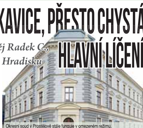
Okresní soud v Prostějově stále funguje v omezeném režimu.

Děni na soudě se však rozhodně nezařadilo. „V případě civilních sporů jsou stále vyhlášována rozhodnutí. Co se týče trestných činů, tak například na příští týden už je nařizováno hlavní líčení v jedné věci, které se bude konat v úterý 7. dubna,“ prozradil Večerníku Vrtěl. Před tribunálem by měl stanout Radek C. Opakovaně trestaný recidivista před Vánoci skončil ve vazbě poté, co měl vykrást kancelář společnosti FTL odkud vzal 149 dálničních známek.