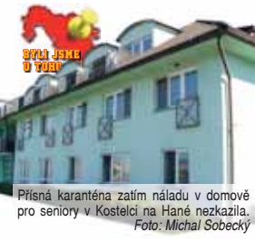
Přísná karanténa zatím náladu v domově pro seniory v Kostelci na Hané nezkažila.

Na závěr se omluvil, že nám nemůže podat ruku, ač by rád. Chápeme. Opatření, pokud mají fungovat, musí platit pro každého.