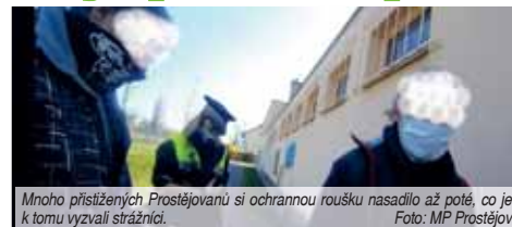
Mnoho přistřižených Prostějovanů si ochrannou roušku nasadilo až poté, co je k tomu vyzvali strážníci.

Kontroly vládních nařízení provádějí i státní policisté. Od pondělí 30. března do čtvrtka 2. dubna provedli policisté v teritoriu působnosti územního odboru Prostějov zhruba 170 kontrol