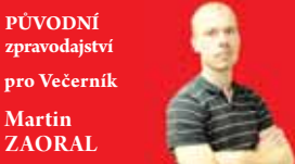
PŮVODNÍ zpravodajství pro Večerník Martin ZAORAL

PROSTĚJOVSKO Byl to obrovský boom. Zhruba od poloviny března kvůli koronavirové pandemii začala ve velkém i po celém regionu Prostějovska výroba roušek. Před galanteriemi se tvořily dlouhé fronty a stovky žen zasedly k šicím strojům, aby se pustily do výroby v té době naprosto nedostatkového zboží. Lidé začali dobrovolně nosit tuto ochrannou pomůcku, a kdo jí na veřejnosti neměl, ten riskoval inzultaci. Ve čtvrtek 19. března se roušky staly povinnou výbavou každého z nás, na veřejnosti se jejich nošení stalo samozřejmostí. Nyní se však přístup k nim postupně mění. Stále více občanů míní, že to již není potřeba. A to i přesto, že vláda ČR prozatím o uvolnění tohoto nařízení neuvažuje. Nejdříve prý na konci března. Večerník mapoval, jak to aktuálně s nošením roušek na Prostějovsku vypadá?