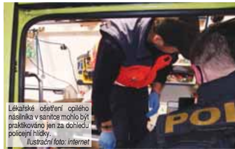
Lékařské ošetření opilého násilníka v sanitce mohlo být praktikováno jen za dohledu policejní hlídky.

Policistům se nakonec podařilo opilého násilníka zpacifikovat poté, co neurvalec dokonce napadl lékaře záchranky! „Vzhledem k nestandardnímu chování muže a z obav o jeho zdravotní stav policisté na místo povolali lékaře. Při pokusu o provedení prohlídky se však muž pokusil na lékaře zaútočit, v čemž mu policisté s využitím donucovacích prostředků