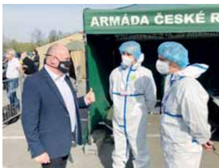
Příznivější. Taková je nyní situace s koronavirem v Olomouckém kraji.

PROSTĚJOV Velmi dobré zprávy hlásí po uplynulém týdnu Olomoucký kraj. Už druhým týdnem totiž pokračuje pokles počtu nových případů. Zatímco ve třetím dubnovém týdnu jich bylo padesát, tentokrát bylo v předešlých sedmi dnech v celém kraji zaznamenáno pouhých deset nových případů. Křivka označující nové potvrzené případy se tak prakticky narovnalá. Při pohledu na statistiky je namísto mírný optimismus. Olomoucký kraj, který byl původně oblastí s nejvyšším počtem nakažených na počet obyvatel, nyní zaznamenává výrazný úbytek nových případů. Za poslední dva týdny jich přibýlo na padesát, což není ani desetiprocentní nárůst. Konicno pak zůstává po celou dobu pandemie bez potvrzených případů. A situace se lepší také ve zdravotnických zařízeních. Například prostějovská nemocnice se specializovaným infekčním oddělením hlásí stabilní situaci. „Nemáme u nás žádný případ úmrtí, ani nepřibývají pacientů, jejich počet je