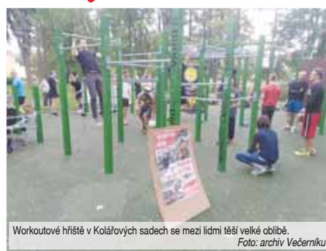
Workoutové hřiště v Kolářových sadech se mezi lidmi těší velké oblibě.

PROSTĚJOV Teplé počasí uplynulých dní vylákalo lidi do prostějovských parků. Velký nápor zazilo také workoutové hřiště v Kolářových sadech. To by podle slov zástupkyne firmy, která se stará o jeho provoz, mělo být zcela bezpečné.