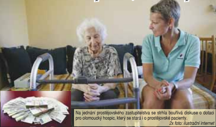
Na jednání prostějovského zastupitelstva se strhla bouřlivá diskuse o dotaci pro olomoucký hospic, který se stará i o prostějovské pacienty. Zx