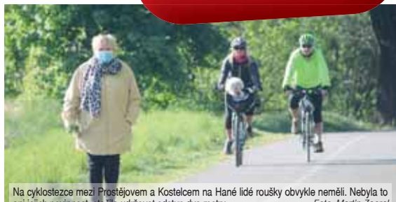
Na cyklostezce mezi Prostějovem a Kostelem na Hané lidé roušky obvykle neměli. Nebyla to ani jejich povinnost, stačilo udržovat odstup dva metry.

Stále více restaurací otevírá výdejní okénka, kde se dá koupit točené pivo. V těchto místech se tvoří čím dál početnější hloučky diskutujících lidí. Je přitom logické, že při konzumaci piva nemá nasazenou roušku ani jeden z nich. „Před hospodou u nás na sídlišti blízko sebe