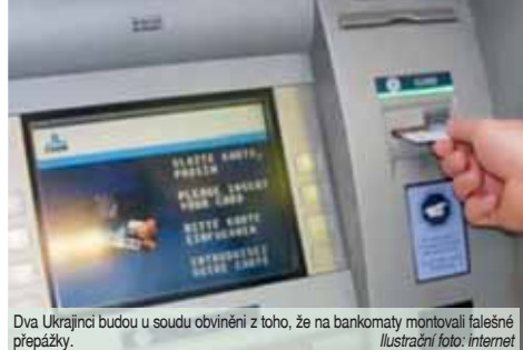
Dva Ukrajinci budou u soudu obviněni z toho, že na bankomaty montovali falešné přepážky.

niky a předvolané, ale v omezené míře také pro veřejnost. „Podmínkou je, že lidé kromě nošení ochranných pomůcek budou muset dodržovat také minimální vzdálenost půlmetru. Veřejnost může být tedy u jednání přítomna, nesmí však dojít k přeplnění kapacity soudní síně,“ vysvětlil předseda soudu