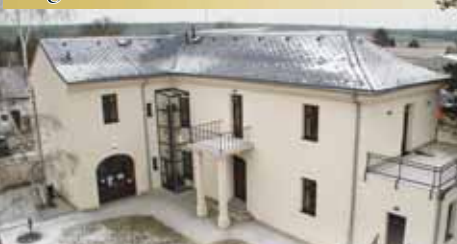
Muzeum v Dobromilicích informuje o tom, jak se zde žilo před válkami. Nabízí ale taky řadu pozoruhodných krátkodobých výstav.