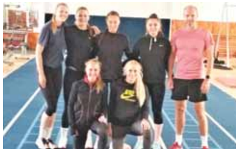
Společný snímek A-týmu volejbalistek VK Prostějov před pátečním tréninkem.

„Holky s tím nemají žádný problém, jsou disciplinované. Pokud je to nezbytné, nosí roušky, nedochází ke vzájemným kontaktům a pravidelně dezinfikujeme balóny i jiné tréninkové vybavení. Zdraví je na prvním místě, současně se snažíme znovu dostat děvčata do tempa, plynule přejít z individuální přípravy zpátky na skupinovou," přiblížil Novák.