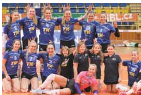
Posledně za sebou doma 3:0? To už byl pro volejbalistky VK Prostějov závor k rozpuštění kouskům s malými podavačkami míčů.

Po rovněž zmíněných Zubřicích z Píero-va to stejným poměrem 3:0 odnesli v tu dobu ztrápený Šternberk papírově slabší Fryčdek-Místek, a dokonce i zvedající se nebezpečný Liberec, který si odvezl deblat 25:16, 25:17, 25:11. Skvělá domácí bilance tak znela 5 setů, 15 vítězství a skóre 150! Načez do nedobytné prostějovské pevnosti zavítalo KP Brno, aby za stavu 25:12, 7:20 vše nezadržitelně