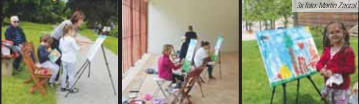
Workshop probíhal pod vedením zkušených lektorek. Před plenérem dali někteří přednost malování v zámecké oranžerii. Do malování se se chutí zapojila i pětiletá Alžbětka, která s babičkou přicestovala z Olomouce.