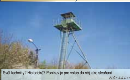
Švět techniky? Historické? Ponikve je pro vstup do něj jako stvořená.