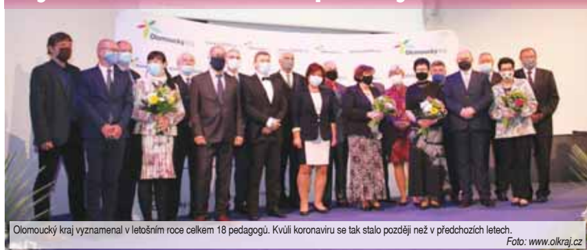
Olomoucký kraj vyznamenal v letošním roce celkem 18 pedagogů. Kvůli koronaviru se tak stalo později než v předchozích letech.

PROSTĚJOV Možná to z dob svých studií znáte sami – průměrný učitel vám něco povídal, dobrý učitel vám to byl schopný názorně ukázat a vysvětlit. Ale ti nejlepší z nich vás inspirovali. Právě takové hledal Olomoucký kraj. Tři z nich našel i v prostějovském regionu.