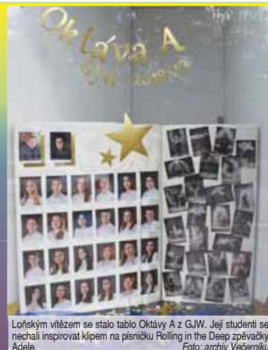
Loňským vítězem se stalo tablo Oktávy A z G.J.W. Její studenti se nechali inspirovat klipem na písničku Rolling in the Deep zpěvačky Adele.

Studenti, je to tedy na vás! Pokud byste se chtěli zúčastnit soutěže o zajímavé ceny, stále můžete své tablo přihlásit. Stačí poslat jeho fotografii na e-mailovou adresu editor@vecernikpv.cz. Pokud se ovšem v příštích dvou týdnech nesejde dostatečný počet účastníků, budeme muset letošní ročník soutěže bohužel vynechat. (mls)