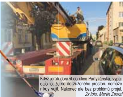
Když jeřáb dorazil do ulice Partyzánská, vypadlo to, že se do zúženého prostoru nemůže nikdy vejít. Nakonec ale bez problémů projel.

PROSTĚJOV Třileté martyrium nejruznějších dohadů je v konce. Před pár dny se v centru Prostějova začalo s přípravou tělocvičny u DDM Vápenice. Moderní stavba vyrůstající na místě nevzhledného asfaltového hřiště by měla být hotová v lednu příštího roku. Sloužit by měla pro školní potřeby, ale i florbalové kluby a další sportovní oddíly.