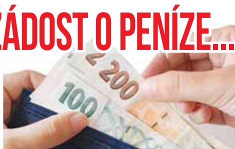
Z bleskového šetření kriminalisty vyplynulo, že „oběť loupeže“ předala zadrženému muži peníze dobrovolně.

Jelikož mělo jít o těžký zločin, do věci se vložili prostějořští kriminalisté. A případ byl bleskově objasněn! „Z důvodu podezření na zvlášť závažný zločin loupeže si své o hodinu později