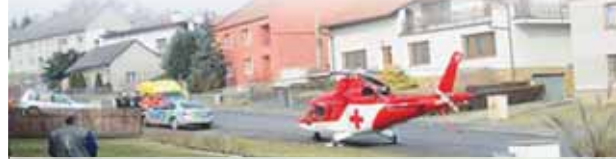
Takto před více jak dvěma lety zasahoval v Pěncíně záchranářský vrtulník.

PĚNCÍN Tohle je strašák každého rodiče. Následky na psychiku přitom mohou být v těchto případech devastující. Syndrom náhlého úmrtí kojenců (SNUK) dokáže skutečně na duši vytvořit dlouhý a temný STÍNMINULOSTI. V případě SNUK se jedná o nečekané úmrtí miminka, u něhož se ani po pitvě nepodaří zjistit příčina. Přesně k tomu zřejmě došlo v únoru 2018 v Pěncíně. Obrovská tragédie zasáhla před více než dvěma lety jednu z rodin žijící v domku nad místním obchůdkem. Manželé tehdy zavolali záchranu poté, co jejich osmiměsíční dítě náhle přestalo