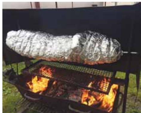
Prostějovští korfbalisté si opět pochutnali na pečeném prasátku.

Otravný covid-19 prostě místní korfbalisty nezastavil. (son)