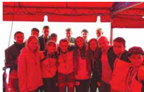
Starší žáci SK RG Prostějov neprohráli ve zrušené sezóně ani jedno utkání.