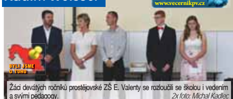
Žáci devátých ročníků prostějovské ZŠ E. Valenty se rozloučili se školou i vedením a svými pedagogy.