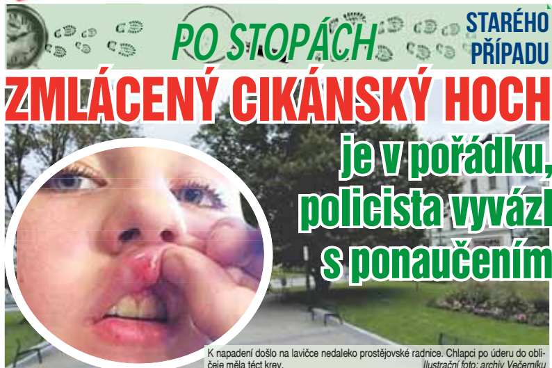
K napadení došlo na lavičce nedaleko prostějovské radnice. Chlapci po úderu do obličeje měla téct krev.

PROSTĚJOV Koncem loňského července měl zhruba třicetiletý policista před prostějovskou radnicí fyzicky napadnout čtrnáctiletého cikánského chlapce. Dle výpovědi svědků jej uhořdilo do tváře, až mu začala téct krev. Důvodem bylo podezření z údajné krádeže. Té se však chlapec dopustit nemohl, na náměstí totiž s celou školní třídou přišel pár minut před incidentem. Případ vyvolal řadu reakcí, a tak jsme se rozhodli k němu ještě s odstupem času vrátit.