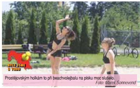
Prostějovským holkám to při beachvolejbalu na písku moc slušelo.