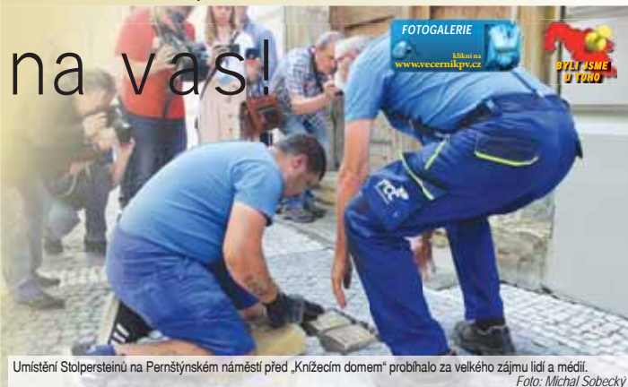
Umístění Stolpersteinů na Pernštýnském náměstí před „Křižáckým domem“ probíhalo za velkého zájmu lidí a médií.

PROSTĚJOV Hanácký Jeruzalém. Tohle označení města Prostějov vešlo ve všeobecnou známost. A není nahodilé, před 2. světovou válkou zde žila početná a prosperující židovská komunita. Holocaust, během kterého nacistické Německo vyvraždil většinu židovské populace v Evropě, ale všechno změnil. A na židovské sousedy zůstala často jen vzpomínka. Aby alespoň ta vydržela, připravil spolek Hanácký Jeruzalém spolu s městem další ukládání pamětních kamenů za zmizelé, takzvané Stolpersteinů. U toho Večerník samozřejmě nemohl chybět.