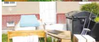
Chování některých lidí je skutečně těžko pochopitelné. Za tento nepořádek u kontejnerů hrozí dvěma osobám až padesátitisícová pokuta.

nad tím ovšem měla jen mávnout rukou a následně odejít. Strážníkům se v průběhu dne na druhý pokus podařilo dotýčenou v místě bydliště zkontaktovat. Jednadvacetiletá dáma se k protiprávnímu jednání doznala,“ sdělila k prvnímu případu Tereza Greplová, tisková mluvčí Městské policie Prostějov.