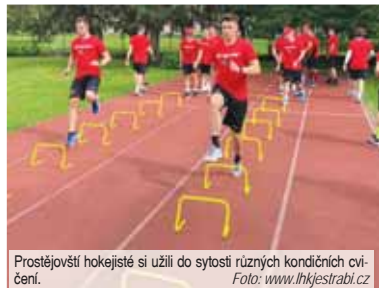
Prostějovští hokejisté si užili do sytosti různých kondičních cvičení.