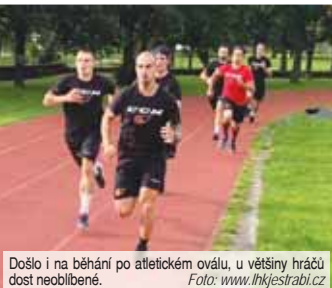
Došlo i na běhání po atletickém oválu, u většiny hráčů dost neoblíbené.