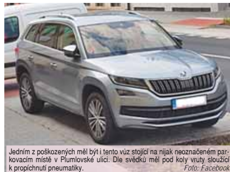
Jedním z poškozených měl být i tento vůz stojící na nijak neoznačeném parkovacím místě v Plumlovské ulici. Dle svědků měl pod koly vruty sloužící k propíchnutí pneumatiky.