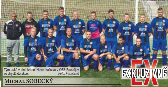
Tým Luké v plné kráse. Nové mužstvo v OFS Prostějov se chystá do akce.