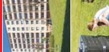
Některé děti v okolí parku trápí obyvatele. Mladí lidé často odhazují odpadky na nevhodných místech, což způsobuje nepříjemnou vůni a narušuje vzhled okolí.

PROSTĚJOV Senátorka Jitka Chalánková se setkala s náměstkem ministra spravedlnosti, aby se sešla a jednala o opatrovnickém soudě. Chalánková uvedla, že opatrovníkové soudy budou znát trestní minulost žadatelů o pěstounství. To je důležitá změna, která umožní lépe chránit děti před potenciálně nevhodnými opatrovníky.