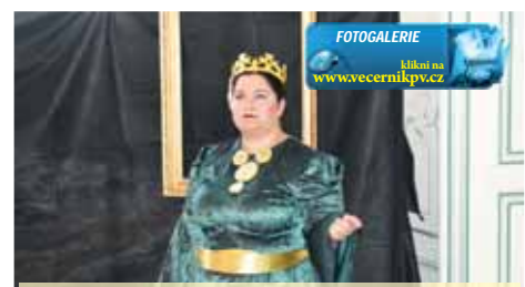
FOTOGALERIE klikni na www.vecernikpv.cz