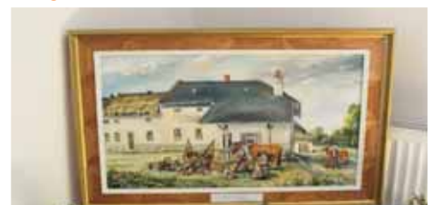
K vidění jsou i nádherné historické obrazy, na snímku práce kováře po roce 1918.

Většinu obrazů tvoří olejomalby doplněné perokresbami a linoryty. Na těchto dílech jsou k vidění historické okamžiky z každodenního života až po konkrétní oslavy dnešní doby. Divák může například porovnat pivníské žně před dávnými lety a jak probíhají v dneš. Prostřednictvím obrazů je možné zhlédnout například různé historické mláčky či stroje na vyorávání brambor. Ze současnosti nechybí ani různé oslavy, které se váží právě k výročí republiky. „Na dalších jsou zachyceny konkrétní akce. Můžete tu vidět