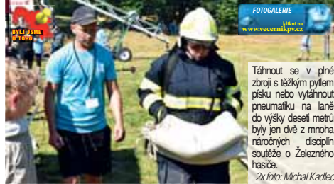
FOTOGALERIE klikni na www.vecernikpv.cz

těžkou pneumatiku, čekají je dvě náročné disciplíny s těžkým kladivem, musí v běhu táhnout pytel s písek, přelézt vysokou překážku, převrátit přetěžkou pneumatiku z traktoru a další náročné disciplíny. A když si vezmete, že toto všechno musí absolvovat v dnešním vedru a v plné výstroji vážící až pětadvacet kilogramů, tak skutečně klobouk dolů“, popsal nástrahy závodu Sosníková. Jednotlivé hasiče doprovázeli na každém kroku rozhodčí, kteří dohlíželi na přesné splnění daného úkolu. V cíli pak soutěžící padali vysílení. Závody měly ale v obrovském horku parádní atmosféru, staré určické hřiště se zaplnilo nejen rodinnými příslušnými závodníky, ale na zápalení záchrannářů se přišly podívat i desítky obyvatel Určic. „Pro naši obec je to obrovská prestiž pořádat takové závody: Abych pravdu řekl, nic takového jsem ještě na vlastní oči neviděl a obdivuji všechny hasiče, kteří se v tak velkém horku do náročné překážkové dráhy, na které navíc musí splnit spoustu fyzicky těžkých úkolů, pustí“, sdělil Večerníku