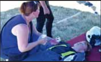
Adepti na Železného hasiče padali do cíle vysílení. V tom horku nebylo divu.