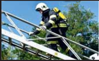
Vylézt po záchrannářském žebříku do výšky deseti metrů bylo hodně náročné.