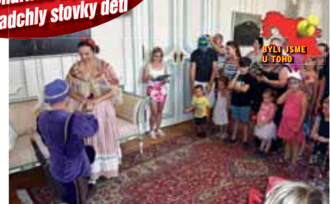
BYLI JSMO U TORO