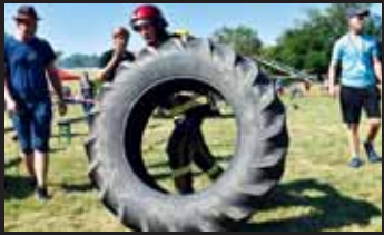
Těžkou pneumatiku od traktoru dokázala zvednout i tato drobná dívka.