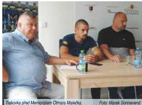
Tiskovka před Memoriálem Otmar Malečka.

„Silnice je v cyklistice samozřejmě víc, takže ambice do budoucna mám hlavně tam, ale rozloučit se nechci ani s milovanou dráhou. Částečně chci na ni jezdit pořád, zároveň však mám už od kadetů jasno, že postupně přejdu k silničním závodům.“