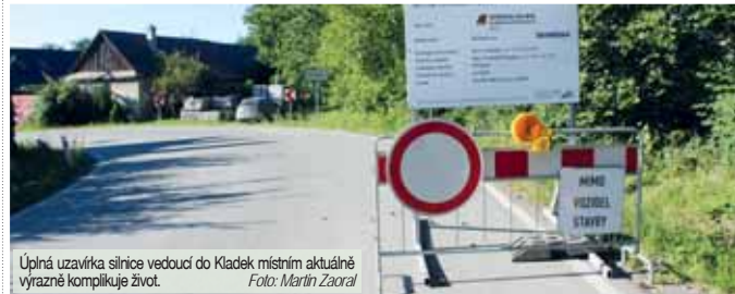
Úplná uzavírka silnice vedoucí do Kladek místním aktuálně výrazně komplikuje život.

Rozsáhlé opravy probíhají v režii Správy silnic Olomouckého kraje, obec přispívá částkou 1,8 milionu korun na rekonstrukci obrubníků lemujících silnici. (mls)