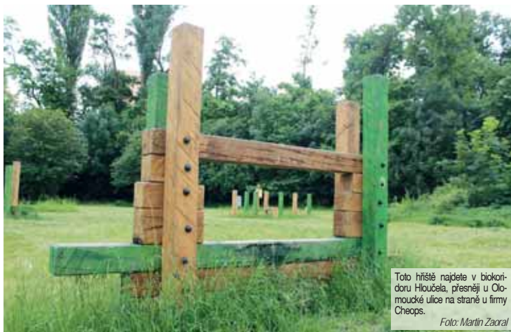
Toto hřiště najdete v biokoridoru Hloučela, přesněji u Olomoucké ulice na straně u firmy Cheops.

NEBUDE Vyrazit sportovat přes překážky můžete na Dolní či k Hloučele