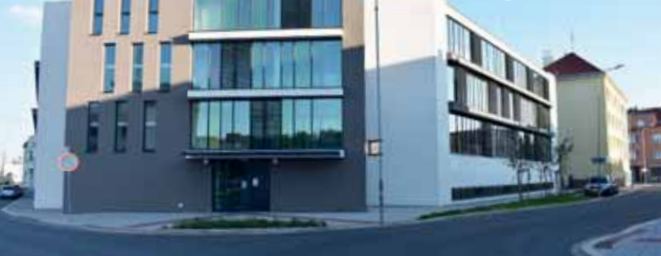
Komunitní dům v centru města byl terčem kritiky, své nájemníky si však nakonec poměrně rychle našel.

PROSTĚJOV Vypadalo to jako jeden velký průšvih. Ale nakonec to dopadlo ještě docela dobře. Komunitní dům v Sušilově ulici byl postaven za zhruba 96 milionů korun. Jednalo se o pořádnou ránu do rozpočtu, neboť magistrátu se proti původním předpokladům nepodařilo na jeho výstavbu získat dotaci. Přesto se jeho vedení rozhodlo stavět. Navzdory všem peripetiím to zpočátku vypadalo, že o byty určené seniorům nebude velký zájem. Ale pesimistické odhady se nenaplnily.