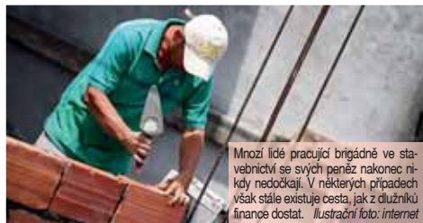
Mnozí lidé pracující brigádně ve stavebnictví se svých peněz nakonec nikdy nedočkají. V některých případech však stále existuje cesta, jak z dlužníků finance dostat.

prámo paní, která měla peníze za odvedenou práci dlužit. „Daný muž pracoval na faktury jako fyzická osoba. Problém byl v tom, že jsem tyto faktury neměla včas k dispozici. Proto jsem je nemohla ani proplatit,“ snažila se objasnit žena s tím, že je vše připravena dořešit. Na úplný konec ovšem připojila výhrůžku. „Zveřejnění výše uvedených věcí mě poškozuje, zvažuji, že celou věc předám svému právnímu zástupci,“ uzavřela.