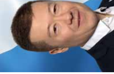
Tomio Okamura předseda hnutí SPD