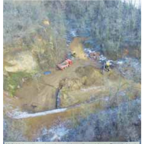
Majitel kolem chystané stavby nechal vytvořit vysoké valy. Ty možná bude muset brzy odstranit.

Policista z Nezamyslic se do budování střelnice v Koberčicích vrhl na konci roku 2017 navzdory odporu zastupitelstva obce i drtivé většiny místních. Objekt začal vznikat zhruba 300 metrů od centra Koberčic a 1 300 metrů od Brodruku v Prostějově. Lidé se v souvislosti s ní obávali zejména hluku a poklesu ceny svých nemovitostí. Majitel na místě nechal těžkou techniku vytvořit vysoké valy a upravit i okolí. Vše nasvědčuje tomu, že v rámci možnosti bude muset provedené změny uvést do původního stavu. Odpor vedení obce totiž trvá i nadále. „Už před časem bylo zahájeno řízení o odstranění stavby. To bylo přerušeno, neboť majitel požádal o dodatečné stavební povolení. K tomu měl