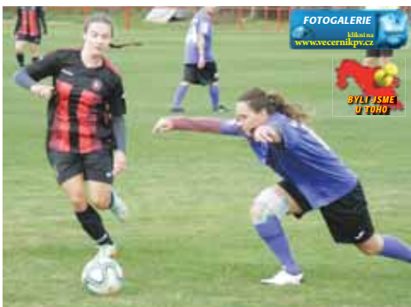
Souboje o míč braly obě strany s vervou.

Hrálo se od prvních minut prakticky na jednu branku, Držovice se dostaly před domácí branku ojedinele a gólmanku Bartoškovou prověřily obě hrotové hráčky Mekysková a Benková. To brankářka Držovic měla podstatně více práce a rozhodně se nenudila. První gól obdržela už v sedmé minutě, pak ale držela dlouho svým spoluhráčkám přijatelné jednohrankové manko. To se změnilo až po přestávce, kdy si domácí fotbalistky mezi padesátou a sedm-