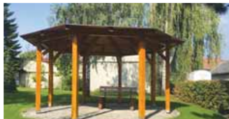
Priority současného vedení obce – stavba altánku namísto opravy chátrající kapličky.