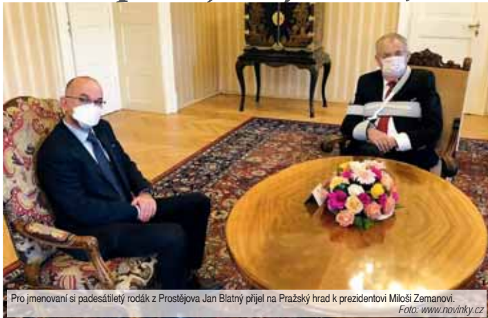
Pro jmenování si padesátiletý rodák z Prostějova Jan Blatný přijel na Pražský hrad k prezidentovi Miloši Zemanovi.

PROSTĚJOV Novopovězený ministr zdravotnictví Jan Blatný (na snímku) nastoupil do svého nového úřadu v této těžké době uplynulý čtvrtek 29. října. Po navržení předsedou vlády Andrejem Babišem jmenoval prostějovského rodáka přímo na Pražském hradě prezident České republiky Miloš Zeman. Ministr, který doposud působil jako primář dětské nemocnice Fakultní nemocnice Brno a zároveň náměstek celé FN, se vrhl do boje s epidemií koronaviru pokorně. Více o jeho nástupu do funkce si můžete přečíst na straně 28 dnešního vydání. Večerníku se však ještě těsně před uzavěrkou tohoto čísla podařilo doslova na poslední chvíli získat s padesátiletým hematologem unikátní autentický rozhovor.