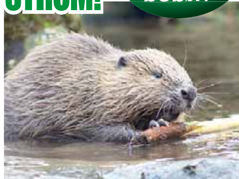
Všichni si mysleli, že se bobří v Čechách pod Kosířem už nezavá. Co bylo příčinou úhynu chráněného zvířete, nikdo neví.

ČECHY POD KOSÍŘEM Po loňskýchbleskových záplavách našli v parku v Čechách pod Kosířem uhynulého bobra. Po roce Večerník zjišťoval, zda se vodní hlodavci do parku vrátili, či nikoliv.