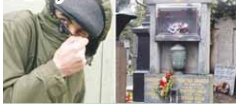
Zatím neznámý pachatel využil nepozornosti návštěvnice hřbitova a okradl ji o odloženou kabelku.