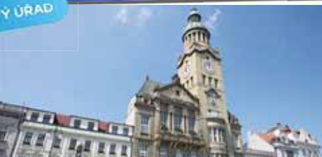
Prostějovský magistrát dosáhl na prvenství v motivační soutěži o nejpřívětivější úřad České republiky.

šení vítězů mělo dojít v rámci konference Moderní veřejná správa. I ta byla ovšem kvůli epidemickým opatřením zrušena. Vítězové v jednotlivých krajích tedy obdrží distanční formou tradiční samolepku stvrzující přívětivost, kterou si úřady vylepují na vchodové dveře, a také diplomy. Pro první tři jsou připraveny trofeje.