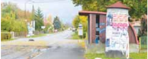
Někteří řidiči míří do Prostějova po projeti uzavřenou ulicí s oblibou pokračují dál přes chodník vedoucí kolem autobusové zastávky.