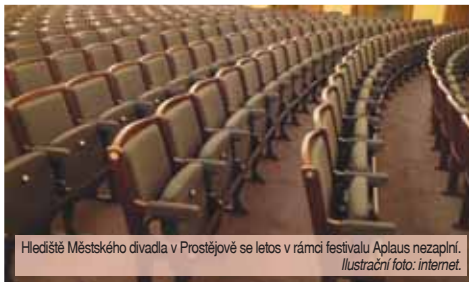
Hlediště Městského divadla v Prostějově se letos v rámci festivalu Aplaus nezaplňuje.