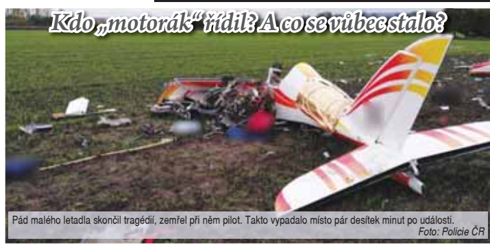
Pád malého letadla skončil tragédií, zemřel při něm pilot. Takto vypadalo místo pár desítek minut po události.