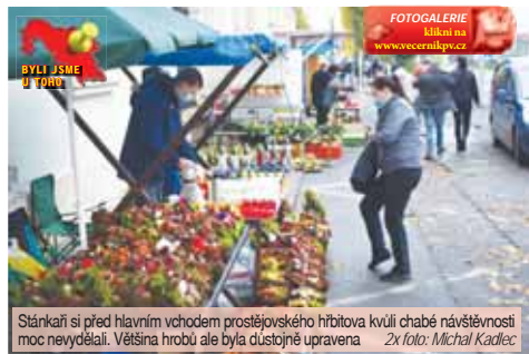
Stánkaři si před hlavním vchodem prostějovského hřbitova kvůli chabé návštěvnosti moc nevydělal. Většina hrobů ale byla důstojně upravena. Zk foto: Michal Kadlec