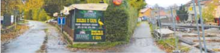
Jakmile řidiči přijedou k rozestavěnému mostu, místo toho, aby se vrátili, najedou na jinak málo frekventovanou silnici, která je nyní zcela uzavřená.