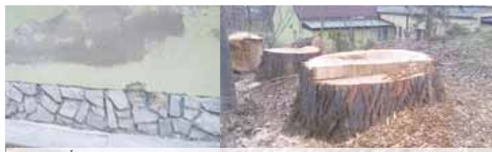
Kulturní dům v Čelčicích v původním neosvětleném stavu fasády a vykáčené letité topoly před ním.