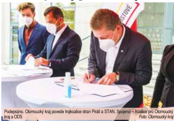
Podepsáno. Olomoucký kraj povede trojkoalice stran Piráti a STAN, Spojenci – Koalice pro Olomoucký kraj a ODS.

Rada Olomouckého kraje bude mít celkem jedenáct členů. Čtyři křesla obsadí Piráti a Starostové, stejný počet bude patřit Spojencům – Koalici pro Olomoucký kraj a tři ODS. (red)