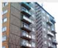
Původní stav bytového domu - havarijní stav balkonů