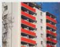
Realizace přistavěných lodžii - nahradí balkonů lodžierem