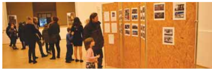
Takto to v konickém komunitním centru vypadalo během slavnostního otevření na konci letošního roku.