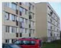
Původní stav bytového domu - francouzská okna bez balkonů