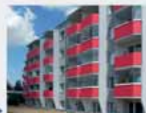
Realizace přistavěných lodžii - včetně bytu, kde dříve balkon nebyl