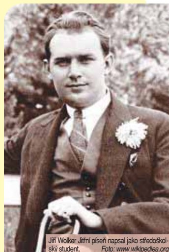
Jiří Wolker Jitřní píseň napsal jako středoškolský student.

Tam v mlhách krvavých den slunce tiší. Uy myslíte, že nezasvítíte sem? Ach věřte jen, a věřte celou duši – a věrou svou i slunce unesem!