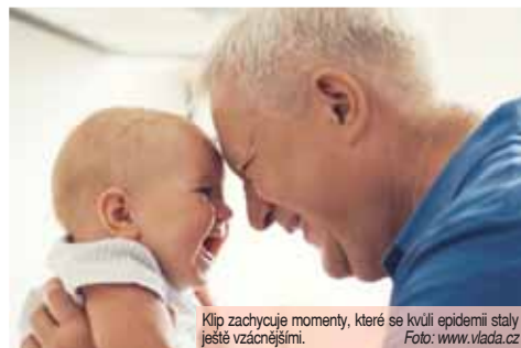
Klip zachycuje momenty, které se kvůli epidemii staly ještě vzácnějšími.

Celý klip je založen na kontrastu záberů lidí užívajících si vládnou zakázaných aktivit, mezi něž patří například chůze na koncerty či posezení v hospodě, a lidí bojujících s epidemií koronaviru. To vše za přednesu prvních dvou slok Jitřní písně Jiřího Wolkerja. Na ty pak navazuje dovětek o prospěšnosti očkování. „Vakcinace je neefektivnější způsob, jak dlouhodobě zastavit šíření epidemie u nás i ve světě. Očkování pomohlo už v minulosti ke snížení, či dokonce vymýcení řady nemocí,“ uvádí úřad vlády na svých webových stránkách. Spot v těchto dnech vysílají tři celoplošné televizní stanice – Česká tele-