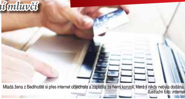
Mladá žena z Bedihoště si přes internet objednala a zaplatila za herní konzoli, která jí nikdy nebyla dodána.

Podobných případů podvodů při nákupech online v Prostějově neustále přibývá a policisté apelují na veřejnost, aby byla velice opatrná. „Nakupování přes internet je stále oblíbenější, zákazník totiž nemusí