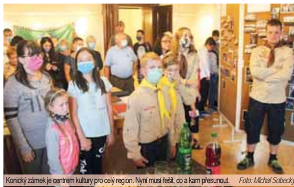
Konický zámek je centrem kultury pro celý region. Nyní musí řešit, co a kam přesunout.

Kulturní pracovníci zatím loni a letos pocítili větší nároky na organizační schopnosti než obvykle. Zejména v dohodě s autory a hledání náhradních termínů. „Budu muset do zbývajících měsíců přeskupit ty autory, kteří se buď nedají odbyti na další rok, nebo jsou pro mě příliš důležití,“ povzddechla si Lucie Krejčí. Galerie přitom loni ukázala, že dokáže uspořádat pěkné akce i ve stínu koronaviru. Ohlas vzbudila třeba výstava uměleckého sdružení Pampelkoc, přímo narváno bylo na expozici místních skautů.