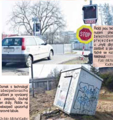
Řidiči jsou teď nuceni před železničním přejezdem u „mysí díry“ zastavit a pořádně se rozhlédnout.