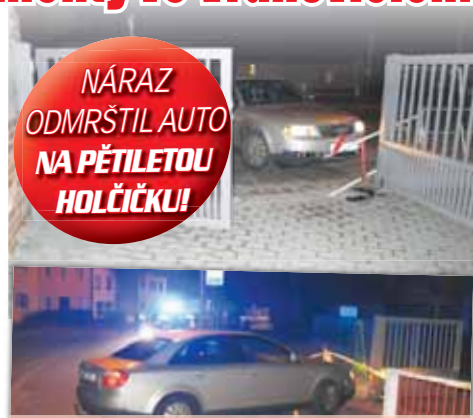
Po nárazu do zábradlí bylo auto vymrštěno na malou chodky a posléze skončilo v bráně školy.

„Během podvečera čtyřicetiletý řidič s osobním vozidlem značky Audi v prostějovské místní části Vrahovice. Při projíždění mírně levotočivě zatáčky, když odbočoval na ulici Vrahovická z ulice Čs. armádního sboru, nezvládl řízení, dostal smyk a narazil vpravo do ocelového zábradlí. Po nárazu bylo auto odhozeno na chodky, dítě předškolního věku, a dál pak narazilo do vjezdové brány školy. Dítě bylo na místě ošetřeno zdravotním personálem a sanitkou převezeno na další vyšetření do nemocnice,“ informovala Miluše Zajícová,