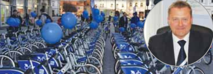
Od dnešního dne pokračuje v Prostějově projekt sdílených kol. „Půjčování bicyklů v našem městě už zdomácnělo,“ pochvaluje si Jiří Pospíšil (na snímku ve výjezu).

„Bikesharing u nás zdomácněl,“ pochvaluje si první náměstek primátora Jiří Pospíšil