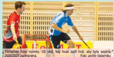
Florbalisté hlásí novinky. Už vědí, kdy musí začít hrát, aby byla sezóna 2020/2021 zachráněna.

PROSTĚJOV S dalším plánem, jak zachovat soutěžní ročník 2020/2021 a zároveň sportovně rozhodnout o postupech a sestupech, se představila Česká florbalová unie. Minulý týden uveřejnila rozhodnutí výkonného výboru. Podle něj vedení unie nadále počítá s tím, že se soutěže odehrají! Nadále je ve hře i varianta, že by se sezóna, která obvykle končí na přelomu dubna a května, protáhla až do letních prázdnin. I tak je už prakticky jisté, že kluby přijdou o část plánovaných utkání. „Pokud bude možné soutěže zahájit do vikendů 13. a 14. března, pokračuje se se zkrácenou základní částí