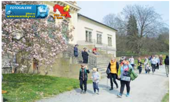
Jedinečným zámeckým parkem ve skupinkách korzovaly stovky lidí.

„Bylo skvělé, že vyšlo počasí a člověk se v tak krásný den mohl projít v úžasném zámeckém parku. Vycházku spojenou s pátrací hrou jsme si užili a spousta se toho navíc dozvěděli. Postup na výrobu léta-