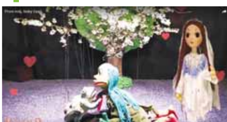
Vodník libající žábu snil o půvabné princezně, o čem snila žába, není záhadou.

O YouTube kanálu divadelního souboru Pronitka, jehož členové za normálních okolností vystupují každou neděli v prostějovské sokolovně, vás už Večerník informoval. Kromě dvou pohádek se zde objevují i videa k nejruznějším příležitostem. A nejinak tomu bylo i v případě prvního máje, kdy jsme si připomněli svátek lásky. Ve zhruba minutovém klipu se postupně políbili nejen princ s princeznou či dědeček