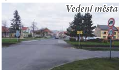
Foto: Správa železnic upozorňuje, že přejezd u bývalého kina je místem častých nehod. S jeho případným zrušením však místní nesouhlasí.

Zatím poslední vážná havárie na nechráněném přejezdu u bývalého kina v Kostelci na Haně se stala koncem letošního února, kdy vlek smetl škodovku. Záchranáři mu