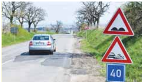
Od poloviny uplynulého týdne je silnice v úseku tzv. ohrozimského kopce již po celé délce vyspravená.

Podobně to bude i pro ty, kteří by chtěli do Vicova jeze směru od Lešan. Ti budou muset pokračovat ve směru do Zdětína a Ptení. Uzavírka by měla trvat až do 12. července. „Na ni plynule naváže další, tentokrát se však bude týkat