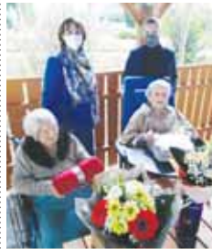
Jubilantkám přišli poblahopřát primátor

Primátor i senátorka blahopřáli i dalším „stovkačkám“