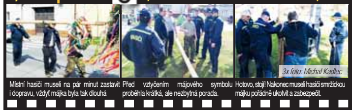
Místní hasiči museli na pár minut zastavit dopravu, vždyť májka byla tak dlouhá. Před vztyčením májového symbolu proběhla krátká, ale nezbytná porada. Hotovo, stojí! Nakonec museli hasiči smržickou májku pořádně ukotvit a zabezpečit.