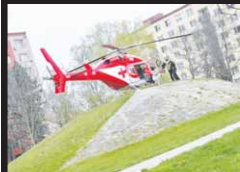
Ani rychlá pomoc lékařů letecké záchranné služby nedokázala zabránit tragédii.

Pohřeb ani ne čtyřicetileté O. N. se koná ve středu 5. května. Jak Večerník zjistil, tato sympatická dáma pracovala dlouhá léta jako pokladní v Kauflandu a posléze i v Tesco.