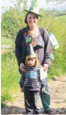
Vzhůru za kouzly! Čarodějnická stezka v Seloutkách bavila malé i velké.