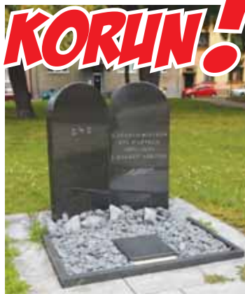
Spory ohledně využití prostoru před RG a ZŠ města Prostějova se již vedou od roku 2012.

stavit. Mlžilo se zejména kolem zámeru nadace uzavřít prostor před největší prostějovskou školou pro veřejnost. Proti tomu vznikla petice, jejíž signatáři byli zástupci nadace nepřímo označení za odpůrce židů. Vše vyvrcholilo umístěním plastové kopie náhrobku, po jehož