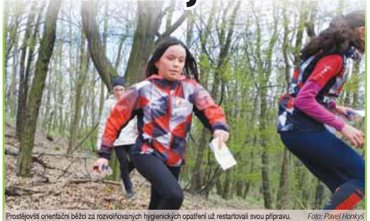
Prostějovští orientační běžci za rozvolňovacích hygienických opatření už restartovali svou přípravu.

akce orientačního běhu jedou navzdory covidu