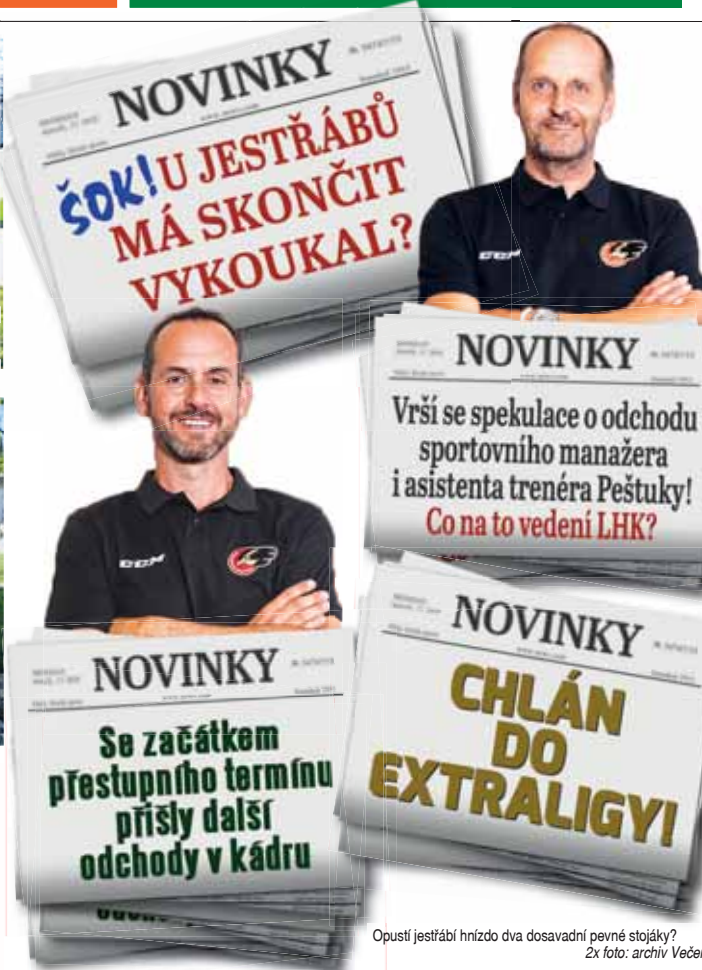
Opustí ještěří hnízdo dva dosavadní pevné stojáky?

Jaký dárek dostali místní hasiči od hospodského?