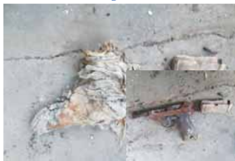
Muž našel pistoli ukrytou v kurníku zabalenu do kusu látky. Po rozebrání bylo vidět, že zbraň na místě ležela už pěknou řádku let.

OLŠANY U PROSTĚJOVA Muž z Olšan okamžitě přivolal policisty poté, co ve starém kurníku pro slepice našel zrezivělou pistoli s náboji. Těžko říct, jak dlouho byla tato zbraň ukrytá, a zda dokonce nepochází ze druhé světové války. To musí určit experti.