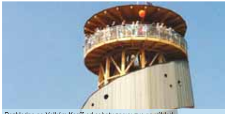
Rozhledna na Velkém Kosířích od soboty znovu zve na výhled.

1. května až 13. června pátek 14.00 – 19.00; soboty, neděle, svátky 9.00 – 19.00 hodin 14. června až 12. září pondělí až neděle 9.00 – 19.00 hodin 17. září až 30. září pátek 14.00 – 18.00; soboty, neděle, svátky 10.00 – 18.00 hodin říjen pátek 14.00 – 16.00; soboty, neděle, svátky 10.00 – 16.00 hodin