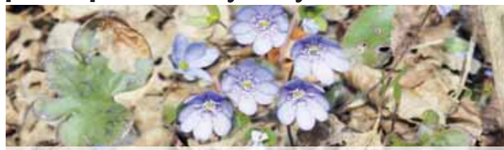
Jaterník podléška. S touto bylinou se setkáte hned na startu naučné stezky.

Nebojte se kopců? Máte rádi klid, toužíte po informacích a zároveň vám nevadí, když trochu potrápíte tělo? Pak vyrazte do terénu. Přinášíme už 13. díl seriálu o naučných stezkách Prostějovska. A ac má třináctka zkrátka špatnou pověst, tou vám snad přinese spíše štěstí. Tedy pokud se nebojte kopců. Naučná stezka Kladecko se totiž vyznačuje hned několika nej. Na Prostějovsku patří k nejdělsím a taky nejstarším. Rovněž ale k těm, které vedou nejvíce kopcovitým terénem. Zejména pokud půjdete v protisměru, tedy od Jesence, čeká vás hned na úvod slušné stoupání. My se ale vydáme naopak od začátku, který najdete ve hvozdech u vlakové zastávky Šubřof. Hned na úvod potěší vaše oči obrovské množství sasenek a jaterníků, které propůjčují zdejším kopcům a lesům bílo-fialovou barvu. Hned za prvními tabulemi navíc narazíte na prastarý vodní mlýn, který se jeho majitel-naděncem snaží dát dohromady. Třeba zprovozněním mlýnského kola. Dál už vás cesta zavede okrajem lesa směrem na Kladky. Čeká vás nejedna lůdka, kde můžete narazit třeba na chráněný upolín evropský. Ostatně hotel, na který po kilometru narazíte a který dnes prochází opravou, se taktéž nazýval Upolín. Po pravé ruce pak minete tábor. A brzy vás čeká rozhodování, jestli