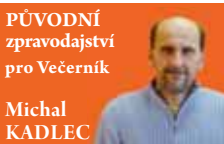
PŮVODNÍ zpravodajství pro Večerník Michal KADLEC