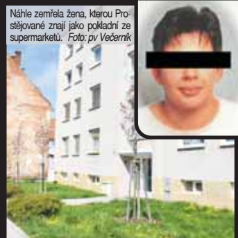
Náhle zemřela žena, kterou Prostějované znají jako pokladní ze supermarketu.