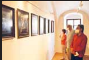
Snímky Jana Saudka, několik jeho obrazů a díla prostějovských fotografů zcela zaplnily galerii v prostějovském Špalíčku.