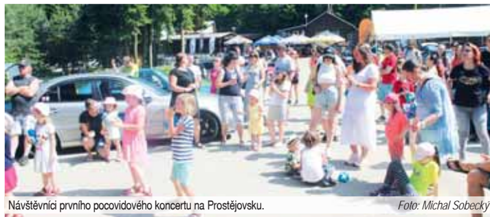
Návštěvníci prvního pocovidového koncertu na Prostějovsku.

EXKLUZIVNÍ reportáž pro Večerník Michal SOBECKÝ