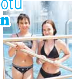
V sobotu měly tyto dvě dívky společně se svými maminkami kráský aquapark jen samy pro sebe.

„Přijeli jsme z Olomouce, protože u nás otvírají koupaliště až příští týden. Tady v Prostějově se nám ale líbí mnohem víc, je tu pohoda. Obzvláště když dnes máme celý aquapark jen pro sebe,“ zářila spokojeností jedna ze čtyř sobotních návštěvnic prostějovského aquaparku. „Možná by tady bylo daleko více lidí, ale například včera jsme nemohli pustit padesát nebo šedesát lidí, protože neměli žádné potvrzení o negativním testu na covid-19 nebo o očkování. To vidím jako hlavní zadržitel, který mnoho návštěvníků odradí od koupání,“ prozradil Večerníku plavčík. „To ale přece není žádný problém, my jsme se byly rády testovat u nás v Olomouci a trvalo nám to pár minut i s vytištěním potvrzení,“ zare-