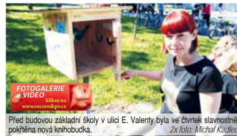
Před budovou základní školy v ulici E. Valenty byla ve čtvrtek slavnostně pokřtěna nová knihobudka.

také básničky. Na úplný závěr byla v pořadí už čtvrtá knihobudka v Prostějově pokřtěna „dětským šampaňským“.