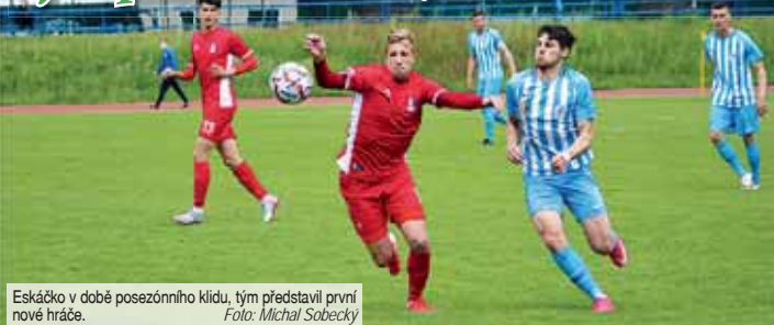
Eskáčko v době posezonního klidu, tým představil první nové hráče.

PROSTĚJOV Před týdnem skončila druholigová sezóna 2020/2021. Přestože však si na další zápasy nyní musíme pár týdnů počkat, dění kolem 1.SK Prostějov se nezaslabilo, naopak. V uplynulých dnech tým přišel nečekaně o trenéra a o oporu v defenzivě. Zároveň však celek vyhlásil první změny v sestavě – tedy i první příchody.