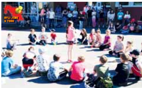
Kniha je naprosto neodmyslitelnou součástí naší výuky a jsem proto rád, že jsme ve spolupráci s Okrašlovacím spolkem mohli dětem nabídnout

Projekt nabízející směnu knižní papal tedy čtvrtý díl. „Naše učitelky už dříve uvedly v život projekt Čtení nás baví.