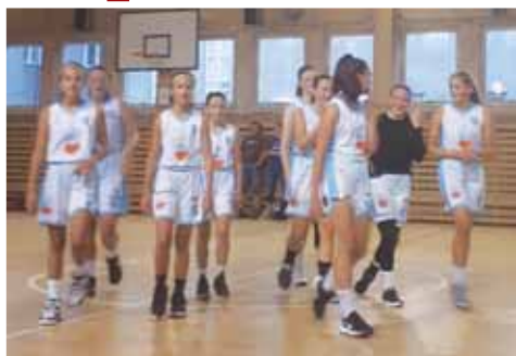
Basketbalistky Prostějova čeká náročný červen.

Boje, v nichž se utká ve dvou skupinách šest týmů, proběhnou 19. června v Prostějově. Kadetky jsou však jen jedním z mnoha týmů, které klub přihlásil. „Jinak do příští sezóny bude přihlašovat oblastní přebory v kategoriích U11 a U12 a ligy v kategoriích U14, 15, 17 a 19. Kromě U13 tak máme obsazeny všechny ka-