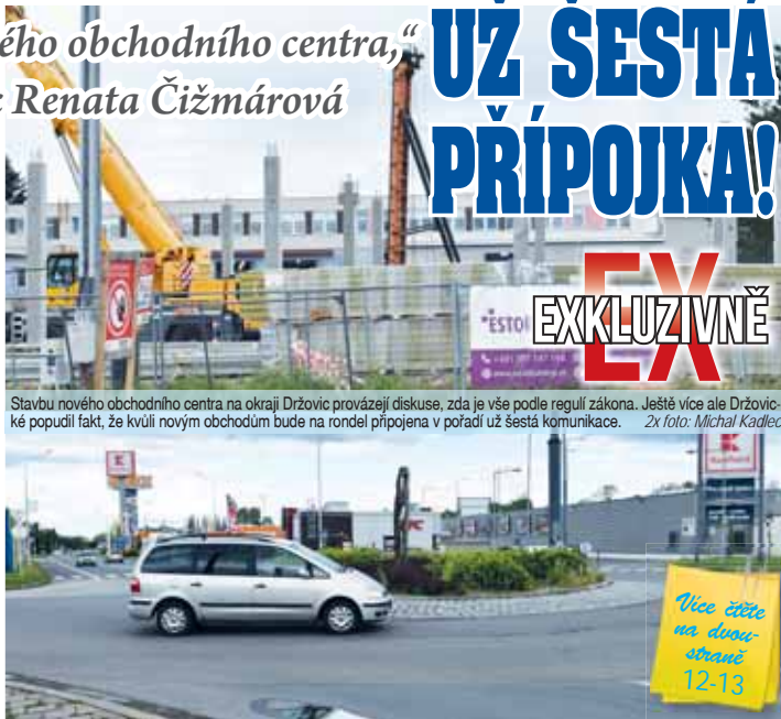
Stavbu nového obchodního centra na okraji Držovic provázely diskuse, zda je vše podle regulí zákona. Ještě více ale Držovic-ké popudil fakt, že kvůli novým obchodům bude na rondel připojena v pořadí už šestá komunikace.

s územně plánovací dokumentací Olomouckého kraje, který v této lokalitě staví severní obchvat. „Skutečnost, že stavební úřad povolil stavbu obchodního objektu v místě, kde to územní plán obce i krajské zásady územního rozvoje zakazují, a to navíc v místě veřejně prospěšné stavby, je alarmující. Stavba obchodního objektu navíc s největší pravděpodobností znemožní realizaci severozápadního obchvatu Prostějova, nebo její značně prodraží, čímž vznikne Olomouckému kraji či České republice značná škoda,“ tvrdí Renata Čižmárová.