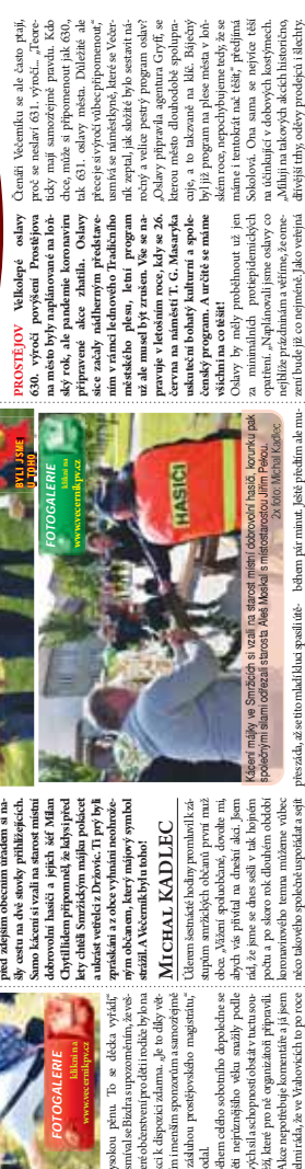
FOTOGALERIE: Jak se lidé bavili v Smřicích.

Smřice. Více vydatně zabráně odpočívání předcházejícímu období ve Smřicích. Na pondělí dne bylo slavnostní. Tato neděle byla poslední v sezóně. Všechny káčely byly zveselily a byly připraveny na cestu do zimního ústřížku.