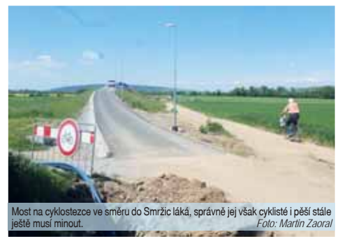
Most na cyklostezce ve směru do Smrčic láká, správně jej však cyklisté i pěší stále ještě musí minout.

úplně. Na vše jsme opakovaně upozorňovali, navíc značení o uzavření je umístěno už na rondelu u pernístýnského zámku. Kdo by jej přehlédl, má šanci ještě odbočit k zimnímu stadionu či k Hotelu Tennis club,“ vzkázal Rozehnal.