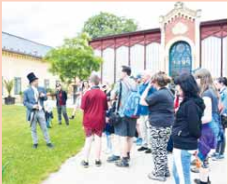
O kostýmované prohlídce zámekového parku byl loni velký zájem.

Zámek v Čechách pod Kosířem zve na program v souvislosti s tradičním Víkendem otevřených zahrad. Po oba dva dny v 10:00, 11:30, 13:00 a 14:30 budou připraveny kostýmované prohlídky parku s hrabětem rodu Silva-Tarouca. Prohlídka bude vhodná i pro rodiny s dětmi. V sobotu ve 14:00 hodin budou moci lidé vyrazit do parku s kastelánem, v neděli ve stejný čas pak s vedoucím parku. Přípravna bude rovněž pátrací hra pro děti, které se mohou těšit i na dílničky u Hanácké ambasády. Naspeciální prohlídky parku je nutná rezervace předem na e-mailu: rezervacecpk@seznam.cz nebo na tel.: 773 784 110.