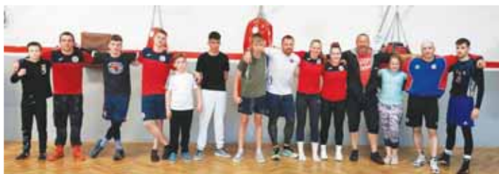
Rohovnická a rohovnice BC DTJ Prostějov obnovili své tréninky v klubové boxárně.

dokonce snímaly i televizní kamery. Nejblíže českým turnajem s účastí hanáckého oddílu bude 26. června zahajovací kolo Oblastní soutěže Jiho-moravské oblasti v Lipníku nad Bečvou. Trénovat se pak bude přes celé léto bez obvyklé prázdninové pauzy, neboť po dlouhých měsících mimo normální přípravu je potřeba dohnat nabrané manko. (sob)