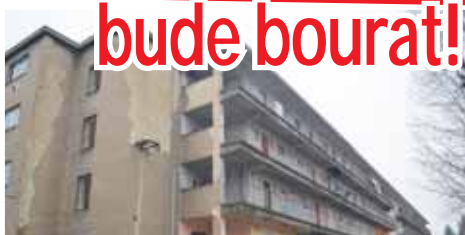
Bytový dům v ulici Šárka se bourat nebude, radní okamžitě vyvrátili nepodložené fámy.

PROSTĚJOV Emoce mezi obyvateli bytového domu v ulici Šárka číslo 9 a 11 vyvolala minulý týden fáma o údajném rozhodnutí, že nevábně působící „parlament“ má být srovnán se zemí! Možná by si to obyvatelé okolních nemovitostí přáli, ovšem přání je pouze otcem myšlenky! Smyšlený drb, který se rychle šířil na sociálních sítích a hlavně přímo mezi nájemníky celkem 88 bytů, ihned