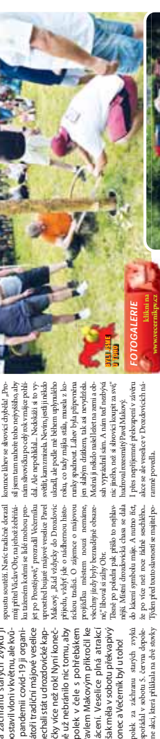
FOTOGALERIE: Jak se lidé bavili v Prostějově.

Prostějov. Velikonoční oslavy 630. výročí založení Prostějova. Oslavy vznikání Prostějova. Oslavy vznikání Prostějova. Oslavy vznikání Prostějova.